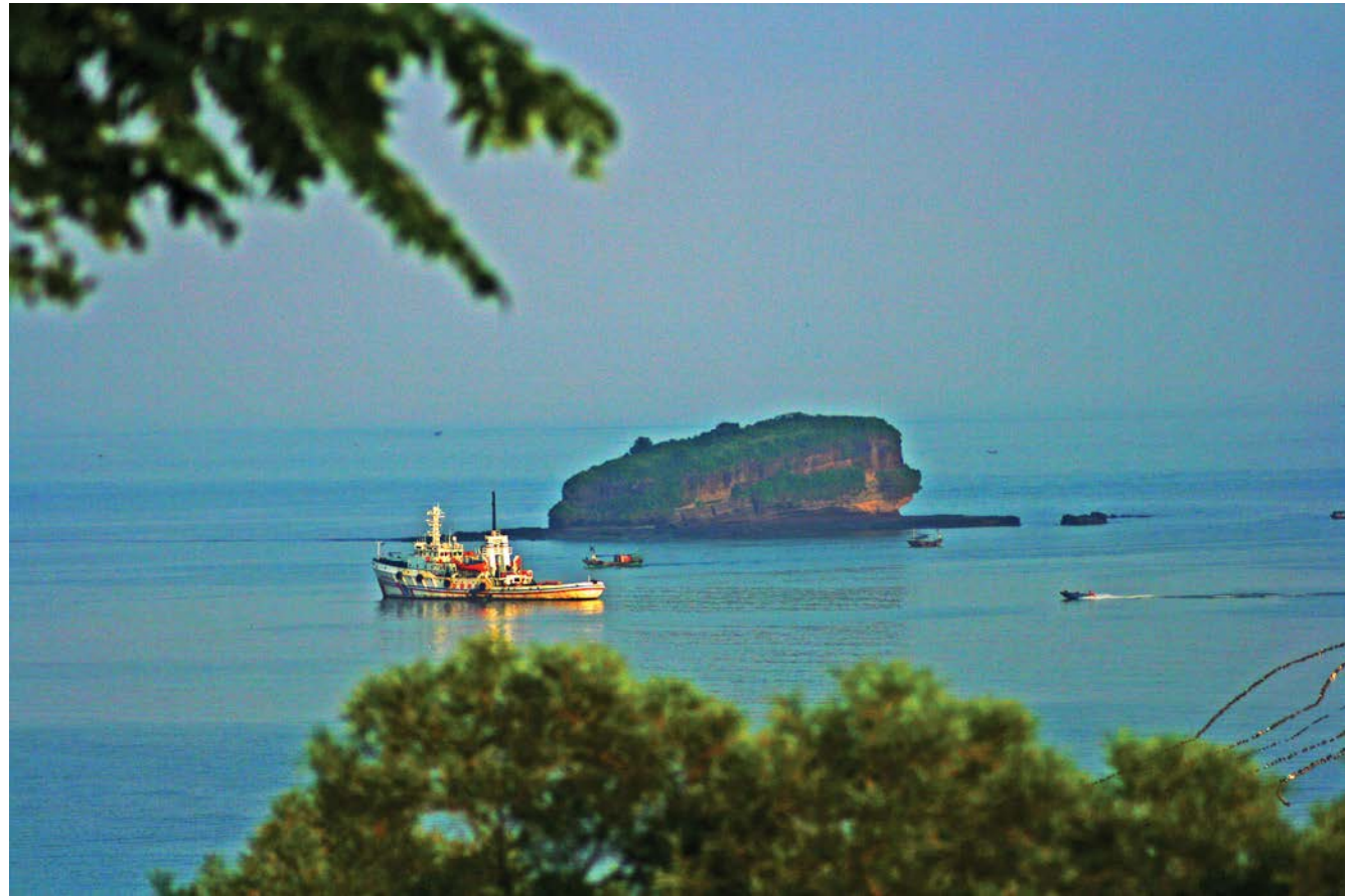
ເກາະເວີໂຈວກວາງຊີ 广西涠洲岛 半清图

ນ້ຳທະເລທຳມະຊາດໃຫຍ່ທີ່ສຸດຂອງແຂວງຈຽງຊຸ່, ຕ້ອນຮັບແຂກຫຼາຍກວ່າ 1 ລ້ານທີ່ອົນຕໍ່ປີ. ເມື່ອຍ່າງຢູ່ເທິງຫາດຊາຍອ່ອນ, ເລັງສາຍຕາສູ່ເສັ້ນເຊື່ອມຕໍ່ກັນລະຫວ່າງໜ້ານ້ຳທະເລຮວງໄຫວກັບທ້ອງຝ້າ, ປາສະຈາກຄວາມນັ້ນແຊວຂອງຕົວເມືອງ, ມີແຕ່ຄວາມສະບາຍໆ. ອ່າວທະເລຄືແບບນີ້ມີ 18 ບ່ອນຢູ່ເທິງເກາະລຽນຕາວ. ຄືອ່າວຄູ່ມາວ່ານມີທັງພູຜາ, ປ່າໄມ້, ໂງ່ນຫີນແປກປະຫຼາດ ແລະ ແຫຼ່ງທ່ອງທ່ຽວວັດທະນະທຳຢ່າງຫຼາກຫຼາຍ, ຈຶ່ງກາຍເປັນແຫຼ່ງທ່ອງທ່ຽວອັນຍອດຢ້ຽມໃນອ່າວ 18 ບ່ອນ.