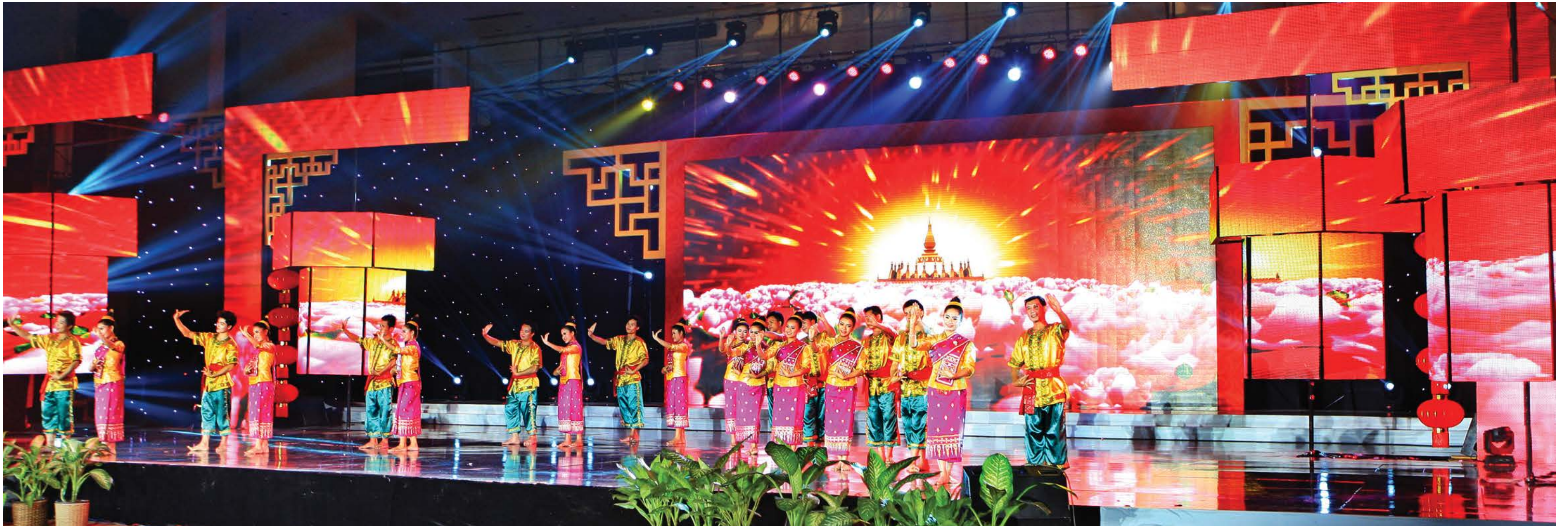
《ດອກຈຳປາ》ບົດຟ້ອນມູນເຊື້ອລາວ 老挝传统舞蹈《占芭花》