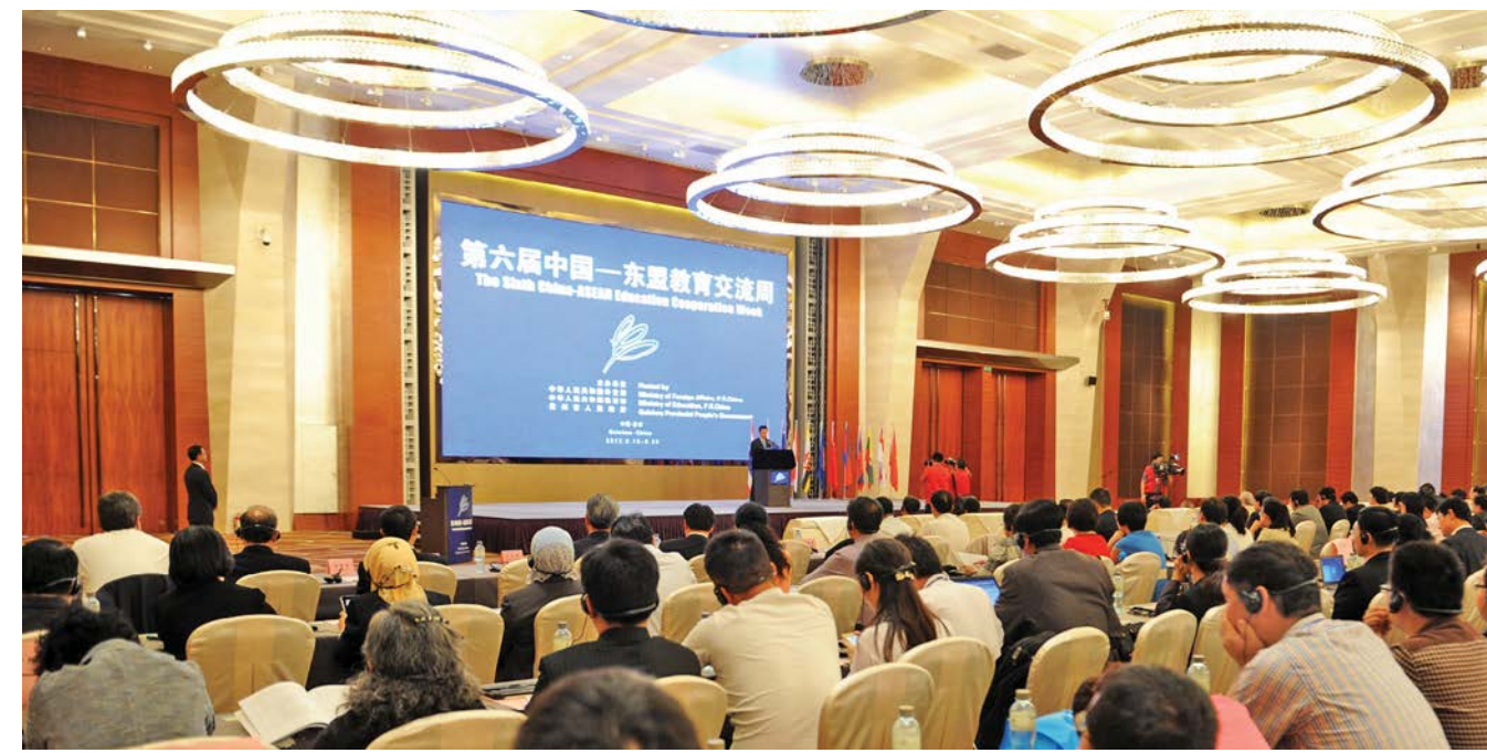
ສະຖານທີ່ຜິດສັບປະດາແລກປ່ຽນການສຶກສາຈີນ-ອາຊຽນຄັ້ງທີ 6 第六届中国—东盟教育交流周开幕式现场

ລັດ, ແມ່ນ 5 ເທົ່າຕົວຂອງ 10 ປີກ່ອນ, ການລົງທຶນລວມທັງໝົດຂອງສອງຝ່າຍໄດ້ລື່ນກາຍ 100 ຕື້ ໂດລາສະຫະລັດ. ແມ່ນ 3 ເທົ່າຕົວຂອງ 10 ປີກ່ອນ, 11 ເດືອນກ່ອນໃນປີ 2013, ຈຳນວນມູນຄ່າການຄ້າຂອງສອງຝ່າຍເພີ່ມຂຶ້ນ 10,9% ທຽບໃສ່ເວລາດຽວກັນໃນປີກ່ອນ, ເປັນຜູ້ນຳໜ້າໜູ່ຂອງການເພີ່ມຂຶ້ນໃນລະຫວ່າງຈີນກັບຄູ່ຄ້າສຳຄັນອື່ນໆ.