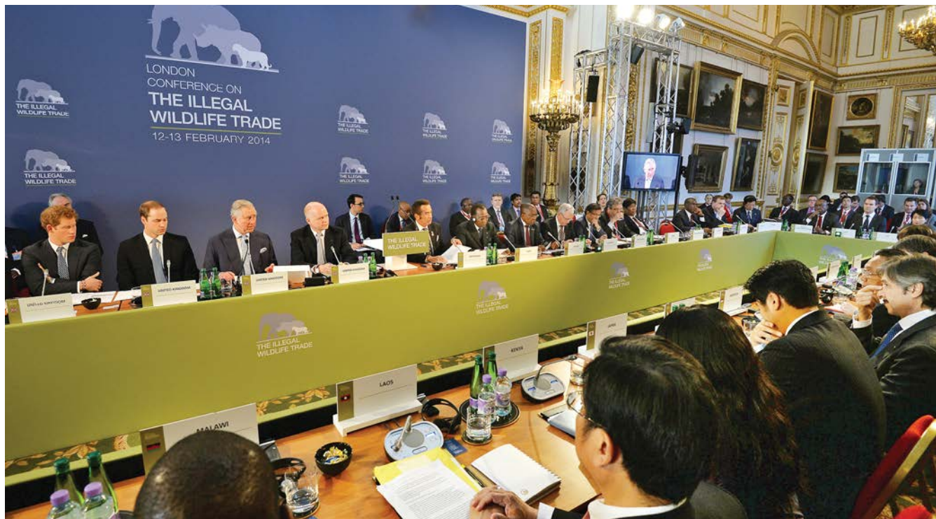
ສະຖານທີ່ສະຖານທູດອັງກິດປະຈຳລາວຈັດງານສົ່ງເສີມຄວາມຮັບຮູ້ກ່ຽວກັບການຄ້າສັດປ່າທີ່ຜິດກົດໝາຍ ອາດສະຕຣາລີ ມາດີກິດ

ກອງປະຊຸມລອນດອນ(London Conference) ກ່ຽວກັບການຄ້າສັດປ່າທີ່ຜິດກົດໝາຍຖືກຈັດຂຶ້ນ ໂດຍການເປັນເຈົ້າພາບຂອງທ່ານນາຍົກລັດຖະມົນຕີເດວິດ ຄາເມຣອນຮ່ວມກັບບັນດາສະມາຊິກຂອງພຣະລາດຊະວົງອັງກິດເຊິ່ງລວມມີເຈົ້າຟ້າຊາຍ ຊາຣສ໌(Prince Charles) , ມູນນີທິພຣະລາດຊະວົງດູກ ແລະ ດັຊເຊສ໌ແຜ່ງແຄນບຣິຈ໌(the Royal Foundation of the Duke and Duchess of Cambridge) ແລະ ເຈົ້າຊາຍແຮຣີ(Prince Harry) , ແລະ ເຊັ່ນດຽວກັນກໍ່ມີອົງກອນການ