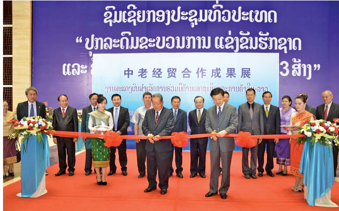
ທ່ານອາຊາງ ລາວລີ ຮອງນາຍົກລັດຖະມົນຕີລາວແລະທ່ານເອກອັກຄະລັດຖະທູດກວນຮວາປິງຮ່ວມກັນຕັດແຖບຜ້າໃນງານວາງສະແດງຜົນງານ ລາວ-ຈີນ ຮ່ວມມືສໍາເລັດການຮ່ວມມືດ້ານເສດຖະກິດແລະການຄ້າຈີນ-ລາວ