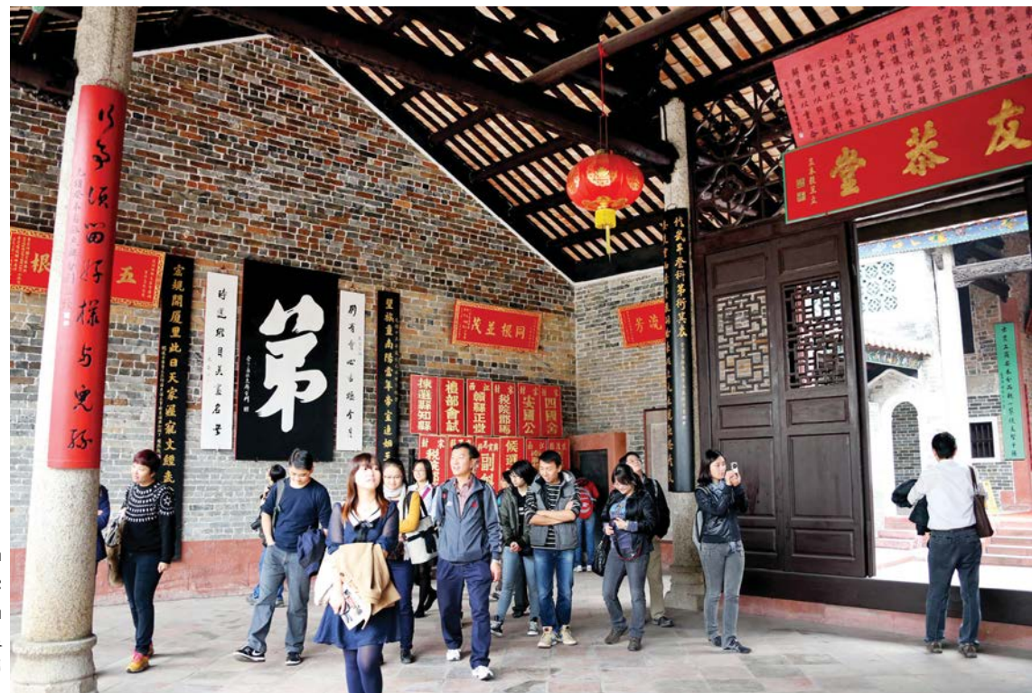
ວັນທີ 26 ເດືອນ 1 ປີ 2013, ສະຖາບັນຂົງຈີ້ຮົງກົງໄດ້ຈັດກິດຈະກຳສຳຫລວດວັດທະນະທຳຈີນຄັ້ງປະຖົມມະເລີກ 2013 年 1 月 26 日, 香港孔子学院首次举办中国文化考察活动

ອົງການສຶກສາປະເພດຄົ້ນຄວ້າຂອງຕ່າງປະເທດ; ໜ້າທີ່ວຽກງານສຳຄັນທີ່ສຸດຂອງສະຖາບັນຂົງຈີ້ກໍ່ແມ່ນສະໜອງປຶ້ມຮຽນພາສາຈີນທີ່ເປັນແບບແຜນ ແລະ ມີອິດທິພົນສູງສຸດໃຫ້ແກ່ຜູ້ຮຽນພາສາຈີນໃນໂລກ; ແລະ ເປີດຊ່ອງທາງແຫ່ງສະຖານທີ່ໃນການຮຽນພາສາຈີນທີ່ສຳຄັນ ແລະ ເປັນລະບົບມາດຕະຖານທີ່ສຸດ.