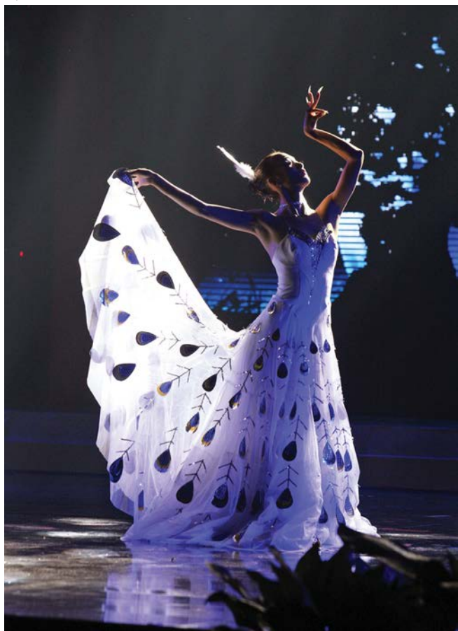
ບົດຝ່ອນ 《ອ້ວນນິກຍູງ》 舞蹈《雀之灵》

ຈິນຢູລາວ, ພ້ອມດ້ວຍປະຊາຊົນລາວວົງການຕ່າງໆໄດ້ ຮ່ວມກັນເຂົ້າຊົມງານຄັ້ງນີ້.