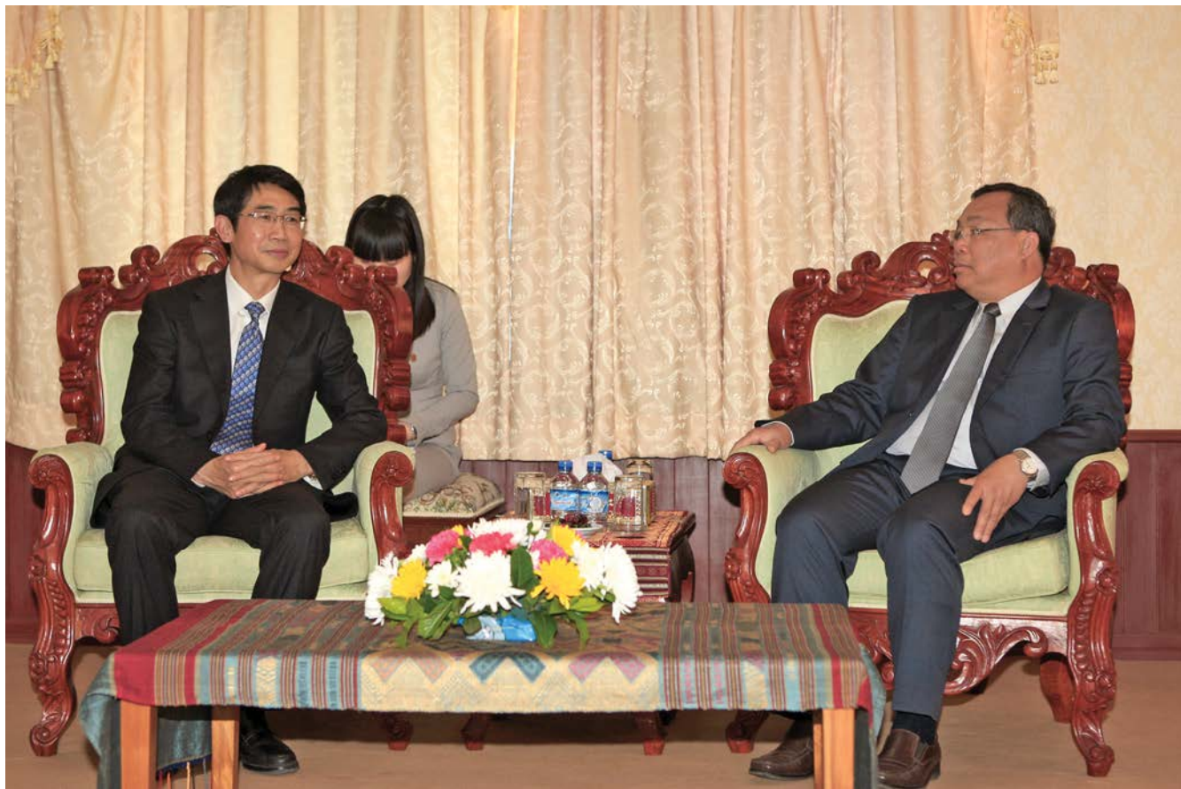
ທ່ານເຈົ້າ ສິມບູນຂັນໄດ້ດຳເນີນການເຈລະຈາກັບທ່ານ ຈ້າວຈິນ 尊·宋奔坎与赵金进行会谈