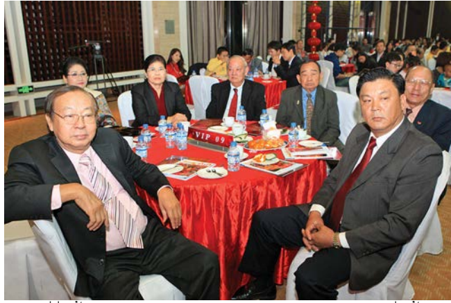
ການນຳທີ່ກ່ຽວຂ້ອງຂອງສະມາຄົມຈີນນະຄອນຫຼວງວຽງຈັນແລະການນຳຊາວຈີນຕ່າງດ້າວໄດ້ຄຸ້ມເບິ່ງການສະແດງທີ່ຍອດຢ້ຽມໃນງານລາຕີ. 老挝万象中华理事会有关领导和侨领观看晚会上的精彩演出

ຮູ້ເພີ່ມຂຶ້ນ. ພ້ອມກັນນັ້ນ, ໂດຍຜ່ານການຮ່ວມມືຄັ້ງນີ້, ຍັງໄດ້ຖອດຖອນບົດຮຽນທີ່ດີນຳເພື່ອນຮ່ວມງານຂະແໜງໂຫລະພາບຂອງຈີນ, ນີ້ຈະມີຜົນດີຕໍ່ການຍົກລະດັບຜະລິດລາຍການໂຫລະພາບຂອງລາວ.