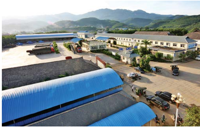
ມຸມໜຶ່ງສະໜາມເກັບມ້ຽນສິນຄ້າດ່ານເມືອງລຽນ 孟连口岸查验货场一角

ແລະ ພັດທະນາ, ຈັດວາງ ແລະ ປັບປຸງນະໂຍບາຍພິເສດ ກ່ຽວກັບເລື່ອງລັດການເປີດປະຕູສູ່ພາຍນອກ, ແລະ ດຶງດູດ ການລົງທຶນຂອງນັກທຸລະກິດຕ່າງປະເທດ. ປີ 2006, ດ່ານ ເມືອງລຽນໄດ້ຮັບການຈັດເຂົ້າໃນແຜນການພັດທະນາ ດ່ານເຂົ້າອອກເມືອງໃນ“ແຜນການພັດທະນາ 5 ປີຄັ້ງ