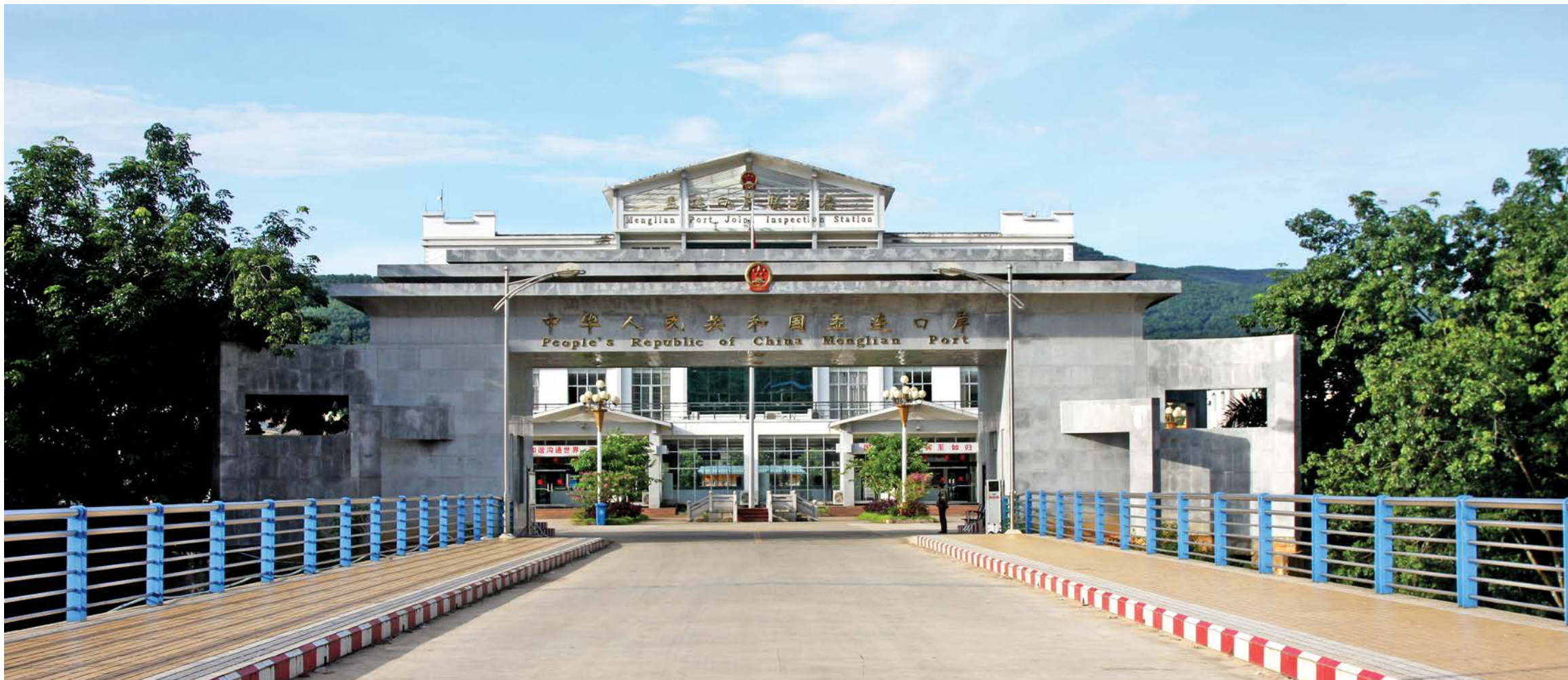
ຕຶກອາຄານກວດກາຮ່ວມກັນທີ່ປະຕູຊາດດ່ານເມືອງລຽນ 孟连口岸国门联检楼

ໂດຍປິ່ນອ້ອມຫົວຂໍ້ທີ່ວ່າ“ດ່ານທອງຄຳ, ພັດທະນາ ແບບສີຂຽວ”, ເມືອງເມືອງລຽນພວມສ້າງແລວເສດຖະ ກິດທີ່ຖືເມືອງເມືອງລຽນ, ເມືອງອາ ແລະ ເມືອງສິນເປັນ ເສັ້ນໃຈກາງ, ເສີມຂະຫຍາຍທ່າແຮງດ້ານດ່ານເຂົ້າ ອອກເມືອງ, ແລະ ທ່າແຮງທາງຜ່ານໃຫ້ກາຍເປັນທ່າ ແຮງດ້ານເສດຖະກິດ ແລະ ການພັດທະນາ, ກ້າວໄປສູ່ ເປົ້າໝາຍຍຸດທະສາດເພື່ອພັດທະນາເປັນເມືອງດ່ານທີ່ ເຂັ້ມແຂງດ້ານເສດຖະກິດ.