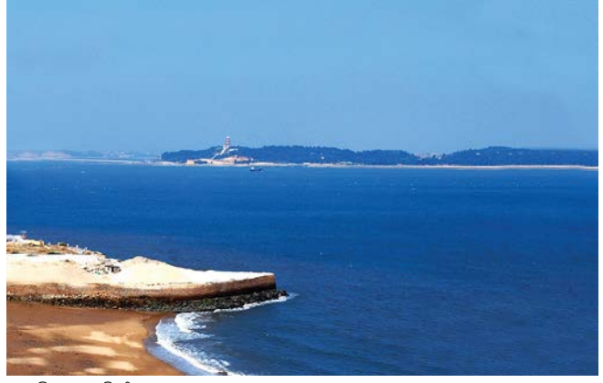
ພາບວິວເກາະເວີໂຈວພູຖູນຜູ່ງາວ 福建莆田涠洲岛风光

ນ້ຳທະເລອ້ອມເກາະຊີ່ຕາວເໝືອນແກ້ວໃສສີຝ້າ, ເປັນສະຖານທີ່ດຳນ້ຳທີ່ດີທີ່ຖືກຮັບຮູ້ໃນຫົວໂລກ, ນ້ຳເລິກ 10 ຫາ 20 ແມັດ, ນ້ຳທະເລມີຄວາມໂປ່ງໃສໃນລະດັບສູງ. ນັກທ່ອງທ່ຽວສາມາດຫົດລອງຫຼິ້ນກິດຈະກຳໃນທະເລ, ເຊັ່ນ, ດຳນ້ຳ, ອີ່ເຮືອດຳນ້ຳ, ຍ່າງຫຼິ້ນຢູ່ຜື່ນທະເລ, ແລະ ອັບລິດຈັກຢູ່ຜື່ນທະເລເປັນຕົ້ນ.