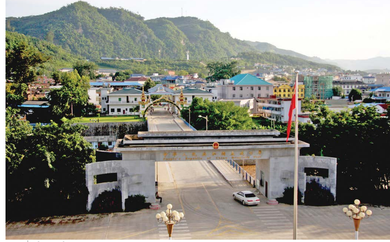
ປະຕູຊາດດ່ານເມືອງລຽນ, ເມືອງປາງຄຳມຽນມາ 孟连口岸、缅甸邦康市国门

ໃນໄລຍະລາຊະວົງໜຶ່ງ ແລະ ລາຊະວົງຊົ່ງ, ເມັງລຽນກໍເປັນປະຕູສຳຄັນແຫ່ງໜຶ່ງຂອງຈີນເພື່ອໄປສູ່ປະເທດຕ່າງໆຂອງອາຊີຕາເວັນອອກສ່ຽງໃຕ້. ເມືອງເມັງລຽນຕິດກັບປະເທດມຽນມາ. ປີ 1991, ອົງການປົກຄອງແຂວງຢຸນນານໄດ້ຈັດເມືອງເມັງລຽນເປັນດ່ານປະເພດສອງ, ຕັ້ງແຕ່ນັ້ນມາ, ເມືອງເມັງລຽນໄດ້ເລັ່ງລັດການພັດທະນາສິ່ງກໍ່ສ້າງພື້ນຖານໂຄງລ່າງ, ພ້ອມທັງສ້າງສະພາບແວດລ້ອມທີ່ກົມກຽວສຳລັບການເປີດປະຕູສູ່ພາຍນອກ