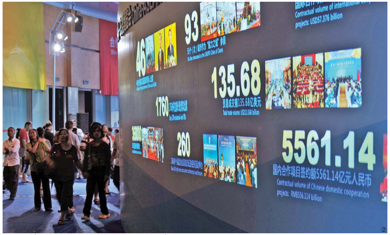
ຜາບ①②ແມ່ນຜູ້ຊົມກໍາລັງຊົມເບິ່ງງານວາງສະແດງຜົນງານໃນງານສະແດງສິນຄ້າຈີນ-ອາຊຽນຄົບຮອບ 10 ປີ ຜາບ①②观众在中国—东盟博览会 10 周年成就展上参观

ກາງທີ່ສໍາຄັນຂອງທາງສາຍໄໝທາງທະເລ,ຈີນຍິນດີ ເຝິ່ມທະວີການຮ່ວມມືທາງທະເລກັບປະເທດອາຊຽນ, ຮ່ວມກັນສ້າງສາທາງສາຍໄໝທາງທະເລໃນສະຕະວັດ ທີ 21,ທ່ານລີເສີຊຽງໄດ້ສະແດງຄວາມປາຖະໜາຈະ ສ້າງສາທາງສາຍໄໝທາງທະເລວ່າຍໜ້າໃສ່ອາຊຽນ. ໃນ“ໂຄງການປະຕິບັດ”ນະໂຍບາຍການປະຕິຮູບ ຢ່າງເລິກເຊິ່ງແລະຮອບດ້ານໃນອ້າງໜ້າໂດຍໄດ້ຜ່ານ ກອງປະຊຸມຄັ້ງທີ 3 ສະໄໝທີ 18 ຂອງສູນກາງພັກກອມມູ ນິດຈີນໄດ້ລວບລວງຢ່າງຈະແຈ້ງເຂົ້າໃນການຊຸກຍູ້ການ ສ້າງສາທາງສາຍໄໝທາງທະເລ.ລາຍລະອຽດແມ່ນ ວຽກງານເສດຖະກິດໃນສົກປີ 2014.ຝ່າຍເຈົ້າໜ້າທີ່ກໍ ໄດ້ທາງສາຍໄໝທາງທະເລຈັດເຂົ້າໃນໜ້າທີ່ວຽກງານ ຂອງໝົດປີ,ຮຽກຮ້ອງໃຫ້ກໍາກາລະເວລາໃຫ້ແໜ້ນວ່າງ ແຜນຍຸດທະສາດ,ດຶງສາຍສໍາພັນດ້ານຜົນປະໂຫຍດຂອງ ກັນແລະກັນໃຫ້ແໜ້ນ.