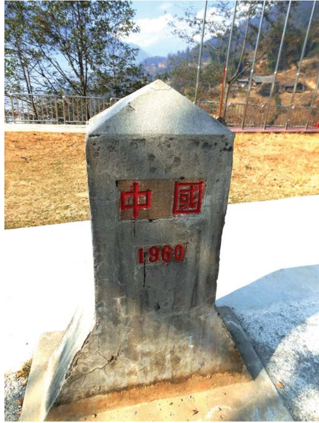
ເສົາຫຼັກເຂດແດນຈີນ 中国国界界桩

ຄວາມສູງກວ່າລະດັບໜ້ານ້ຳທະເລ 1897 ແມັດ, ຜິດມີຄວາມແຕກຕ່າງກັນຕາມອາກາດໃນລະດັບຄວາມສູງຕ່າງກັນ, ເປັນດິນຜ້າອາກາດປ່າພືດແຖບອຸ່ນ. ອານຸສາວະລີວິລະຊົນຕໍ່ຕ້ານອັງກິດພ້ຽນມາທີ່ຕັ້ງຢູ່ແຫ່ງນີ້, ເປັນອິດໝາຍທີ່ສະແດງໃຫ້ເຫັນເຖິງປະຊາຊົນເຜົ່າຕ່າງໆຂອງພ້ຽນມາຕໍ່ຕ້ານກັບຜູ້ຮຸກຮານຕ່າງປະເທດ, ອານຸສາວະລີສູງ 20 ແມັດ, ປະກອບດ້ວຍດາບ 3 ອັນ ແລະ ໂລ້ກຳບັງ 3 ອັນ, ໝາຍເຖິງວິລະກຳຂອງປະຊາຊົນເຜົ່າຕ່າງໆຕໍ່ຕ້ານກັບອັງກິດຜູ້ຮຸກຮານ, ໃນທິພິທະພັນມີການວາງສະແດງຂໍ້ມູນປະຫວັດສາດຂອງພ້ຽນມາ.