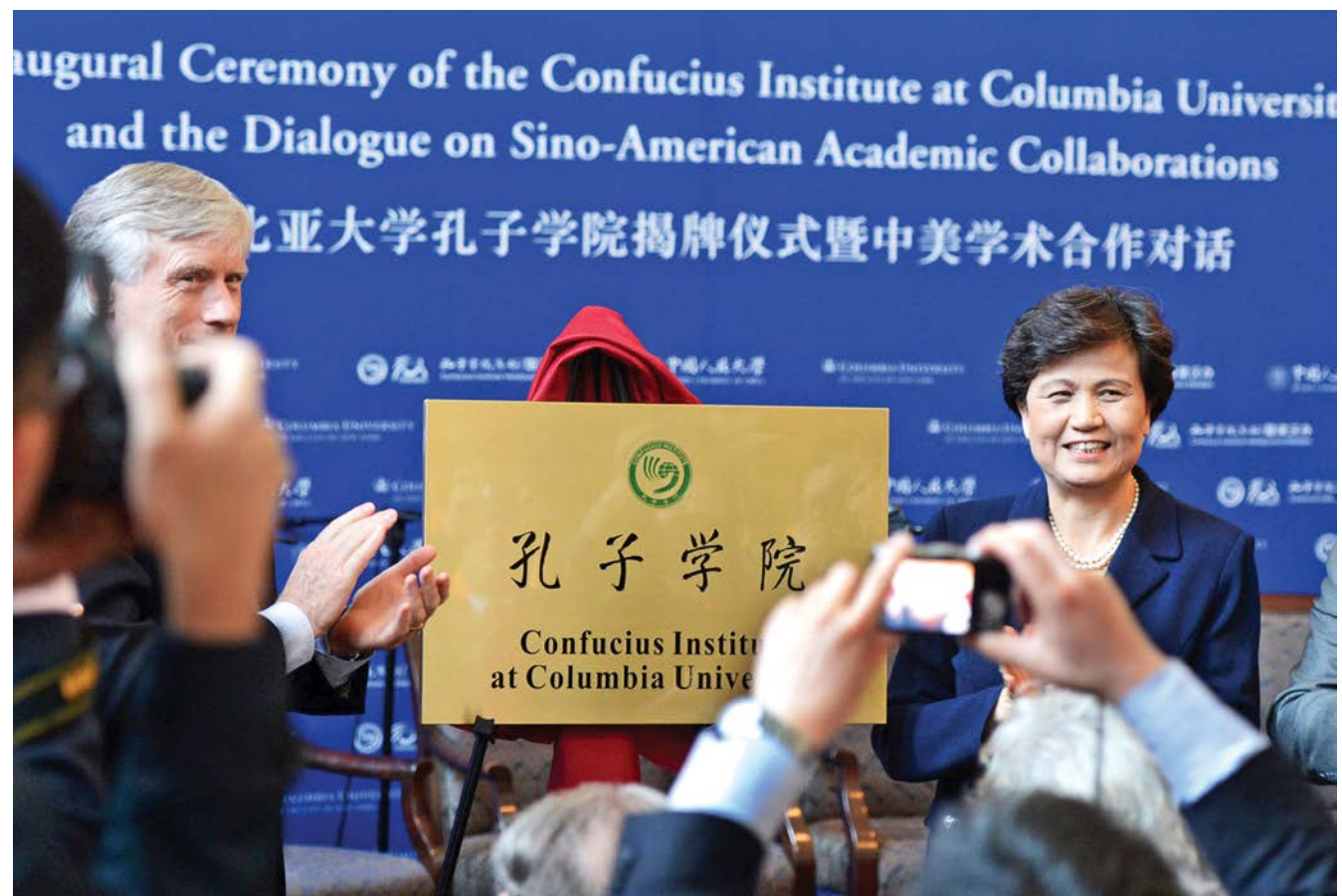
ວັນທີ 9 ເດືອນ 4 ປີ 2013, ສະຖາບັນຂົງຈີ້ມະຫາວິທະຍາໄລໂກລູມເບີອາເມລິກາໄດ້ຈັດພິທີເປີດບ້ານ 2013 年 4 月 9 日, 美国哥伦比亚大学孔子学院举行揭牌仪式

ສະຖາບັນຂົງຈີ້ບໍ່ແມ່ນມະຫາວິທະຍາໄລແບບທີ່ໄປ, ຫາກແມ່ນອົງການສຶກສາ ແລະ ແລກປ່ຽນວັດທະນະທຳເພື່ອເຜີຍແຜ່ພາສາຈີນ ແລະ ສິ່ງເສີມວັດທະນະທຳຈີນ, ເປັນອົງການສາທາລະນະປະໂຫຍດສັງຄົມທີ່ບໍ່ຫວັງຜົນກຳໄລ. ທຳມະດາຕັ້ງຢູ່ໃນມະຫາວິທະຍາໄລ ແລະ