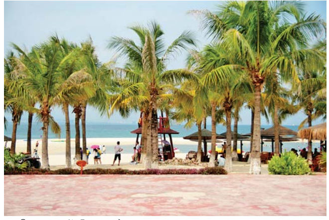
ພາບວິວເກາະຕາເວັນຕົກຊານຢາໄຫນານ 海南三亚西岛风光 半清图