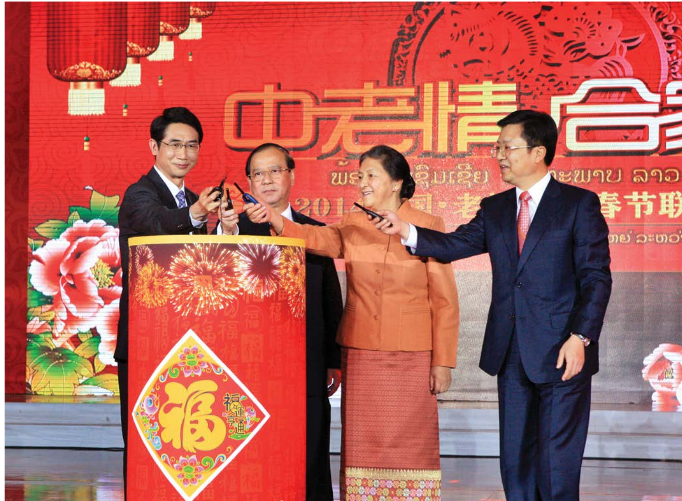
ທ່ານ ນາງປານີ ຢາທິຕູ້ (ເຂວງນີ 2) ປະທານສະພາແຫ່ງຊາດລາວ, ທ່ານຈາວຈິນ (ຊື່ຢາຍມີ 1) ກຳມະການປະຈຳຄະນະພັກແຂວງ, ຫົວໜ້າຄະນະໂຄສະນາຄະນະພັກແຂວງຢູນນານພັກຄອມມູນິດຈີນ, ທ່ານບໍ່ແສງຄຳ ວົງດາລາ (ຊື່ຢາຍມີ 2) ລັດຖະມົນຕີວ່າການກະຊວງຖະແຫຼງຂ່າວວັດທະນະທຳແລະທ່ອງທ່ຽວແຫ່ງປະເທດລາວ, ທ່ານກວນຮວາປິງ (ເຂວງນີ 1) ເອກອັກຄະລັດຖະທູດຜູ້ມີອຳນາດເຕັມ ສປປຈີນປະຈຳລາວຮ່ວມກັນລິເລີ່ມກິດປຸ່ມໄຟດອກງາມລາຕີ.