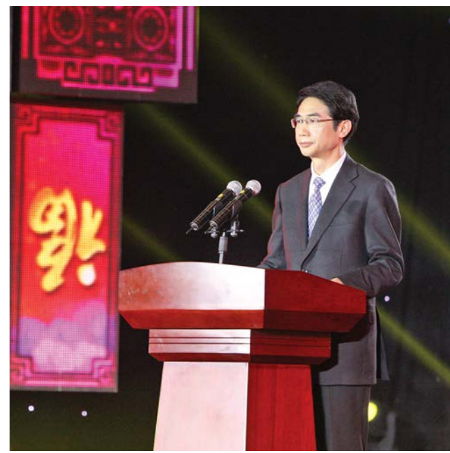
ທ່ານຈາວຈິນກຳມະການປະຈຳຄະນະພັກແຂວງ, ຫົວໜ້າໂຄສະນາຄະນະພັກແຂວງຢູນນານພັກຄອມມູນິດຈີນອື່ນກ່າວຄຳປາໄສທີ່ງານລາຕີສະຫລອງບຸນກຸດຈີນ. 中共云南省委常委、省委宣传部部长赵金在春节晚会上致辞

ໃນຕອນຄໍ່າວັນທີ 25 ມັງກອນ 2014, ທ່ານນາງປານີ ຢາທິຕູ້, ກຳມະການກົມການເມືອງສູນກາງພັກປະຊາຊົນປະຕິວັດລາວ, ປະທານສະພາແຫ່ງຊາດລາວ, ທ່ານເຈືອງ ສົມບູນອັນ, ຫົວໜ້າຄະນະໂຄສະນາ ແລະ ອົບຮົມສູນກາງພັກ, ທ່ານສິນລະວິງ ຄຸດໄພທູນ, ລັດຖະມົນຕີ ຫົວໜ້າຫ້ອງວ່າການລັດຖະບານ, ທ່ານບໍ່ແສງຄຳ ວົງດາລາ, ລັດຖະມົນຕີວ່າການ, ທ່ານສະຫວັນຄອນ ຣາຊະມິນ ຕີ, ລັດຖະມົນຕີຊ່ວຍວ່າການກະຊວງຖະແຫຼງຂ່າວ, ວັດທະ