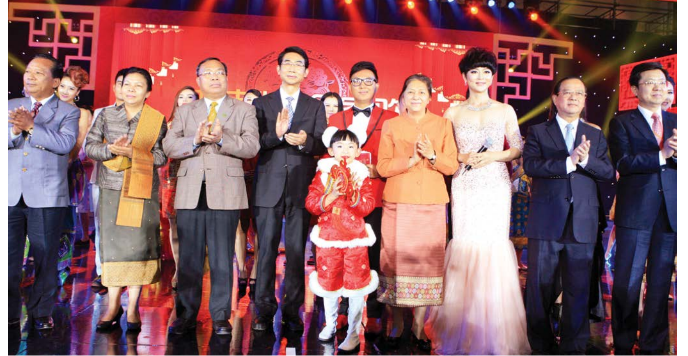
ຫານ ຈາວຈີນ ກຳມະການປະຈຳຄະນະພັກແຂວງ, ຫົວໜ້າໂຄສະນາຄະນະພັກແຂວງຢຸນນານພັກຄອມມູນິດຈີນ ແລະ ການນຳຂອງສະຖານທູດຈີນປະຈຳລາວ, ສະພາແຫ່ງຊາດລາວ, ຄະນະໂຄສະນາອົບອົມສູນກາງພັກລາວ, ກະຊວງຖະແຫຼງຂ່າວວັດທະນະທຳ ແລະ ຫ່ອງທ່ຽວລາວ, ກະຊວງການຕ່າງປະເທດ ແລະ ເປັນຕົ້ນໄດ້ຖ່າຍຮູບຮ່ວມກັນກັບພະນັກງານ, ນັກສະແດງພາຍຫຼັງການສະແດງສິ້ນສຸດລົງແລ້ວ.

ງານຄັ້ງນີ້ໄດ້ຖ່າຍທອດສິດໂດຍໂຫລະພາບແຫ່ງຊາດລາວ, ແລະ ອອກອາກາດຢູ່ໂຫລະພາບຜ່ານດາວທຽມແຂວງຢຸນນານໃນຕອນຄ່ຳວັນທີ 27 ມັງກອນ.