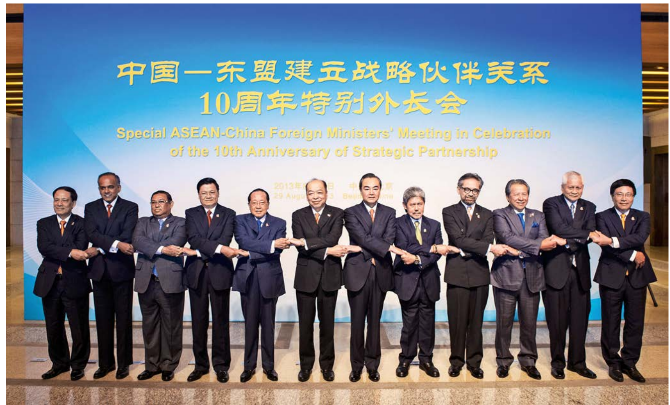
ກ່ອນເປີດກອງປະຊຸມວິສາມັນລັດຖະມົນຕີການຕ່າງປະເທດຈີນ-ອາຊຽນ, ທ່ານລັດຖະມົນຕີການຕ່າງປະເທດຈີນເຂົ້າຮ່ວມກອງປະຊຸມຖ່າຍຮູບຮ່ວມກັນ 中国 - 东盟特别外长会议前, 与会国外长集体合影

ໃນໄລຍະແຫ່ງທອງຄຳ 10 ປີນັ້ນ, ຈີນໄດ້ກາຍເປັນຄູ່ການຄ້າໃຫຍ່ກວ່າໝູ່ຂອງອາຊຽນ, ອາຊຽນກາຍເປັນຄູ່ການຄ້າໃຫຍ່ທີ 3 ຂອງຈີນ. ປີ 2012, ຈຳນວນມູນຄ່າເສດຖະກິດການຄ້າບັນລຸເຖິງ 400 ກວ່າຕື້ ໂດລາສະຫະ