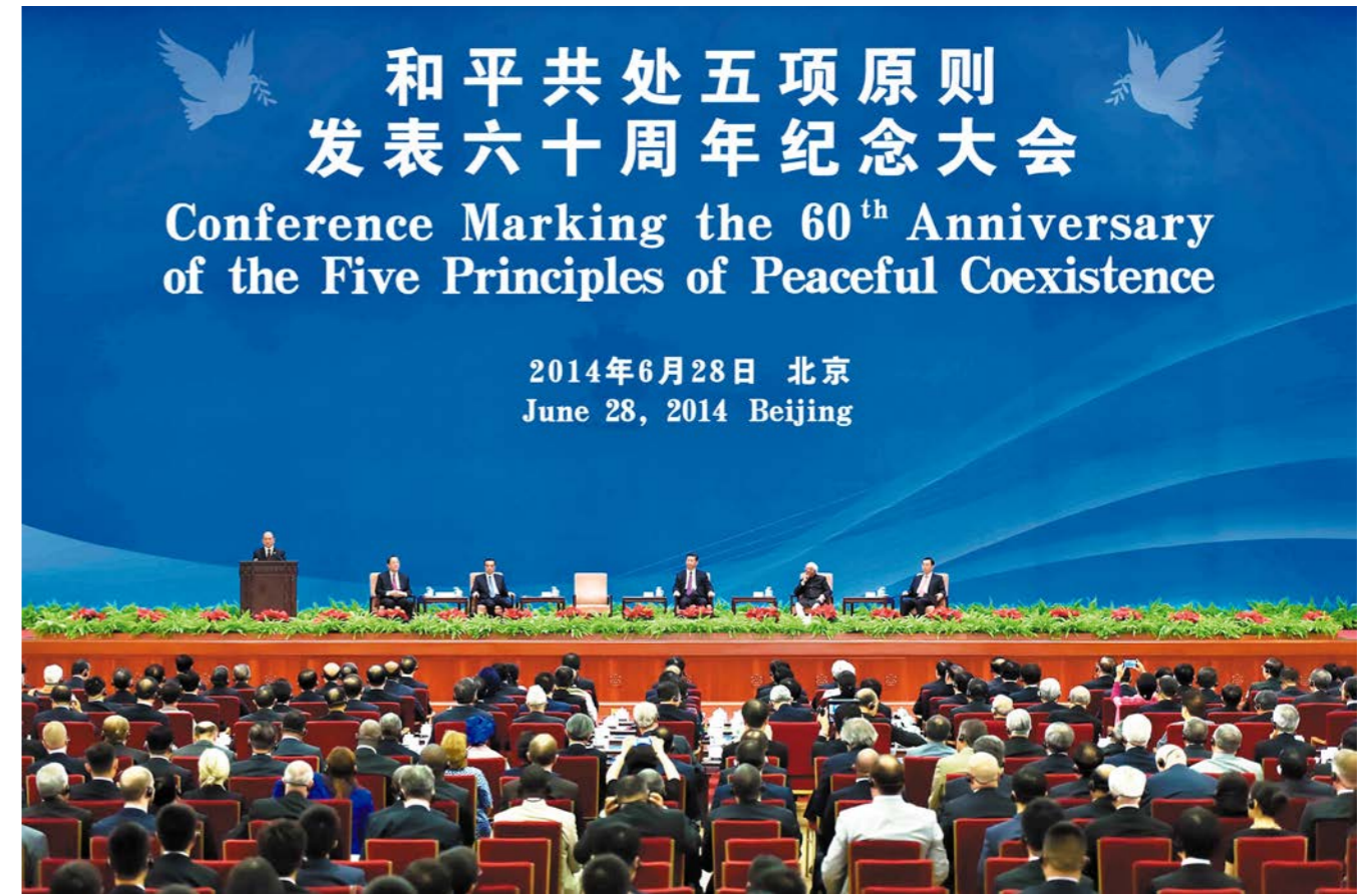
ວັນທີ 28 ມິຖຸນາ, ກອງປະຊຸມເພື່ອລະນຶກວັນຄົບຮອບ 60 ປີ ແຫ່ງການຖະແຫລງການຫຼັກການ 5 ອັນແຫ່ງການຢູ່ຮ່ວມກັນໂດຍສັນຕິໄດ້ຈັດຂຶ້ນທີ່ຫໍສະພາປະຊາຊົນປັກກິ່ງ 6月28日, 和平共处五项原则发表六十周年纪念大会在北京人民大会堂举行

ວັນທີ 27 ມີນາຜ່ານມາ, ທ່ານ ສີຈິນຜິງ ໄດ້ກ່າວຄຳປາໄສຢູ່ສຳນັກງານໃຫຍ່ອົງການຢູເນສໂກສະຫະປະຊາຊາດ, ອະທິບາຍທັດສະນະໃໝ່ແຫ່ງຄວາມສິວິໄລ. ທ່ານກ່າວວ່າ, ການທີ່ຄວາມສິວິໄລຕ່າງໆ ແລກປ່ຽນ ແລະ ຖອດຖອນບົດຮຽນເຊິ່ງກັນ ແລະ ກັນນັ້ນ, ແມ່ນແຮງຊຸກຍູ້ຄວາມກ້າວໜ້າຂອງຄວາມສິວິໄລມະນຸດ ແລະ ການຂະຫຍາຍຕົວຂອງສັນຕິພາບໂລກ. ທ່ານຊື່ອກວ່າ, ຄວາມສິວິໄລມີຄວາມຫຼາກຫຼາຍ, ຄວາມສິວິໄລຂອງມະນຸດຈຶ່ງມີຄຸນຄ່າແລກປ່ຽນເຊິ່ງກັນ ແລະ ກັນ; ຄວາມສິວິໄລມີ