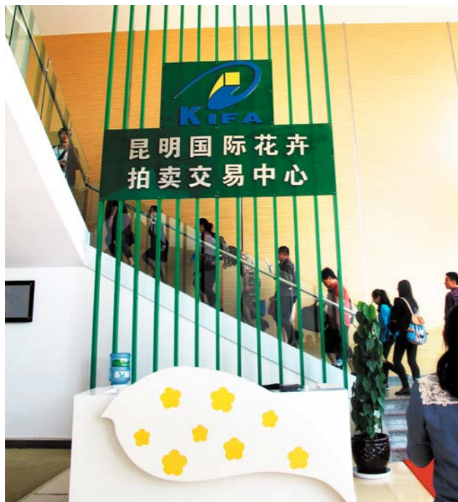
ພາບວິວພາຍໃນສູນປະມຸນຂາຍດອກໄມ້ສາກົນຄຸນນະພາບ 昆明国际花卉拍卖交易中心内景 楚然图

ສູນຄ້າຂາຍດອກໄມ້ສາກົນຢູນນານຕັ້ງຢູ່ເມືອງນ້ອຍ ໂຕວນານເມືອງເສິງກົງຂອງຄຸນໝິງ, ໂດຍຜ່ານການພັດ ທະນາເປັນເວລາ 12 ປີ, ສູນຄ້າຂາຍດອກໄມ້ສາກົນຄຸນ ໝິງໄດ້ກາຍເປັນຕະຫຼາດດອກໄມ້ໃຫຍ່ທີ່ສຸດພາຍໃນປະ ເທດຈີນ, ຈຳນວນຄ້າຂາຍດອກໄມ້ສິດໄດ້ເພີ່ມຈາກ 2 ລ້ານກິ່ງຂຶ້ນເປັນ 6 ລ້ານກິ່ງຕໍ່ມື້, ເຊິ່ງເປັນຕະຫຼາດດອກ ໄມ້ທີ່ເປັນແຫຼ່ງຜະລິດໃຫຍ່ທີ 2 ຂອງອາຊີ.