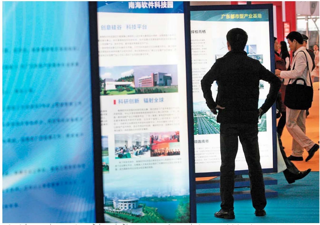
ນັກສຶກສາຈີນທີ່ຮຽນຈົບຈາກຕ່າງປະເທດກັບຄືນປະເທດຊາດເພື່ອສ້າງທຸລະກິດ ຈຳນວນຜູ້ທີ່ໄປຮຳຮຽນຢູ່ຕ່າງປະເທດປະເພດຕ່າງໆຂອງຈີນມີເຖິງ 3 ລ້ານ 5 ໝື່ນ 8600 ກວ່າຄົນ, ຜູ້ທີ່ຮຽນຈົບແລ້ວກັບຄືນ ປະເທດຊາດມີເຖິງ 1 ລ້ານ 4 ແສນ 4 ໝື່ນ 4800 ກວ່າ ຄົນ, ຜູ້ທີ່ກຳລັງຮຽນຢູ່ຕ່າງປະເທດມີ 1 ລ້ານ 6 ແສນ 1 ໝື່ນ 3800 ກວ່າຄົນ, ໃນນັ້ນມີ 1 ລ້ານ 7 ໝື່ນ 5100 ກວ່າ

ຮຽນຢູ່ຕ່າງປະເທດ ແລະ ຜູ້ທີ່ຮຽນຈົບແລ້ວກັບຄືນປະເທດ ຊາດນັ້ນໄດ້ຮັກສາທ່າອ່ຽງເພີ່ມຂຶ້ນຢ່າງວ່ອງໄວ. ອີງຕາມ ສະຖິຕິ, ແຕ່ປີ 1978 ຮອດທ້າຍປີ 2013, ຍອດຈຳນວນຜູ້ທີ່ ໄປຮຳຮຽນຢູ່ຕ່າງປະເທດປະເພດຕ່າງໆຂອງຈີນມີເຖິງ 3 ລ້ານ 5 ໝື່ນ 8600 ກວ່າຄົນ, ຜູ້ທີ່ຮຽນຈົບແລ້ວກັບຄືນ ປະເທດຊາດມີເຖິງ 1 ລ້ານ 4 ແສນ 4 ໝື່ນ 4800 ກວ່າ ຄົນ, ຜູ້ທີ່ກຳລັງຮຽນຢູ່ຕ່າງປະເທດມີ 1 ລ້ານ 6 ແສນ 1 ໝື່ນ 3800 ກວ່າຄົນ, ໃນນັ້ນມີ 1 ລ້ານ 7 ໝື່ນ 5100 ກວ່າ