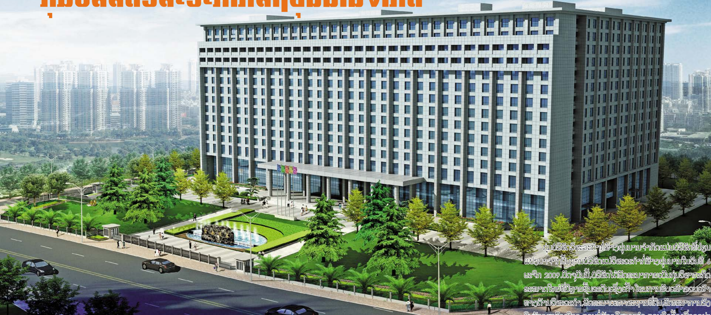
ກຸ່ມບໍລິສັດວິສະວະກໍາກໍ່ສ້າງຢູນນານຈໍາກັດແມ່ນບໍລິສັດທີ່ປ່ຽນແປງມາຈາກຜູ້ຖານບໍລິສັດແມ່ວິສະວະກໍາກໍ່ສ້າງຢູນນານໃນວັນທີ 6 ພະຈິກ 2009. ປັດຈຸບັນນີ້, ບໍລິສັດໄດ້ພັດທະນາກາຍເປັນກຸ່ມວິສາຫະກິດຂະໜາດໃຫຍ່ທີ່ມີຫຼາຍຊັ້ນລະດັບເຊິ່ງເຕົ້າໂຮມການຮັບເໝົາລວມເອົາທາງດ້ານວິສະວະກໍາ, ພັດທະນາເອກະຖານທີ່ດິນ, ພັດທະນາການສົ່ງທຶນສ້າງສາຕົວເມືອງ, ການກໍ່ສ້າງວິສະວະກໍາ, ການຕິດຕັ້ງເຄື່ອງອຸປະກອນກົນຈັກໄຟຟ້າ, ການຜະລິດທຸລະກິດເປຕົງ, ກໍ່ສ້າງຂົວທາງຜັງເມືອງ, ກໍ່ສ້າງວິສະວະກໍາໂຄງປະກອບເຫຼັກ, ກໍ່ສ້າງຊົນລະປະທານ ແລະ ເອື້ອມໄຟຟ້ານໍ້າຕົກ, ກໍ່ສ້າງວິສະວະກໍາຜັ່ນຖານ, ການສະໜອງ ແລະ ຈໍາໜ່າຍວັດສະດຸກໍ່ສ້າງ ແລະ ເຄື່ອງອຸປະກອນ, ການຄົ້ນຄວ້າສະຖາປັດຕະຍະກໍາ, ການສໍາຫຼວດອອກແບບ, ການກໍ່ສ້າງ ແລະ ແຮງງານ ແລະ ອື່ນໆເປັນອັນໜຶ່ງອັນດຽວກັນ; ແມ່ນ 1 ໃນວິສາຫະກິດຫລັກແຫ່ງທີ່ສໍາຄັນ 15 ແຫ່ງຂຶ້ນກັບແຂວງ ແລະ 20 ແຫ່ງສັງກັດແຂວງຄຸ້ມຄອງເຊິ່ງແມ່ນຄະນະກຳມະການຄຸ້ມຄອງຊັບສິນຂອງລັດເປຕິບັດພາລະໜ້າທີ່ຂອງຜູ້ອອກທຶນ. ປັດຈຸບັນນີ້, ກຸ່ມບໍລິສັດມີບໍລິສັດລູກທີ່ມີທຶນທັງໝົດ 10 ບໍລິສັດຖືຖືກ, ແລະ ຫົວໜ່ວຍວິສາຫະກິດຄຸ້ມຄອງ ໂດຍກົງ 31 ບໍລິສັດ. ມີພະນັກງານພະລາກອນ 16,000 ກວ່າຄົນ, ມີພະນັກງານວິຊາການປະເພດຕ່າງໆ 7797 ຄົນ, ໃນນັ້ນ, ຜູ້ທີ່ມີຕໍາແໜ່ງຊັ້ນສູງ 751 ຄົນ.

云南建工集团有限公司是在云南建工集团总公司基础上，于2009年11月6日改制而成。目前，集团已发展成为集工程总承包、房地产开发、城市建设投资开发、建筑工程施工、机电设备安装、商品混凝土生产、路桥市政工程施工、钢结构工程施工、水利水电工程施工、地基工程施工、建材与设备供销、建筑科研、勘察设计、建筑劳务于一体的多层次大型企业集团；是云南省政府国资委履行出资人职责的20户省管企业和15户省属重要骨干企业之一。集团现有全资子公司、控股公司和直管企事业单位31个；现有在职职工16000人，各类专业技术人员7797人，其中具有高级职称的751人。 近年来，集团努力进行结构调整，千方百计拓展市场，综合实力显著增强，为云南的经济建设和社会发展做出了显著贡献。2013年完成总产值434.23亿元，完成竣工面积828.1万平方米。科技水平显著提高，国际市场的开拓能力不断增强。截至2013年12月，集团累计获得全国建筑工程鲁班奖22项，国家优质工程银质奖32项，詹天佑土木工程大奖提名奖1项，全国用户满意工程13项，全国和省