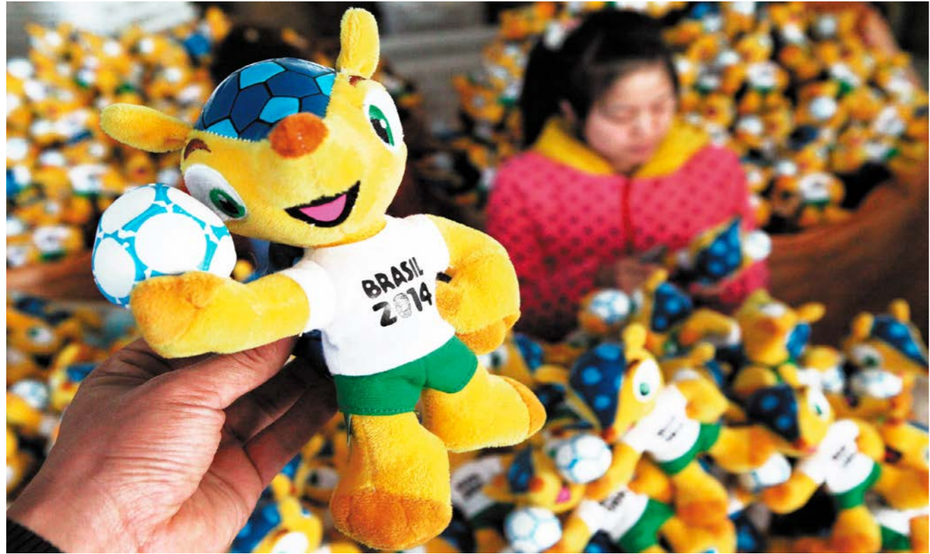
ສັດສີລິນຸງຄຸນບານເຕະໂລກເບິຊິນ 2014 ທີ່ບໍລິສັດຈຽງຊູຜະລິດ 江苏公司制造的2014巴西世界杯吉祥物

ໃນໄລຍະງານແຂ່ງຂັນເຕະບານ ໂລກ, ລົດໄຟໃຕ້ດິນທີ່ຜະລິດໂດຍຈີນຈະດໍາເນີນໜ້າທີ່ຂຶ້ນສິ່ງອັນໃຫຍ່ຫຼວງໃນຕົວເມືອງຂອງເບິຊິນ. ໃນການຮັບປະມູນລົດລາງໃນເມືອງຂອງເບິຊິນ, ບໍລິສັດລົດໂດຍສານມີລາງຊາງຊຸ່ນເປີຍເຊີ່ຈີນໄດ້ຊະນະບໍລິສັດຊີເມັນສ, ບໍລິສັດອາສຕອນ ແລະ ອື່ນໆທີ່ເປັນບໍລິສັດພັດທະນາຄົມມະນາຄົມລົດລາງລະດັບກ້າວໜ້າຂອງໂລກ, ຍາດໄດ້ໂຄງການນີ້ດ້ວຍເຕັກນິກທີ່ມີຄຸນນະພາບສູງ ແລະ ລາຄາທີ່ສົມເຫດສົມຜົນ. ຢູ່ຮີໂອເດິຈາເມໂຣຂອງເບິຊິນ, ລົດໄຟໃຕ້ດິນສາຍ 1A ມີ 114 ຂະບວນ, ລົດໄຟຝ້າ EMU 124 ຄັນລ້ວນແຕ່ແມ່ນຄື້ນຄວ້າຜະລິດໂດຍບໍລິສັດລົດໂດຍສານມີລາງຊາງຊຸ່ນເປີຍເຊີ່ຈີນ. ເບິຊິນຍັງໄດ້ນໍາເຂົ້າລົດເມໃຫຍ່ທີ່ໃຊ້ແຮງປະສົມ 2 ຄັນຈາກຈີນຈັດເຂົ້າສູ່ຄິວລົດເມ, ເພື່ອຂົນສົ່ງແຂກຈາກທົ່ວໂລກໃນໄລຍະງານແຂ່ງຂັນເຕະບານໂລກ.