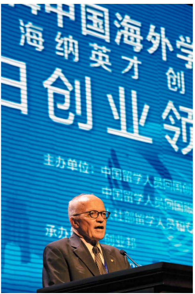
ວັນທີ 27 ມິຖຸນາ, ທ່ານ ເຟີນກິເຕີລານ ຜູ້ໄດ້ຮັບອາງວັນໂນແບນສາອາເສດຖະສາດໄດ້ຂຶ້ນກ່າວສູນ ທອນມິດໃນກອງປະຊຸມສູນຍອດຜູ້ນຳສ້າງອາຊີບທີ່ຮຽນຈົບຈາກຕ່າງປະເທດໃນສັບປະດານັກສຶກສາພິມ ທະເລຈີນໃນປີ 2014 6月27日, 诺贝尔经济学奖获得者芬恩·基德兰德在2014中国海外学子创业周海归创业领袖峰会上演讲

ຄົນກຳລັງດຳເນີນການຮຽນ ຫຼື ການຄົ້ນຄວ້າໃນໄລຍະ ຕ່າງໆຢູ່ຕ່າງປະເທດ.