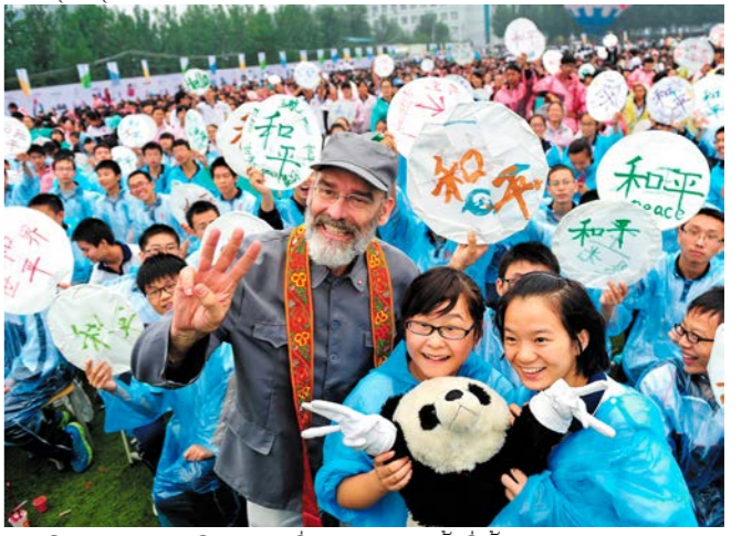
ບຸກຄົນມິດຕະພາບ ແລະ ສັນຕິພາບສາກົນທີ່ມາຈາກການດາວຜູ້ໜຶ່ງຕ້ອນຮັບກັນກັບນັກຮຽນມິດຕະພົມ 一位来自加拿大的国际和平友好人士与中学生互动

ທ່ານ ສີຈິ້ນຜິງ ຊື່ອກວ່າ, ປະຊາຊາດຈີນສະແຫວງ ຫາ ແລະ ສືບທອດທັດສະນະແຫ່ງສັນຕິພາບ, ຄວາມປອງ ດອງ ແລະ ຄວາມກົມກຽວຕະຫຼອດມາ, ທັດສະນະທີ່ຖືສັນ ຕິພາບ ແລະ ຄວາມກົມກຽວເປັນສິ່ງສໍາຄັນ, ເປັນມິດກັບ ຜູ້ອື່ນ, ສິ່ງທີ່ຕົວເອງບໍ່ມັກຈະບໍ່ບັງຄັບໃສ່ຜູ້ອື່ນເປັນຕົ້ນໄດ້ ສືບທອດກັນມາແຕ່ຫຼາຍເຊັ່ນຄົນ, ຝັງເລິກໃນຈິດໃຈຂອງ ຊາວຈີນ, ແລະ ສະແດງອອກໃນການກະທໍາຕົວຈິງຂອງ ປະຊາຊົນຈີນ.