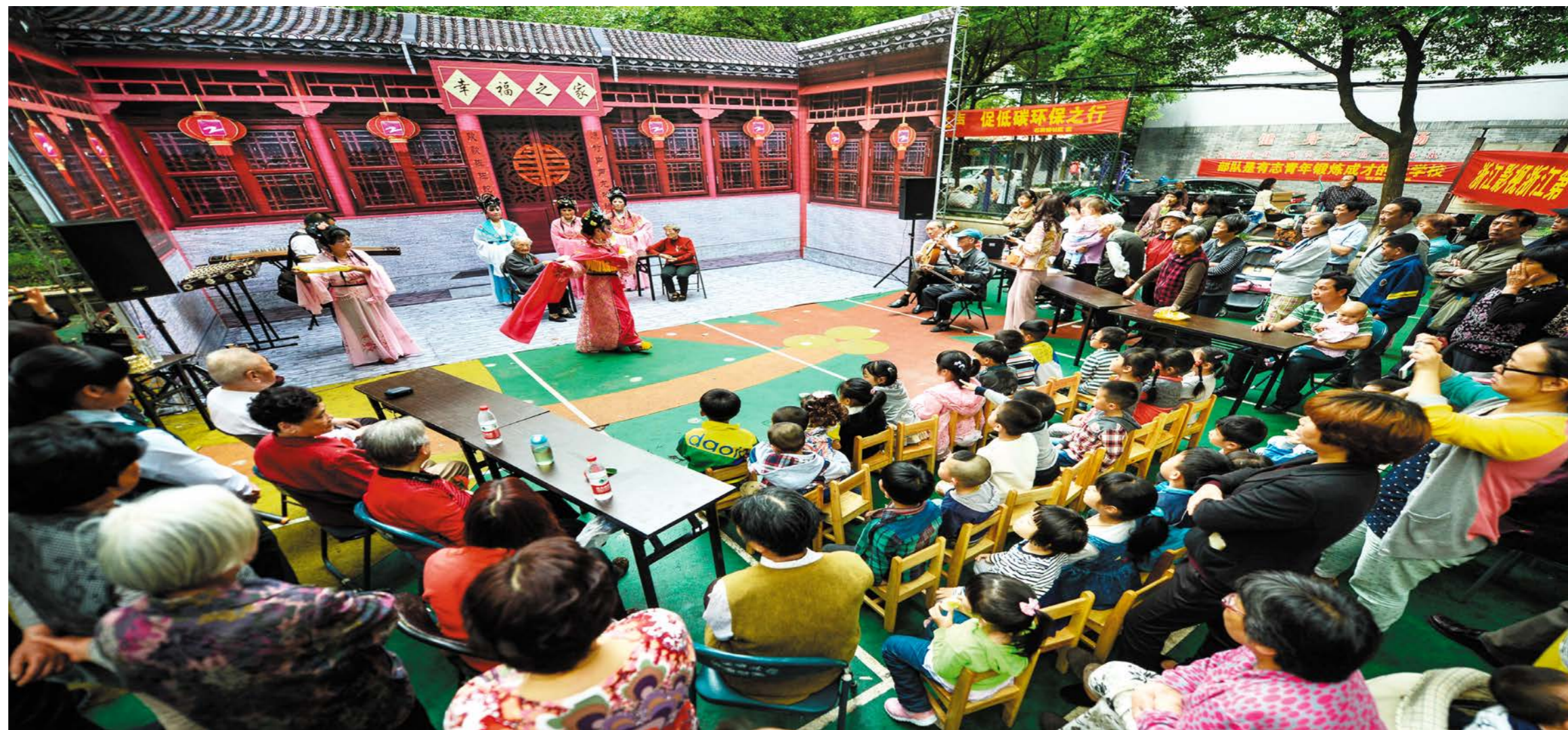
ກອງລະຄອນຊົນພວມສະແດງຊື່ວຊຽງໂຮເພື່ອຊາວເມືອງຄຸ້ມບ້ານ ຂອງເມືອງຊານຕຸງ ໃນການສະແດງເປັນສະຖານທີ່ວັດທະນະທຳຕ່າງໆຂອງນະຄອນໄຫວອານແຂວງຊານຕຸງລ້ວນແຕ່ເບິ່ງເຂົ້າກັນເປັນ

ເພື່ອເຜີຍແຜ່ວັດທະນະທຳທີ່ມີເອກະລັກພິເສດອັນອຸດົມສົມບູນຂອງທ້ອງຖິ່ນແຫ່ງພູໄທຊານ,《ກ້ອນຫີນຊີກັນຕັ້ງສາຍແມນແຫ່ງຄວາມຮັກພູໄທຊານ》ເປັນລະຄອນດົນຕີບົດທຳອິດຂອງຊານຕຸງ,ເດືອນ 8 ປີກາຍນີ້ໄດ້ສະແດງປະຖົມມະເລີກໃນໂຮງລະຄອນພູໄທຊານ,ຈົນເຖິງປັດຈຸບັນນີ້,ໄດ້ສະແດງ 130 ກວ່າຮອບແລ້ວ.ເຄື່ອງນຸ່ງອາພອນ ແລະ ເຄື່ອງປະດັບທີ່ພິດສະດານ,ການສະແດງທີ່ມີຊີວິດຊີວາ,ດົນຕີທີ່ມ່ວນໝູ່ມ່ວນໃຈ,ນັບແຕ່ລະຄອນດົນຕີບົດນີ້ສະແດງປະຖົມມະເລີກເປັນຕົ້ນມາ,ອັດຕາຜູ້ຊົມຊື່ປີ