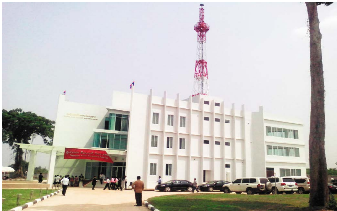
ສູນຄຸ້ມຄອງສັນຄວາມຖີ່ວິທະຍຸ 无线电监护中心

ປີ 1996 ລັດຖະບານໄດ້ສ້າງຕັ້ງບໍລິສັດຮ່ວມທຶນຂຶ້ນລະຫວ່າງບໍລິສັດລັດວິສາຫະກິດໂທລະຄົມລາວ (ETL) ແລະ ບໍລິສັດລາວ-ຊິນນະວັດໂທລະຄົມ (LaoShin) ເຊິ່ງລວມຊື່ກັນເປັນບໍລິສັດປະສົມລາວໂທລະຄົມ (LTC), ໃນນັ້ນລັດຖະ