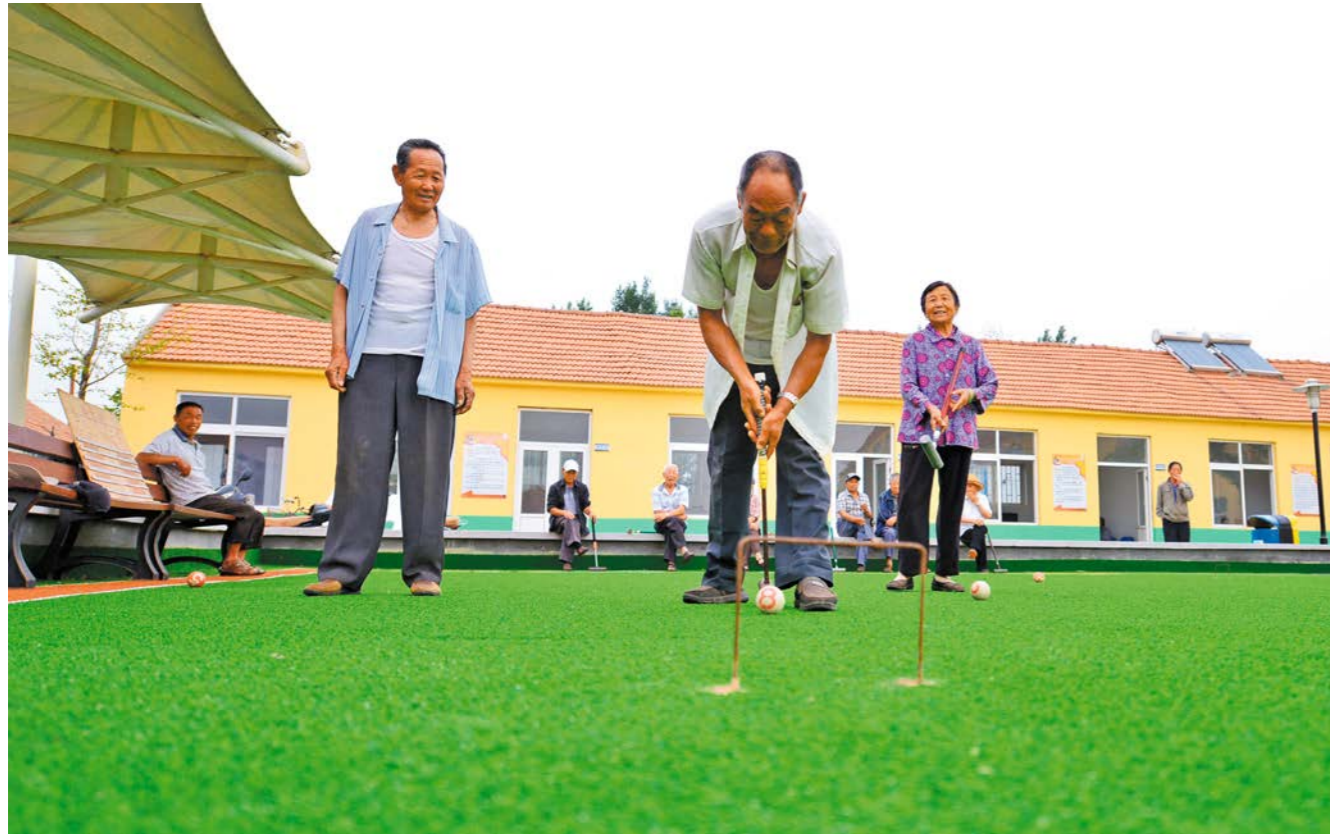
ຜູ້ສູງອາຍຸພວມຕີບານປະຕູ 老人们在打门球