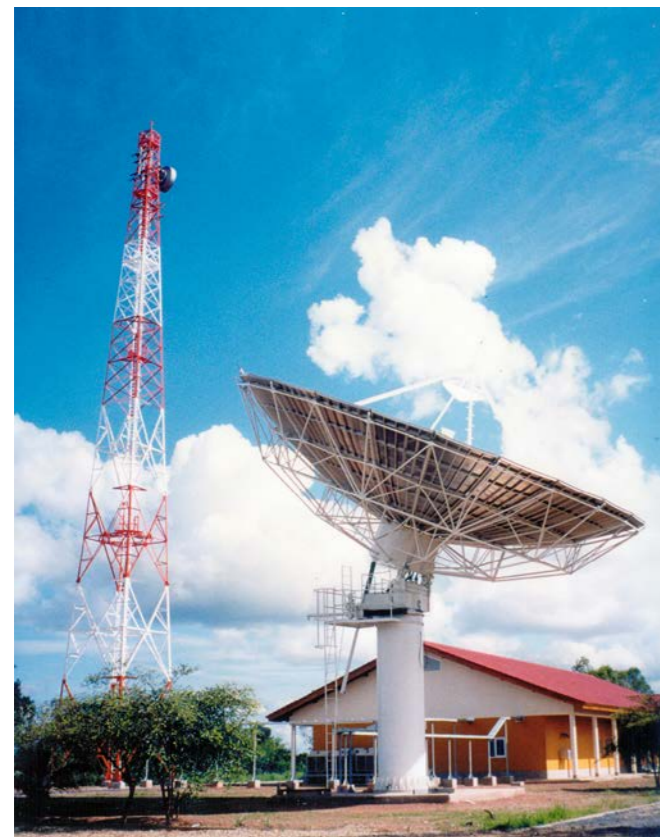
ສະຖານີດາວທຽມພາກພື້ນດິນ 卫星地面站

ນັບຕັ້ງແຕ່ ປີ 1983 ເຖິງ 2013, ການພັດທະນາຂະແໜງການສື່ສານໃນສາທາລະນະລັດປະຊາທິປະໄຕປະຊາຊົນລາວ(ສປປ ລາວ) ຖືວ່າມີການຂະຫຍາຍຕົວຢ່າງໄວວາ ແລະ ໄດ້ມີບົດບາດອັນສໍາຄັນຕໍ່ກັບການພັດທະນາເສດຖະກິດ-ສັງຄົມຂອງຊາດ ແລະ ຕໍ່ເສດຖະກິດໃນລະດັບສາກົນ. ເຫດຜົນອັນເນື່ອງມາຈາກໃນໄລຍະຊຸມປີ 2000