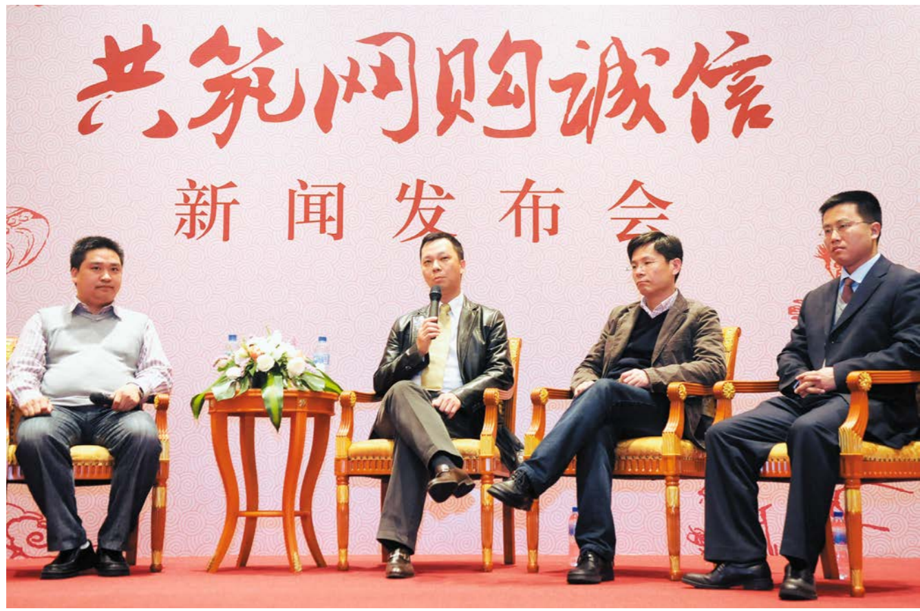
ຜູ້ຄົນ ໃຊ້ເຄືອຂ່າຍອິນເຕີເນັດທາງປາວປັກປ້ອງສິດທິນປະໂຫຍດຂອງການເຂົ້າສູ່ອິນເຕີເນັດໄດ້ຮ່ວມມືກັນກັບນັກທຸລະກິດຍີ່ຫໍ້ດັ່ງເພື່ອປະກາດການຕໍ່ສູ້ກັບສິນຄ້າປອມ ທາງເວັບໄຊ ສະຖານະຜູ້ຮັບຜິດຊອບ ສູນຮັບຜິດຊອບ ແລະ ຍ່າ ເລກທີ 07 09 1001 / 07.

ນຶກຂໍ້ມູນຂ່າວສານ ແລະ ອື່ນໆທີ່ປະດິດສ້າງ ແລະ ນຳ ທີ່ມີລາຍໄດ້ຕໍ່າ. ໃຊ້ໃໝ່, ກາຍເປັນຈຸດຮ້ອນໃໝ່ໃນການພັດທະນາການຄ້າ ເອເລັກໂຕຼນິກ. ການພັດທະນາຂອງໂທລະສັບມືຖືທີ່ໃຊ້ອິນເຕີເນັດ ໄດ້ ຫລື ເອີ້ນວ່າມືຖືອັດສະລິຍະ (ສະມາດໂຟນ smart phone) ໄດ້ອໍານວຍຄວາມສະດວກໃຫ້ແກ່ຜູ້ບໍລິໂພກຢູ່ ເຂດແຄວ້ນທີ່ມີຄວາມຫຍຸ້ງຍາກໃນການຊື້ເຄືອຂ່າຍ. ໃນ ເມື່ອກ່ອນ, ປະຊາຊົນຢູ່ເຂດຊົນນະບົດຕ້ອງເຂົ້າສູ່ຕົວ ເມືອງຈຶ່ງສາມາດຊື້ເຄືອຂ່າຍໄດ້, ປັດຈຸບັນເປີດໂທລະສັບມື ຖືແລ້ວກໍສາມາດຊື້ເຄືອຂ່າຍໄດ້ຢູ່ໃນທົ່ວປະເທດ. ພ້ອມກັນ ນັ້ນ, ສິນຄ້າທີ່ຂາຍໃນທາງອິນເຕີເນັດມີລາຄາຖືກ, ເຊິ່ງ ສາມາດຕອບສະໜອງກັບຄວາມຕ້ອງການຂອງກຸ່ມຄົນ