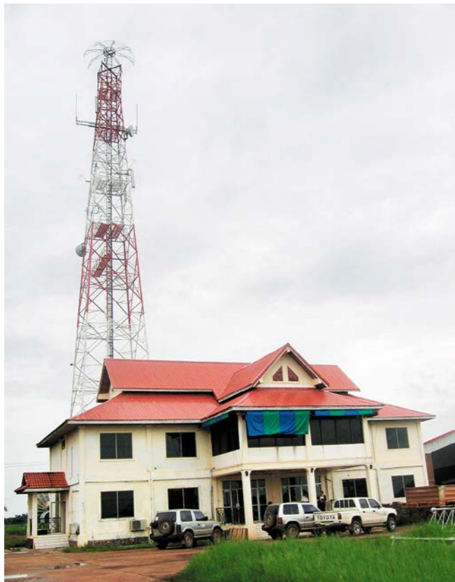
ສູນບັນຊາລະບົບໂລລະຄົມ 通讯系统指挥中心

ປະເທດຫວຽດນາມ, ສປປ ລາວ, ໄທ ແລະ ມາເລເຊຍ. ຮູບລັກສະນະໃນການເຊື່ອມຕໍ່ແບບນີ້ເອີ້ນວ່າໂຄງການ CSC (China-South East Asia Cable) ຊຶ່ງມີໄລຍະທາງຜ່ານ ສປປ ລາວ 430 ກມ ໃນລະບົບຄວາມໄວ 2.5 Gbps ແລະ ລະບົບການເຊື່ອມຕໍ່ອີກອັນໜຶ່ງແມ່ນເປັນການລົງທຶນໂດຍບໍລິສັດຜູ້ໃຫ້ບໍລິການດ້ານໂທລະຄົມມະນາຄົມທັງໝົດໃນທົ່ວປະເທດ.