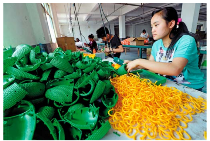
ຄອນສິ່ງຕໍ່ “ວະວະຈຸລາ” ທີ່ປະເທດຈີນຜະລິດ “ຄາຊີໂລລາ” ໄດ້ກາຍເປັນອອງມີຍົມໃໝ່ໃນບານເຕະໂລກ 中国制造“卡罗拉”接棒“瓦瓦祖拉”成为世界杯新宠

ໃນຫຼາຍປີມານີ້, ຜະລິດຕະພັນທີ່“ຜະລິດຢູ່ຈີນ” ໄດ້ມີຊື່ສຽງໃນໂລກ, ແຕ່ຍ້ອນວ່າບໍ່ໄດ້ຮັບການມອບສິດ, ບໍ່ມີສິດພັດທະນາ ແລະ ກຳນົດລາຄາ, ຈຶ່ງຢູ່ໃນຊັ້ນຕໍ່າສຸດຂອງ