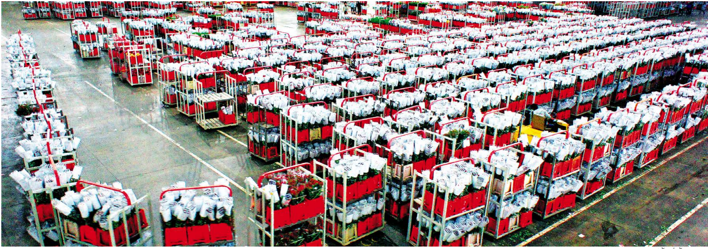
ດອກໄມ້ສິດທີ່ລໍຖ້າປະມຸນຂາຍ ທີ່ສູນຄ້າຂາຍດອກໄມ້ສາກົນຄຸນນະພາບ 待拍卖的鲜花 高宏图

ທີ່ຕັ້ງພູມສາດທີ່ມີທ່າແຮງພິເສດ, ເຮັດໃຫ້ແຂວງຢູນ ນານກາຍເປັນໜຶ່ງໃນຕະຫຼາດດອກໄມ້ສິດໃຫຍ່ທີ່ສຸດຂອງ ຈີນ. ປະຈຸບັນ, ດອກໄມ້ໄດ້ກາຍເປັນນາມບັດອັນໜຶ່ງສຳ ລັບແຂວງຢູນນານ. ນັກທ່ອງທ່ຽວມາຮອດແຂວງຢູນນານ ມັກຊື້ດອກໄມ້ສິດເມື່ອບ້ານບໍ່ຫຼາຍກໍ່ໜ້ອຍ. ສຳລັບ“ດອກ ໄມ້ຢູນນານ”ເປັນຈຳນວນຫຼວງຫຼາຍນັ້ນ, ແມ່ນຜ່ານສູນ ຄ້າຂາຍດອກໄມ້ສາກົນຢູນນານກ້າວສູ່ແຫ່ງຕ່າງໆຂອງ ໂລກ.