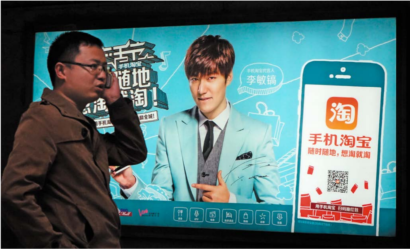
ລູກຄ້ານໍາໃຊ້ໂທລະສັບມືຖືໄດ້ຢ່າງຜ່ານດ້ານໜ້າໂປສະເຕີໃຫຍ່ຂອງໂທລະສັບມືຖືທາງປາວທີ່ຕັ້ງຖະໜົນປັກກິ່ງ ສູນຜູ້ໃຊ້ໂທລະສັບມືຖືໄດ້ຢ່າງຜ່ານດ້ານໜ້າໂປສະເຕີໃຫຍ່ຂອງໂທລະສັບມືຖືທາງປາວທີ່ຕັ້ງຖະໜົນປັກກິ່ງ

ການຄ້າເອເລັກໂຕຼນິກເຊິ່ງລວມທັງການຂາຍຍ່ອຍທາງອິນເຕີເນັດນັ້ນໄດ້ມີບົດບາດຊຸກຍູ້ຕໍ່ເສດຖະກິດຈີນ. ດ້ານໜຶ່ງ, ການຂາຍຍ່ອຍທາງອິນເຕີເນັດສາມາດໄປເຖິງໄປຮອດມຸມຕ່າງໆຂອງຈີນ, ມີບົດບາດຊຸກຍູ້ການບໍລິໂພກນັບມື້ນັບພື້ນເດັ່ນຂຶ້ນ. ອີກດ້ານໜຶ່ງ, ການພັດທະນາຂອງການຄ້າເອເລັກໂຕຼນິກໄດ້ຊຸກຍູ້ການປະກອບອາຊີບ