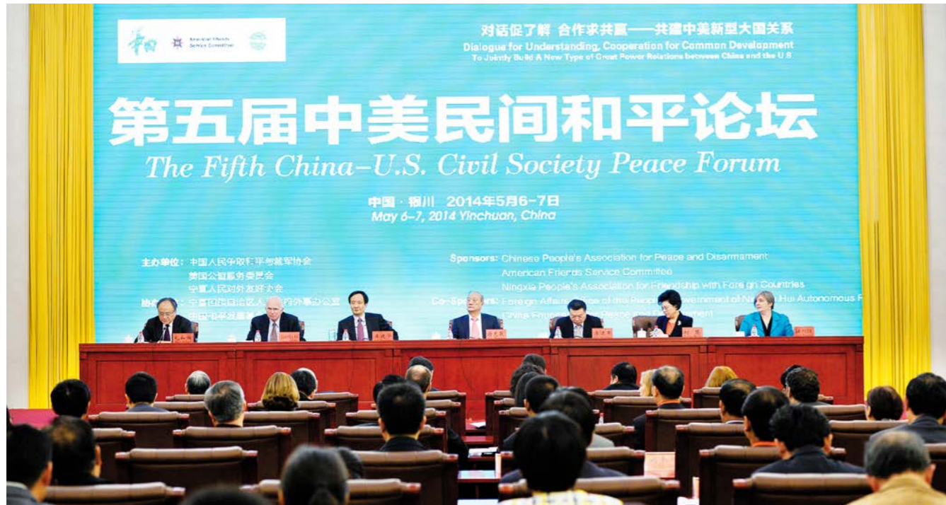
ວັນທີ 6 ພຶດສະພາ, ໄດ້ຈັດມີການເປີດເວທີປາໄສສັນຕິພາບລະຫວ່າງປະຊາຊົນຈີນ-ອາເມລິກາຄັ້ງທີ 5 5月6日, 第五届中美民间和平论坛举行开幕式

ຄວາມສະເໝີພາບກັນ, ມີເປັນປະຖົມປັດໄຈສໍາລັບການ ແລກປ່ຽນກັນ; ຄວາມສິວິໄລຍອມຮັບເອົາຄວາມແຕກ ຕ່າງເຊິ່ງກັນ ແລະ ກັນ, ຈຶ່ງມີແຮງຊຸກຍູ້ໃຫ້ມີການແລກ ປ່ຽນກັນ.