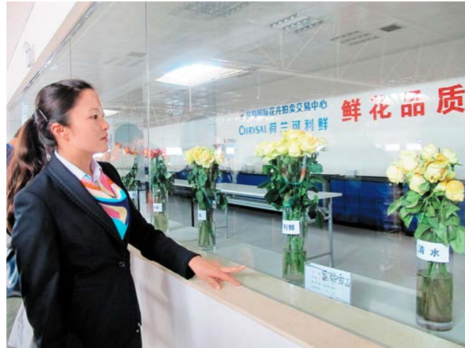
ພະນັກງານແມ່ນ້ຳສະພາບການສູນດອກໄມ້ 工作人员介绍花卉中心情况

ປະມູນຂາຍລວມທັງການນຳເຂົ້າສິນຄ້າ, ກວດກາຄຸນນະພາບ, ປະມູນຂາຍ, ແລະ ແບ່ງສິນຄ້າ. ການປະມູນຂາຍດອກໄມ້ແມ່ນໃຊ້ວິທີ“ປະມູນຂາຍແບບຫຼຸດລາຄາ”, ຄື, ນັບແຕ່ເລີ່ມການປະມູນຂາຍ, ເຂັ້ມທົດຊີ້ລາຄາຈາກສູງຮອດໂດຍໝູ່ວຽນແບບກົງກັນຂ້າມກັບທົດເຂັ້ມໂມງ, ຜູ້ທຳອິດທີ່ໄດ້ກົດປຸ້ມປະມູນເຮັດໃຫ້ທົດຊີ້ລາຄາຢຸດລົງນັ້ນກໍ່ຈະ