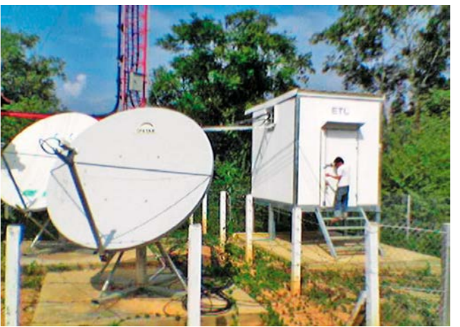
ລະບົບດາວທຽມເຂດຊົນນະບົດ 农村地面卫星系统

ເຖິງວ່າການພັດທະນານັ້ນຈະກວ້າງຂວາງ ແລະ ກ້າວກະໂດດກໍຕາມແຕ່ໃນອະນາຄົດອັນຕໍ່ໜ້າ ແລະ ຍາວນານຂະແໜງການໂທລະຄົມມະນາຄົມ(ໄອຊີທິ) ຈໍາເປັນຈະໄດ້ອອກແຮງເອົາໃຈໃສ່ການພັດທະນາໃຫ້ຫລາຍຂຶ້ນຕື່ມເພື່ອໃຫ້ມີປະລິມານ ແລະ ຄຸນນະພາບດີຂຶ້ນກວ່າເກົ່າສະໜອງການບໍລິການຂໍ້ມູນຂ່າວສານໃຫ້ມີຄວາມກ້າວໜ້າທັນສະໄໝທ່ວງທັນກັບຍຸກສະໄໝຄືກັບປະເທດອ້ອມຂ້າງ ແລະ ກັບສາກົນອີກດ້ວຍ.