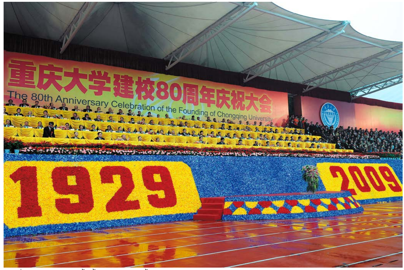
ສະຖານທີ່ງານສະເຫລີມສະຫລອງການສ້າງຕັ້ງມະຫາວິທະຍາໄລຊຸງສິງຄອບຮອບ 80 ປີ 重庆大学建校 80 周年庆祝大会现场

ມະຫາວິທະຍາໄລຊຸງສິງຍັດໜັ້ນປະຕິບັດຍຸດທະສາດພັດທະນາເພື່ອເຊື່ອມໂຍງກັບສາກົນ, ໄດ້ສ້າງການພົວພັນທີ່ດີກັບ ໂຮງຮຽນຊັ້ນສູງທີ່ມີຊື່ສຽງຂອງ 20 ກວ່າປະເທດ, ເຊັ່ນ, ອາເມລິກາ, ອັງກິດ, ຝຣັ່ງ, ເຢຍລະມັນ ແລະ ຣັດເຊຍເປັນຕົ້ນ, ທັງນີ້ການພົວພັນຮ່ວມມືທີ່ດີກັບບໍລິສັດ ແລະ ອົງການຄົ້ນຄວ້າຂອງຫຼາຍປະເທດ ແລະ ເຂດແຄວ້ນ, ເຊັ່ນ, ສູນຄົ້ນຄວ້າ PARC ຂອງອາເມລິກາ, Rockwell, Microsoft, Lippo Group, Siemens ຂອງເຢຍລະມັນ, ກຸ່ມບໍລິສັດໄຟຟ້າເມີຍຊີຣີກົງ ແລະ ອື່ນໆ. ມະຫາວິທະຍາໄລຊຸງສິງເປັນໂຮງຮຽນທີ່ກະຊວງສຶກສາທິການກຳນົດໃຫ້ຮັບສະໝັກນັກສຶກສາຕ່າງປະເທດທີ່ໄດ້ທຶນສຶກສາລັດຖະບານຈີນ, ໄດ້ຮັບນັກສຶກສາຈາກ 123 ປະເທດ, ເຊັ່ນ: ອາເມລິກາ, ແບນຊິກ, ຝຣັ່ງ, ອິຕາລີ, ຣັດເຊຍ, ເບຣຊິນ, ອິສຕຼາລີ, ຍີ່ປຸ່ນ, ສ.ເກົາຫຼີ, ໄທ, ຫວຽດນາມ, ຕັງຊານີ ແລະ ອື່ນໆ. ກະຊວງສຶກສາທິການຈີນຍັງຈັດເຂົ້າເປັນ ໂຮງຮຽນຊັ້ນສູງແບບຢ່າງວດທຳອິດສຳລັບໂຮງຮຽນທີ່ຮັບນັກສຶກສາຕ່າງປະເທດ. ການສ້າງຕັ້ງສະຖາບັນຂົງຈີ້ປີຊາຢູ່ອິຕາລີ, ສະຖາບັນຂົງຈີ້ອຸດອນຢູໄທ, ແລະ ສະຖາບັນຂົງຈີ້ຢູ່ມະຫາວິທະຍາໄລລາໂຕເບຂອງອິສຕຼາລີ, ໄດ້ຊຸກຍູ້ການແລກປ່ຽນ ແລະ ການຮ່ວມມືລະຫວ່າງມະຫາວິທະຍາໄລຊຸງສິງກັບຕ່າງປະເທດ ໃນການສອນພາສາຈີນ, ການສຶກສາ, ແລະ ວັດທະນະທຳ.