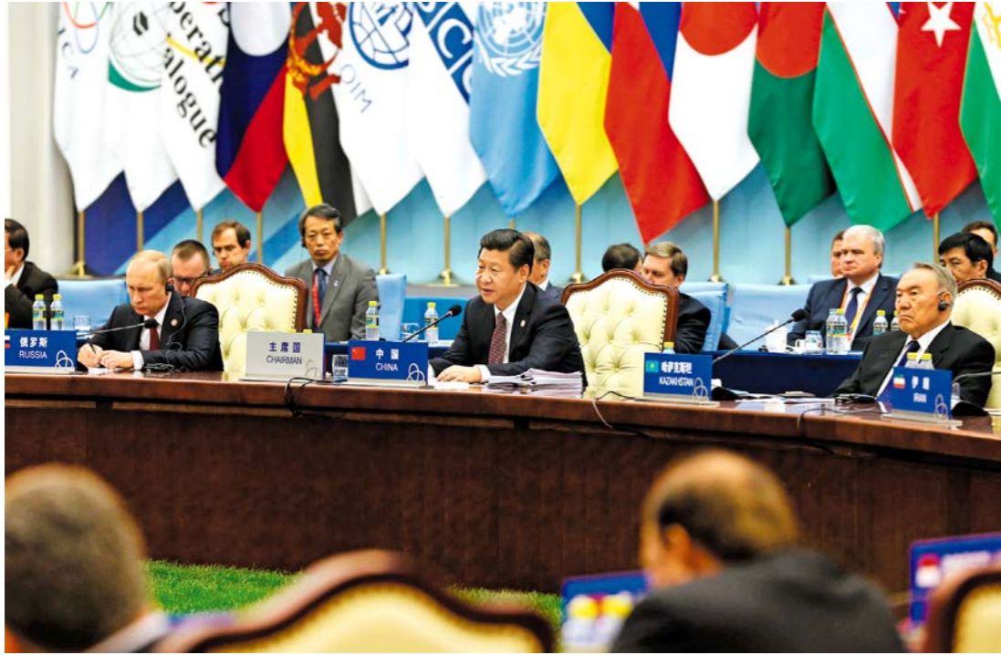
ກອງປະຊຸມສູດຍອດວ່າດ້ວຍການຮ່ວມມືກັນ ແລະ ສ້າງມາດຕະການຄວາມໂວ້ວາງໃຈກັນຄັ້ງທີ 4 ໄດ້ຈັດຂຶ້ນທີ່ຊຽງໄຮ, ທ່ານປະທານ ສີຈິນຜິງ ເປັນເຈົ້າພາບກອງປະຊຸມ ແລະ ຂຶ້ນກ່າວຄຳປາໄສທີ່ສຳຄັນ