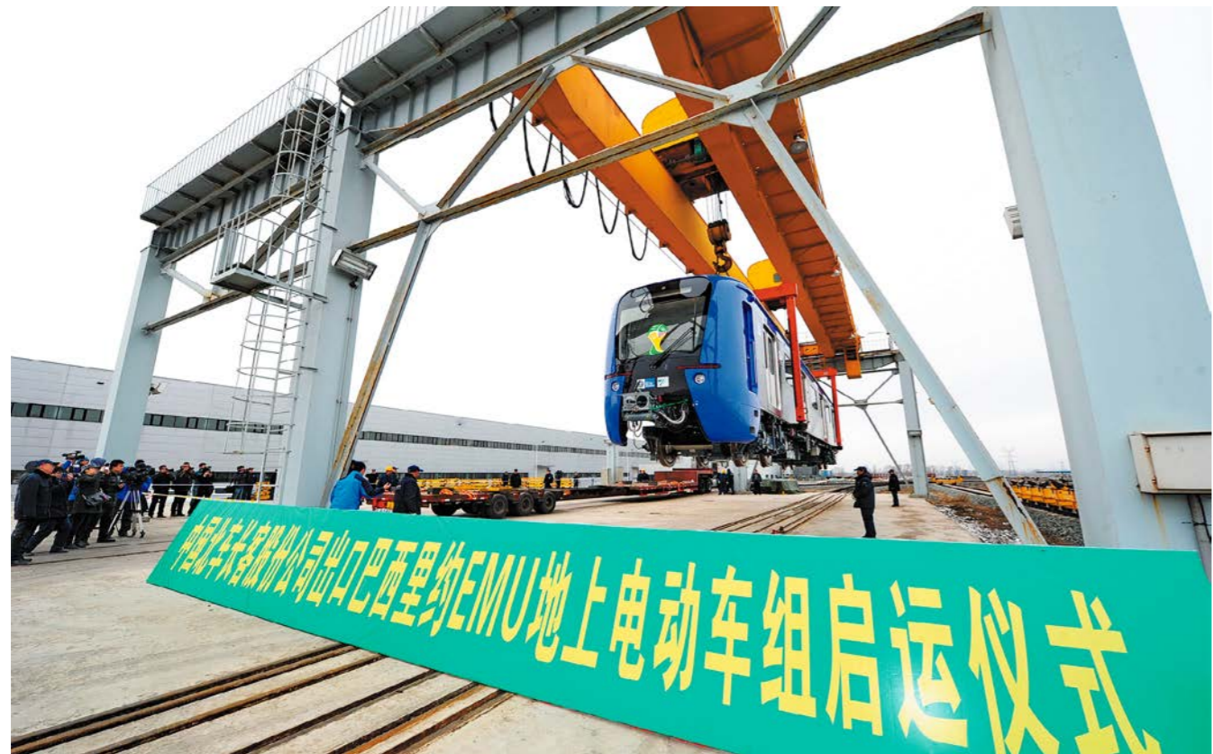
ລົດໂດຍສານເຫຼັກໃນຕົວເມືອງທີ່ຈີນຜະລິດໄດ້ຮັບໃຊ້ບານເຕະໂລກເບຼຊິນ 中国造城铁客车起运 服务巴西世界杯

ສິ່ງທີ່ຜະລິດຢູ່ຈີນເຊັ່ນກັນຍັງມີຄາໂຊ ໂລລາ caxirola ທີ່ເປັນເຄື່ອງມືກອງເຊຍທາງການທີ່ໃຊ້ສຳລັບເປົ່າເປັນສຽງ ແລະ ຈັບໂບກໄປມາຂອງແຜນບານໃນງານແຂ່ງ