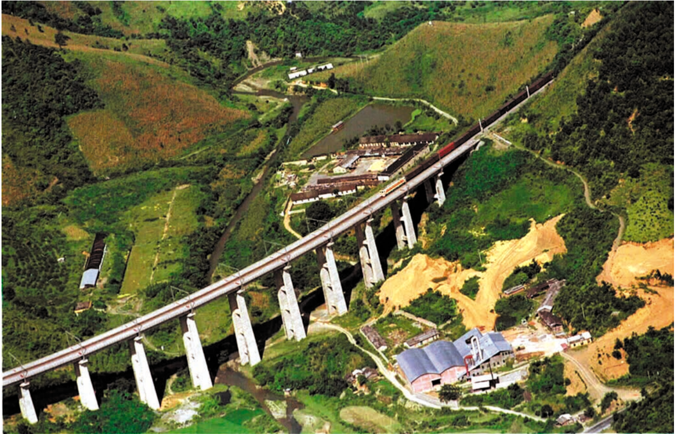
ປະເທດຈີນອອກແຮງກໍ່ສ້າງຕາໜ່າງທາງລົດໄຟພາກຕາເວັນຕົກສຽງໃຕ້ອອກສູ່ທະເລ ແລະ ອອກສູ່ຊາຍແດນ 中国全力打造西南出海出边铁路网络