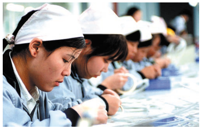
ເຊຍເພີນກໍ່ຮັງດິງດູດນິກມາເພື່ອດູດດິງນັກສຶກສາກັບຄືນປະເທດຕັ້ງວິຊາອາຊີບ 厦门筑巢引凤吸引留学人员回国创业