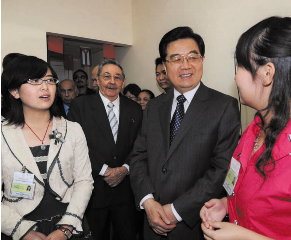
ທ່ານ ຮູ ຈິນຫາວ ປະທານປະເທດຈີນຢ້ຽມຢາມ ຖາມຂາວນັກສຶກສາຈີນທີ່ຮຽນຢູ່ມະຫາວິທະຍາ ໄລຮາວານາ.