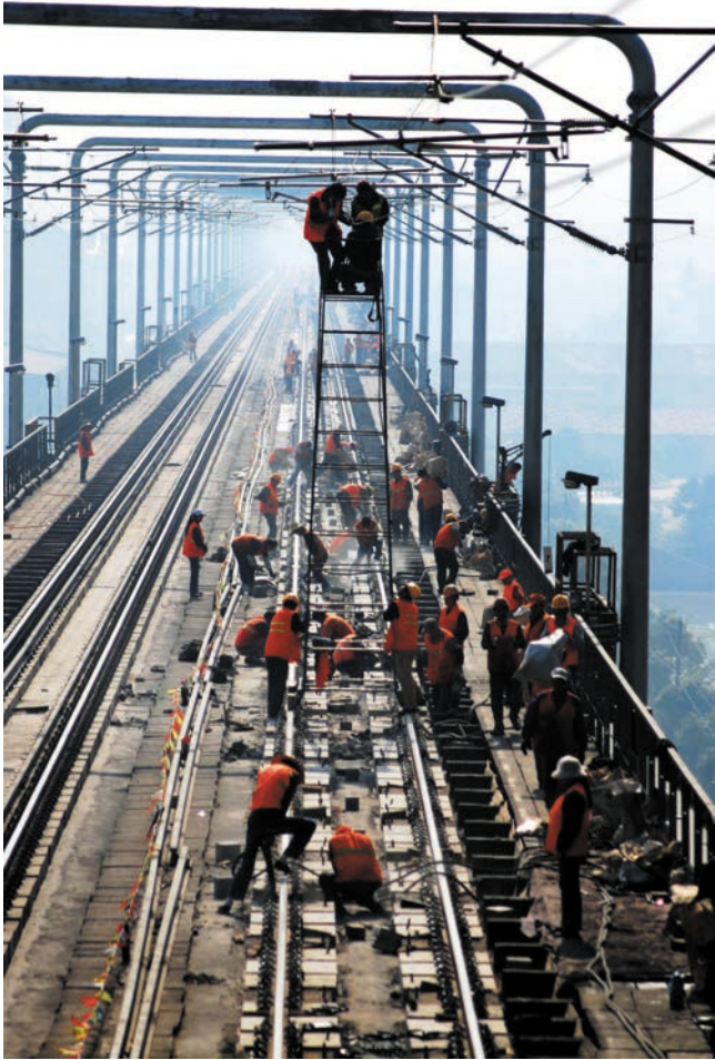
ການດັດສ້າງແບບໄຟຟ້າຂອງຂົວເຫຼັກໄຫຍ່ແມ່ນ້ຳຢາງຊີກຽວຈື່ວາຮຽງທາງລົດໄຟປັກກິ່ງ-ຈື່ວາຮຽງໂຕສຳເລັດສ້າງເສືອຂ່າຍວາງສາຍ 京九铁路九江长江大桥铁路桥电气化改造完成挂网架线 新华社图

ເຫດຈົນກໍາໄດ້ຢ່າງຮອບດ້ານເຊິ່ງເຕັກນິກຄົບຊຸດຄືການອອກແບບ, ການກໍ່ສ້າງ, ການບົວລະບັດຮັກສາ, ການສະໜອງໄຟຟ້າດຶງຈູງ, ສັນຍານສື່ສານ ແລະ ການຄວບຄຸມຂະບວນລົດໄຟເປັນຕົ້ນຂອງເສັ້ນທາງທີ່ມີຄວາມໄວ 200 ກິໂລແມັດ/ຊົ່ວໂມງ ( ແລະ ຂຶ້ນເມື່ອ ), ອັນໄດ້ຢ່າງເຂົ້າຖິ້ມແຖວທັນສະໄໝໃນການຍົກສູງລະດັບຄວາມໄວຂອງເສັ້ນທາງທີ່ມີຢູ່ໃນປະຈຸບັນຂອງເສັ້ນທາງລົດໄຟໂລກ.