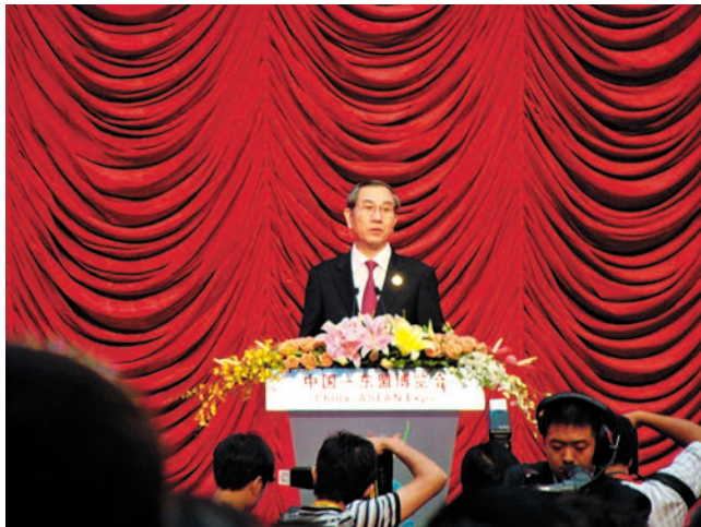
ວັນທີ 20 ຕຸລາປີ 2009, ທ່ານ ມາ ແປວປະທານເອດປົກຄອງຕົນເອງຊົນເຜົ່າຈາວກວາງຊີໄດ້ກ່າວຄຳປາໄສໃນຝີທີ່ເປີດງານວາງສະແດງສິນຄ້າຈີນອາຊຽນຄັ້ງທີ 6 2009年10月20日, 广西壮族自治区主席马飏在第六届中国—东盟博览会开幕式上致辞

ເສດ 11 ຄັ້ງດັ່ງກ່າວນີ້, ເນື້ອຫາການຮ່ວມມືນັ້ນໄດ້ແກ່ລິ້ນຕໍ່ໄປຢ່າງບໍ່ສຽງສຸດ, ຂົງເຂດທີ່ກ່ຽວເຖິງນັ້ນແມ່ນກວ້າງໃຫຍ່ໄພສານ. "ປາຖະກະຖາການຮ່ວມມືດ່ານພາສີກັບວົງການການຄ້າ"