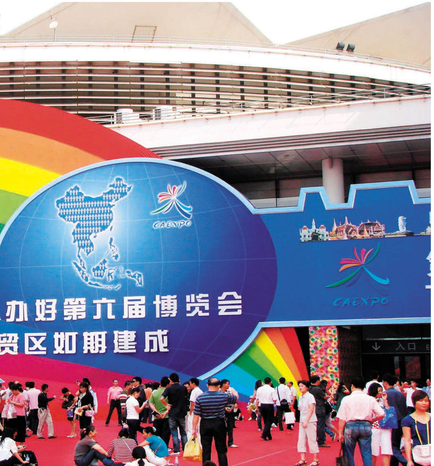
ງານວາງສະແດງສິນຄ້າຈີນ-ອາຊຽນຄັ້ງທີ 6, ມັກທຸລະກິດເປັນຈຳນວນຫຼວງຫຼາຍເຕັມໂຮມນຳກັນ 第六届中国—东盟博览会客商云集

ໄດ້ຍົກສູງລະດັບບໍລິການ, ໄດ້ເພີ່ມທະວີຄວາມເຂັ້ມແຂງຂອງນັກ ທຸລະກິດຈັດຊື້ເຊື້ອເຊີນ ແລະ ເສດຖະກິດຄົບຄູ່ກັບການຄ້າ, ໄດ້ສະ ໜອງຊ່ອງທາງການຮ່ວມມືເຮັດແທ້ທຳຈິງຢ່າງມີປະສິດທິພາບ