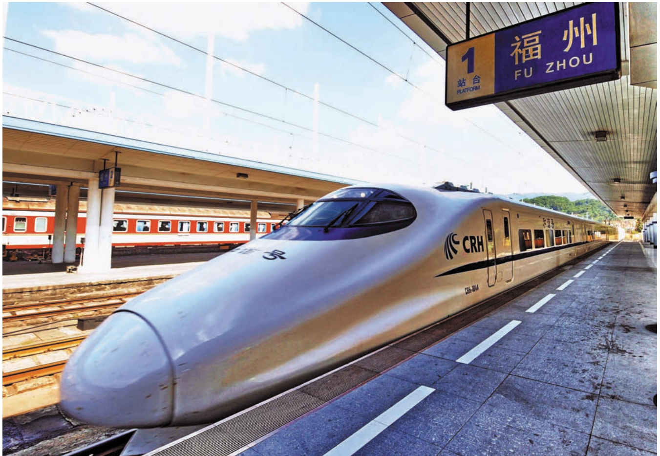
ຂະບວນລົດໄຟດ່ວນ “ ໝາຍເລກກົມກຽວ ” ອອກຈາກສະຖານີລົດໄຟຊຽງໄຮໄປເຖິງສະຖານີລົດຝູໂຈວ 从上海始发的“和谐号”高速列车抵达福州火车站 新华社图

ຈີນຈະມີເສັ້ນທາງຂົນສົ່ງຜູ້ໂດຍສານສະເພາະ ແລະ ເສັ້ນທາງລົດໄຟລະຫວ່າງຕົວເມືອງກັບຕົວເມືອງຈໍານວນ 13 ພັນກິໂລແມັດປະກອບເຂົ້າໃນການດໍາເນີນທຸລະກິດຂົນສົ່ງ, ອັນໄດ້ສ້າງໂດຍພື້ນຖານໃຫ້ກາຍເປັນຕາມ່າງຂົນສົ່ງຜູ້ໂດຍສານຢ່າງໄວວາໃນທົ່ວປະເທດທີ່ມີໂຄງຮ່າງ "ສີ່ສາຍຕັ້ງສີ່ສາຍຂວາງ" ກໍ່ຄືລະບົບເສັ້ນທາງລົດໄຟລະຫວ່າງຕົວເມືອງກັບຕົວເມືອງຂອງເຂດສາມຫລ່ຽມແມ່ນ້ໍາຢາງເຊາຽງ, ສາມຫລ່ຽມແມ່ນ້ໍາຈູຽງ, ເຂດອ້ອມຮອບທະເລໂປໂຮ ແລະ ເຂດເຕົ້າໂຮມຕົວເມືອງອື່ນໆ. ໃນລະຫວ່າງ 73 ປີ ນັບແຕ່ປີ 1986 ທີ່ມີເສັ້ນທາງລົດໄຟຊຽງໄຮ - ອູສົງເຊິ່ງເປັນເສັ້ນທາງລົດໄຟສາຍທໍາອິດຂອງປະເທດຈີນມາເຖິງປີ 1949, ລະຍະທາງດໍາເນີນທຸລະກິດຂອງເສັ້ນທາງລົດໄຟທົ່ວປະເທດຈີນມີພຽງ 22 ພັນກິໂລແມັດ, ການຂະຫຍາຍຕົວຂອງເສັ້ນທາງລົດໄຟແມ່ນຊັກຊ້າທີ່ສຸດ. ພາຍຫລັງທີ່ໄດ້ສະຖາປະນາປະເທດຈີນໃໝ່, ບົນພື້ນຖານສ້ອມແປງເສັ້ນທາງລົດໄຟປະ