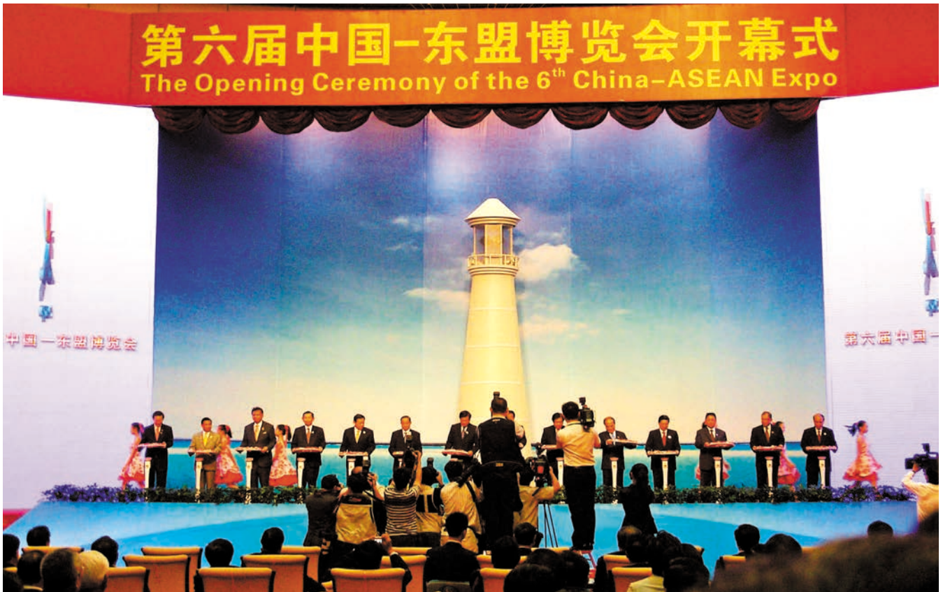
ວັນທີ 20 ຕຸລາປີ 2009, ງານວາງສະແດງສິນຄ້າຈີນ-ອາຊຽນຄັ້ງທີ 6 ໄດ້ເປີດພິທີຢ່າງຄືກັນທີ່ນະນາມິນກວາງຊີ ສປປ ຈີນ 2009年10月20日, 第六届中国—东盟博览会在广西南宁隆重开幕