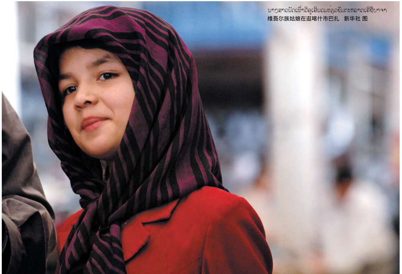
ນາງສາວພັດເຜົ່າວິຊູເອີພອນທ່ຽວຊົມຕະຫລາດຄາສີປາຈາ 维吾尔族姑娘在逛喀什市巴扎

ຢູ່ປາຈາແຫ່ງໜຶ່ງທີ່ຊານເມືອງຄາສີເຊິ່ງມີການຄ້າຂາຍສັດ ລ້ຽງເປັນຫລັກນັ້ນ, ຊາວກະສິກອນ ແລະ ລ້ຽງສັດທີ່ມາຈາກຊິນ