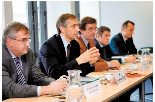
ສະຫະພາບເອີຣົບເພີ່ມເຕີມເງິນຊ່ວຍເຫຼືອນັກສຶກສາຈີນ 欧盟追加拨款资助中国留学项目

ອອກຢ່າງຈະແຈ້ງວ່າ: ໄປຮຽນຢູ່ຕ່າງປະເທດດ້ວຍທຶນເອງກໍ ແມ່ນຊ່ອງທາງບຳລຸງກໍສ້າງບຸກຄະລາກອນເສັ້ນໜຶ່ງ, ລັດມີນະ ໂຍບາຍສະເໝີພາບດ້ານການເມືອງຕໍ່ນັກສຶກດ້ວຍທຶນເອງເທົ່າ ທ່ຽງກັບນັກສຶກສາດ້ວຍທຶນການສຶກສາຂອງລັດ. ໃນຂະນະແລກ ປ່ຽນສະຕະວັດ, ໝູ່ຄະນະນຳພາສູນກາງລຸ້ນທີ 3 ຂອງພັກໂດຍ ແມ່ນທ່ານຈຽວເຈີມິງເປັນແກ່ນສານໄດ້ສະເໜີທິດທາງວຽກງານ ນັກສຶກສາທີ່ວ່າ: “ສະໜັບສະໜູນໄປສຶກສາຢູ່ຕ່າງປະເທດ, ສົ່ງ ເສີມກັບຄືນປະເທດ, ໄປມາຢ່າງເສລີ” ແລະ “ສົ່ງເສີມນັກສຶກສາ ກັບຄືນປະເທດມາເຮັດວຽກ ຫຼື ຮັບໃຊ້ປະເທດຊາດດ້ວຍຮູບການ ຢ່າງເໝາະສົມ”, ໄດ້ເຮັດໃຫ້ເນື້ອໃນວຽກງານນັກສຶກສາຂອງ ຈີນໃຫ້ຄົບຖ້ວນສົມບູນ, ສະໜອງອົງເຂດແລະຊ່ອງລະຫວ່າງອັນ ກວ້າງຂວາງໃຫ້ແກ່ນັກສຶກສາອັນໄພສານທີ່ຮຽນຢູ່ພື້ນທະເລ