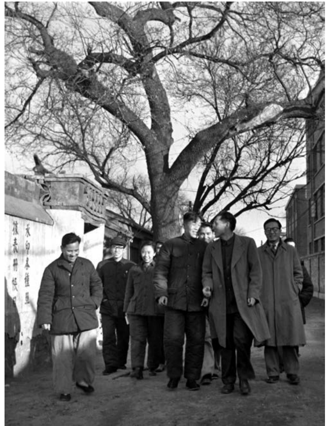
ຫັນວາປີ 1953 ບັນດາຊາວໝູ່ທີ່ກັບຄືນປະເທດໄດ້ເຂົ້າຮ່ວມວຽກງານເລືອກຕັ້ງ 1953 年 12 月，归国青年们参加普选工作

ຄຳປະໂຫຍກດັ່ງກ່າວນີ້ບໍ່ພຽງແຕ່ກາຍເປັນແຫຼ່ງກຳເນີດ ແມ່ແຮງຂອງນັກສຶກສາທີ່ຮຽນຢູ່ໂຊວຽດແລະຂອງຊາວໝູ່