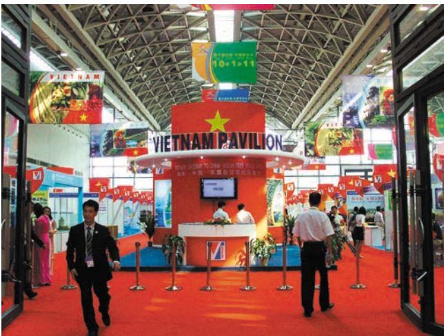
ຫໍວາງສະແດງຫວຽດນາມ 越南展馆