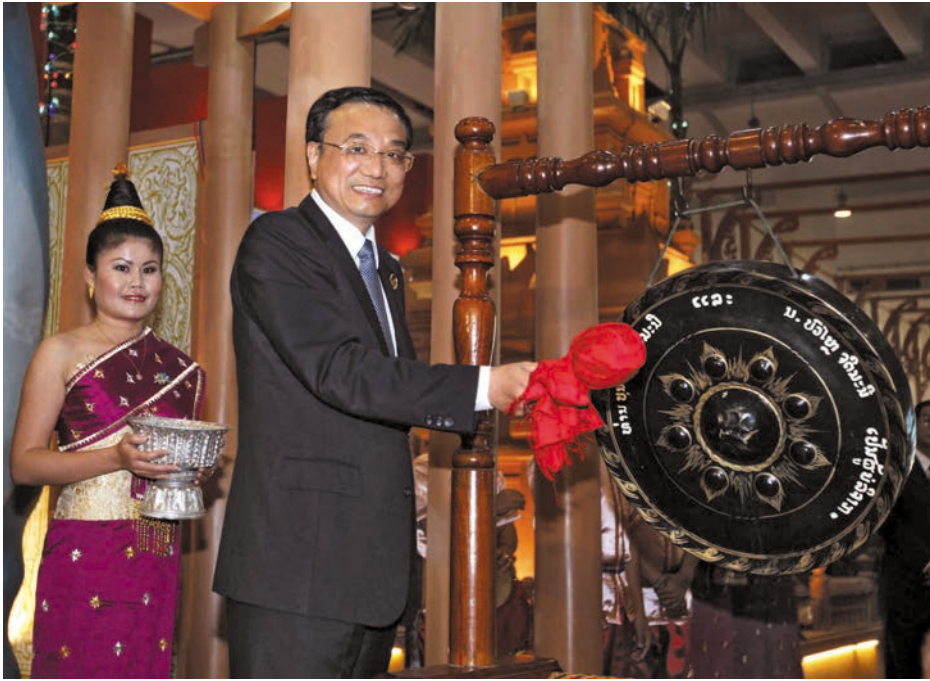
ວັນທີ 19 ຕຸລາປີ 2009 .ກ່ອນຈະເປີດງານວາງສະແດງສິນຄ້າຈີນ-ອາຊຽນຄັ້ງທີ 6 ທ່ານ ລີ ເຮີ ຊຽງ ກໍານະການປະຈຳກົມການເມືອງ, ຮອງນາຍົກລັດຖະມົນຕີຈີນມາສູນການຄ້າຢ້ຽມຊົມຫ້ອງວາງສະແດງ. ພາບນີ້ແມ່ນທ່ານ ລີ ເຮີ ຊຽງ ຕີ້ລ້ອງພ້ອມກັນກັບທ່ານບົວສອນ ບຸບຜາວັນນາຍົກລາວເຜື້ອໄຂວາງສະແດງລາວ 2009 年 10 月 19 日, 在第六届中国—东盟博览会开幕前夕, 中共中央政治局常委、国务院副总理李克强来到南宁国际会展中心参观展馆。图为李克强敲响铜锣, 与老挝总理波松共同为老挝馆开馆