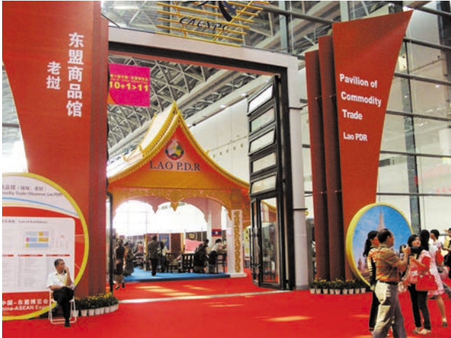
ຫ້ວາງສະແດງລາວທີ່ມີສີສັນເອກະລາດສະເພາະ 极具特色的老挝展馆

ງານເອກສະໂປຈີນ-ອາຊຽນ. ໃນກອງປະຊຸມເຈລະຈາ, ເຈົ້າໜ້າທີ່ລັດຖະບານແລະ ນັກທຸລະກິດຂອງຈີນ ແລະ ລາວທັງສອງຝ່າຍໄດ້ແລກປ່ຽນຄວາມເຫັນຢ່າງກວ້າງຂວາງກ່ຽວກັບບັນຫາຄື ການລົງທຶນດ້ານການຄ້າ, ຫັດສະນະການສຶກສາທາງການຄ້າ ແລະ ການຮ່ວມມືລະຫວ່າງບໍລິສັດເປັນຕົ້ນ, ຄະນະຜູ້ແທນການຄ້າແຫ່ງ ສປປ ລາວໄດ້ຕອບຄໍາຖາມຕ່າງໆທີ່ບໍລິສັດຈີນໄດ້ຍົກຂຶ້ນ. ນັກທຸລະກິດຈີນລາວທັງສອງຝ່າຍຫວັງວ່າຈະເພີ່ມທະວີການຮ່ວມມືດ້ານການຄ້າຂອງສອງຝ່າຍ, ເພີ່ມການໄປມາຫາສູ່ກັນດ້ານການຄ້າ ແລະ ການລົງທຶນ, ຕ່າງຝ່າຍຕ່າງໆມີຜົນປະໂຫຍດພ້ອມກັນ, ສະແຫວງຫາການພັດທະນາ. ທ່ານລຽງສະວັນນາທີ່ປຶກສາສະພາການຄ້າແຫ່ງຊາດລາວທີ່ໄດ້ເຂົ້າຮ່ວມງານເອກສະໂປຈີນ-ອາຊຽນເຕີດຕໍ່ກັນ 6 ຄັ້ງເວົ້າວ່າ, ຍອດຈຳນວນລົງທຶນຂອງບໍລິສັດຈີນຢູ່ ສປປ ລາວໃນແຕ່ລະປີໄດ້ເພີ່ມຂຶ້ນ