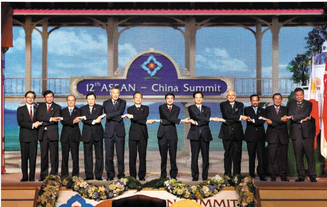
ວັນທີ 24 ເດືອນ 10 ປີ 2009, ທ່ານ ເວີນ ເຈຍປາວ ນາຍົກລັດຖະມົນຕີຈີນເອົ້າຮ່ວມກອງປະຊຸມຜູ້ນຳຈີນ-ອາຊຽນຄັ້ງທີ 12 ທີ່ຫົວຫີນແຫ່ງປະເທດໄທ (10 + 1). ພາບນີ້ແມ່ນຮູບຖ່າຍຮ່ວມໝູ່ກັບຜູ້ນຳທຶນຮ່ວມກອງປະຊຸມ 2009年10月24日, 中国国务院总理温家宝在泰国华欣出席第十二次中国与东盟领导人会议(10+1), 与会领导人集体合影

ຂ. ເລັ່ງລັດກໍ່ສ້າງໂຄງຮ່າງຜືນຖານໃຫ້ໄວເອົ້າ. ປົກສາຫາ