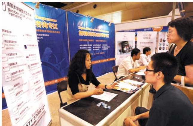
ອອກໄປຮຽນຢູ່ຕ່າງປະເທດແມ່ນການຄິດເລືອກຂອງນັກຮຽນເສັ້ນມະຫາວິທະຍາໄລ 出国留学, 高考生的新选择

ຫວ່າງມໍ່ໆປີມານີ້, ວຽກງານນັກສຶກສາຈີນໄດ້ຄົບຖ້ວນສົມບູນຕື່ມອີກ, ໄດ້ສ້າງຕັ້ງລະບົບອົງການບໍລິການສາລະທິດ ແລະ ມີຫຼາຍຊັ້ນລະດັບແຕ່ການຄິດເລືອກຫາການແຕ່ງຕັ້ງ, ການນໍາພາຕະຫລາດນັກສຶກສາ ແລະ ເຮັດເປັນແບບແຜນ, ການຄຸ້ມຄອງຢູ່ຕ່າງປະເທດແລະການບໍລິການ, ກັບຄືນປະເທດຫວຽກເຮັດງານທຳແລະປະດິດສ້າງກິດຈະການ. ໂດຍສະເພາະແມ່ນກອງປະຊຸມໃຫຍ່ຂອງພັກຄັ້ງທີ 16 ໄດ້ມີແນວຄິດຢ່າງຈະແຈ້ງຄືຊັບພະຍາກອນບຸກຄະລາກອນເປັນຊັບພະຍາກອນອັນດັບທີ 1, ສະເໜີເປົ້າໝາຍຍຸດທະສາດໃຫ້ປະເທດຊາດເຂັ້ມແຂງດ້ວຍບຸກ