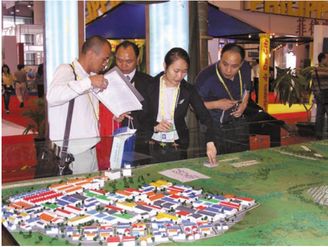
ແຜນຮູບຈຳລອງເຂດພິເສດແຂວງສະຫວັນນະເຂດ 沙湾拿吉省特区模型

ຊົມເຊີຍຄັ້ງແລ້ວຄັ້ງອີກຈາກທ່ານຜູ້ຊົມທຸກທ່ານນະທີ່ນີ້.