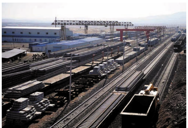
ມົງໂກນໃນພວມກໍ່ສ້າງທາງລົດໄຟໃໝ່ 6000 ກວ່າກິໂລແມັດໄດ້ເປີດຊ່ອງທາງຄວາມຮຽກຮ້ອງຕ້ອງການພາຍໃນ. 内蒙古正新建近 6000 公里铁路打开内需通道

ປີ 2008 ຫາ ປີ 2012 ເປັນໄລຍະໜຶ່ງທີ່ບໍ່ເຄີຍມີມາກ່ອນຂອງຂະໜາດການກໍ່ສ້າງເສັ້ນທາງ ແລະ ຕາມ່າງເສັ້ນທາງລົດໄຟປະເທດຈີນ, ພ້ອມກັນນັ້ນກໍ່ແມ່ນໄລຍະໜຶ່ງທີ່ໄດ້ຮັບໜາກຜົນ, ສະເລ່ຍແລ້ວແຕ່ລະປີລົງທຶນ 700 ຕື້ຢອນອິ້ນໄປ, ມີສາຍໃໝ່ຈຳນວນ 5 ພັນກິໂລແມັດຂຶ້ນໄປປະກອບເຂົ້າໃນການດຳເນີນທຸລະກິດ. "ທ່ານ ຫວາງ ຈີໂກວໄດ້ເປີດເຜີຍ, ເຖິງປີ 2012, ຍອດລະຍະທາງດຳເນີນທຸລະກິດຂອງເສັ້ນທາງລົດໄຟປະເທດຈີນຈະຍົກລະດັບແຕ່ 80 ພັນກິໂລແມັດມາເຖິງ 110 ພັນກິໂລແມັດຂຶ້ນໄປ, ສາຍສຳຄັນຂອງເສັ້ນທາງລົດໄຟຈະປັນລຸໄດ້ການຂົນສົ່ງຜູ້ ໂດຍສານກັບການຂົນສົ່ງເຄື່ອງສິນຄ້າແຍກສາຍກັນ, ຕາມ່າງເສັ້ນທາງລົດໄຟທີ່ຈະເລີນສົມບູນແບບຈະກໍ່ຮ່າງສ້າງຕົວຂຶ້ນມາ, ໂດຍຈະຜ່ອນຄາຍອັ້ຈຳກັດຂອງການຂົນສົ່ງທາງລົດໄຟຄື "ປັ້ລົດໄຟໃບດຽວກໍ່ຫາຍາກ" ເປັນຕົ້ນໃຫ້ອ່ອນລົງ.