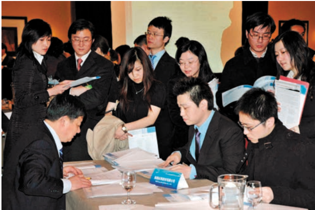
ໃນງານຮັບສະໝັກບຸກຄະລາກອນການເງິນທີ່ອໍານາດການປົກຄອງຊຽງໄຮຈັດຂຶ້ນທີ່ປະເທດອັງກິດນັ້ນ, ມີນັກສຶກສາຈີນທີ່ຮຽນວິຊາການເງິນແລະບຸກຄົນໃນວົງການການເງິນ 500 ກວ່າຄົນມາສືບຖາມ ແລະ ປຶກສາຫາລືກັນ. 上海市政府在英国举办的金融人才招聘会上, 有 500 多位在英国攻读金融专业的中国留学生和金融界人士前来咨询、商谈

ທ່ານລິວປາຍເຊີນລັດຖະບັນດິດສະຖາບັນວິສະວະກໍາຈີນ, ສາດສະດາຈານມະຫາວິທະຍາໄລຊິນຮວາບໍ່ຫ່ອນຊື່ຫລົງລິມມີ ລະດູຫຼາວວັນໜຶ່ງທີ່ບໍ່ທໍາມະດາທີ່ປັກກິ່ງ 30 ປີກ່ອນເຊັ່ນ: ວັນ ທີ 26 ທັນວາປີ 1978, ລາວເປັນນັກສຶກສາໜຶ່ງໃນຈໍານວນ