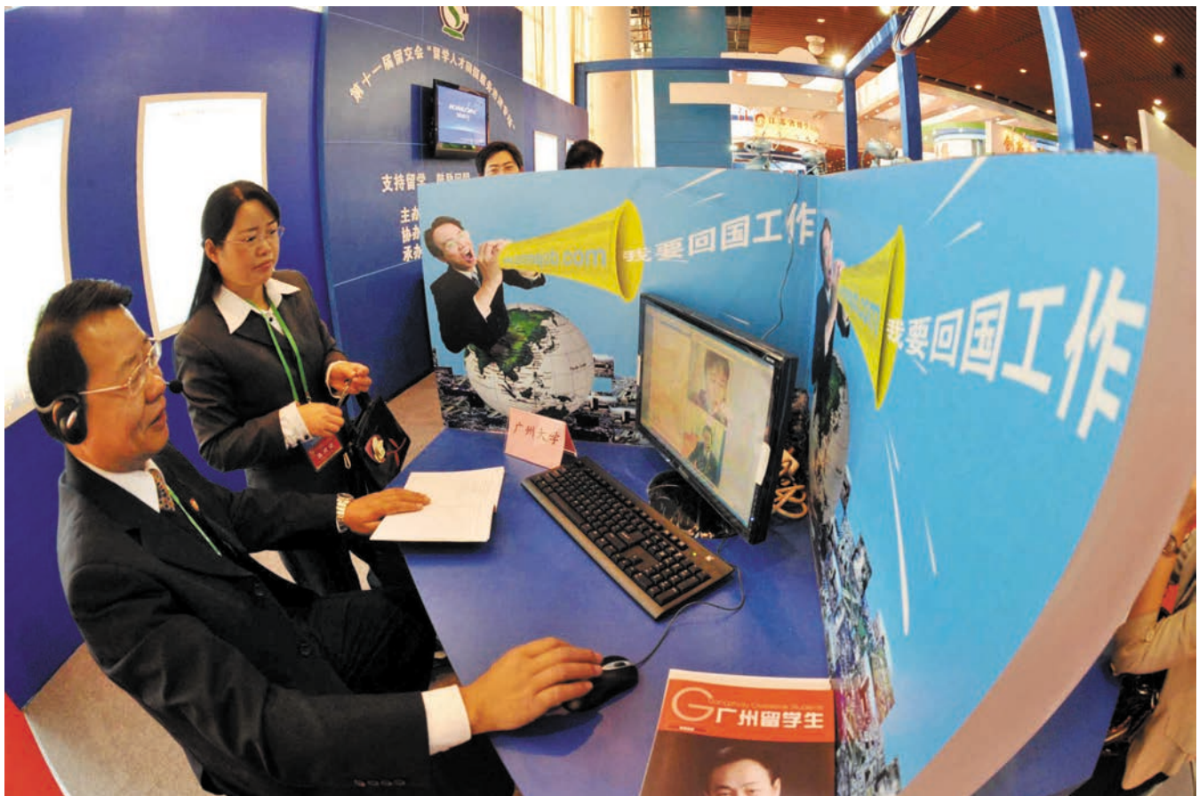
ງານແລກປ່ຽນວິທະຍາສາດເຕັກນິກກວາງໂຈວນັກສຶກສາຈີນຄັ້ງທີ11 第十一届中国留学人员广州科技交流会 新华社图

ທ່ານສົມຈຽນອະເດີດກຳມະການຄະນະລັດຖະບານທັງເປັນຫົວໜ້າຄະນະກຳມະການວິທະຍາສາດແຫ່ງຊາດ, ໄລຍະຮຳຮຽນ