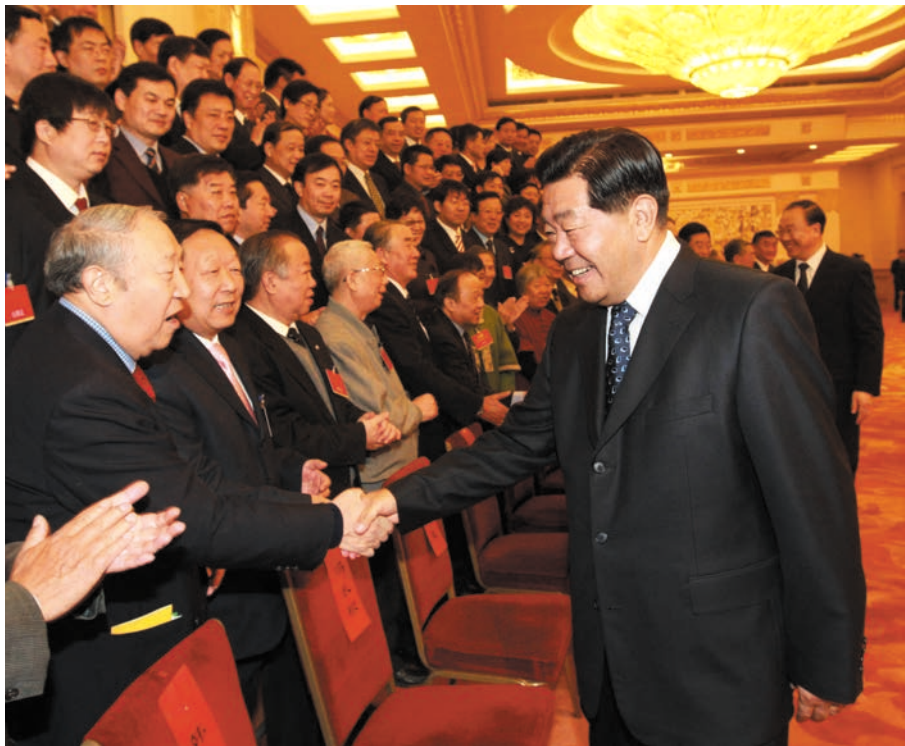
2008年12月9日,中共中央政治局常委、全国政协主席贾庆林在北京人民大会堂会见出席欧美同学会·中国留学人员联谊会第六届理事会第一次会议的全体理事