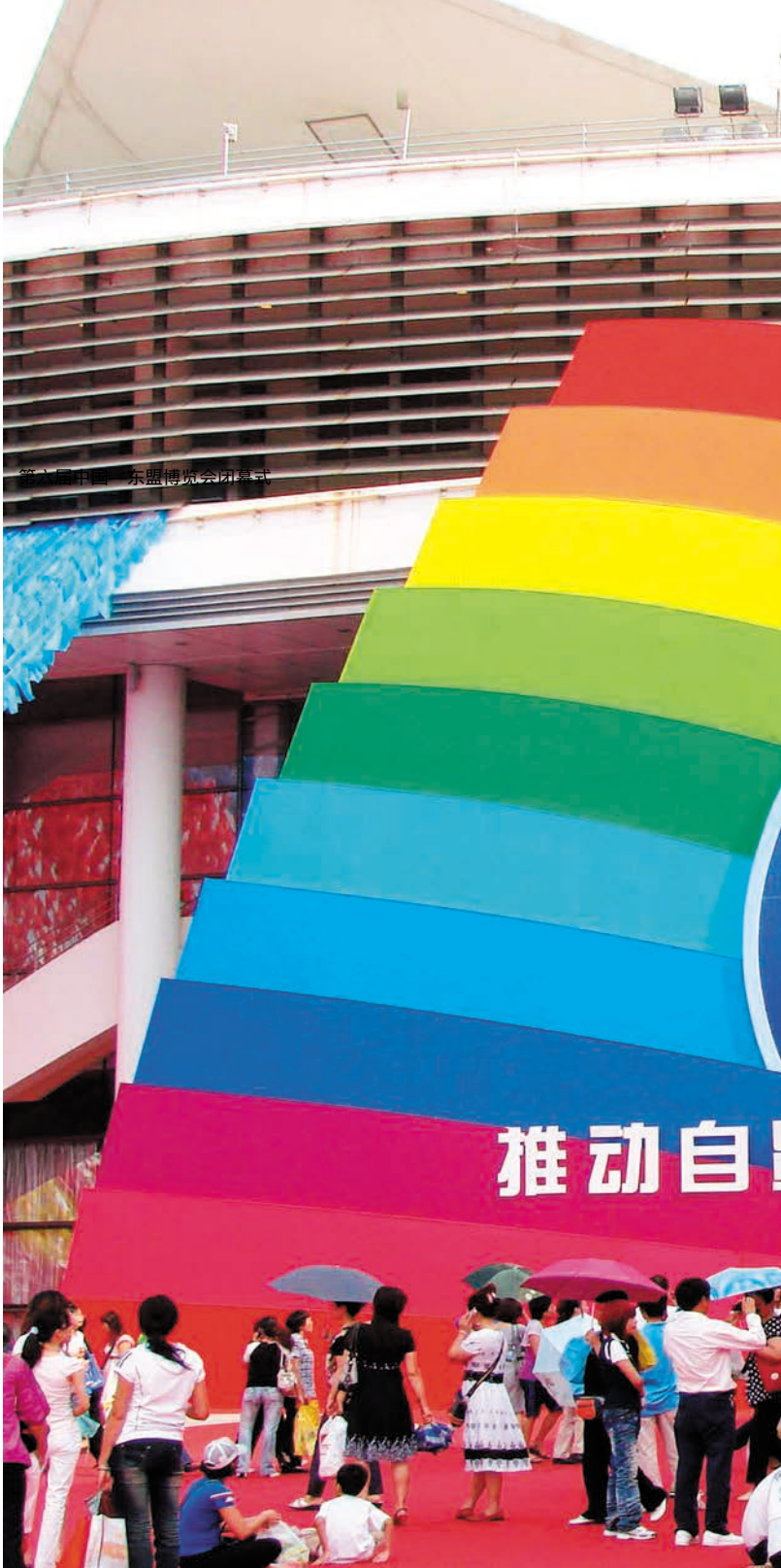
第六届中国—东盟博览会闭幕式

ງານວາງສະແດງສິນຄ້າຄັ້ງນີ້ໄດ້ນໍາໃຊ້ມາດຕາການໃໝ່ເຊັ່ນ: ເລື່ອນຍາວໄລຍະງານວາງສະແດງ, ຂະຫຍາຍຄວາມຂະໜາດຂອງງານວາງສະແດງໃຫ້ກວ້າງອອກ ແລະ ຕັ້ງສະໜາມຈັດງານວາງສະແດງທີ່ກ່ຽວຂ້ອງເປັນຄັ້ງທໍາອິດ ແລະ ອື່ນໆໄດ້ປະດິດສ້າງໃໝ່ຮູບແບບວາງສະແດງ, ອໍານວຍໂອກາດສະແດງ, ປຶກສາຫາລືກັນແລະຊື້ຂາຍຍິ່ງຫຼາຍກວ່າເກົ່າໃຫ້ແກ່ວິສາຫະກິດ, ຫ້ວອໍານວຍການຊ່ວຍເຫຼືອຍິ່ງຫຼາຍກວ່າເກົ່າໃຫ້ແກ່ວິສາຫາກິດທີ່ໄດ້ຮັບໂອກາດການຄ້າຂອງເຂດການຄ້າເສລີ. ພ້ອມກັນນັ້ນ, ການວາງສະແດງຫົວຂໍ້ສະເພາະກະສິກໍາ, ການວາງສະແດງບໍ່