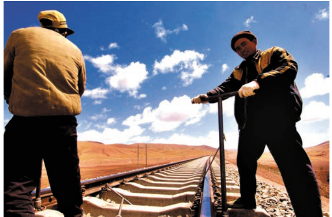
ບົວລະບັດທາງລົດໄຟຊິນໄອຕິເບດຢ່າງລະອຽດຖີຖ້ອນ 精心养护青藏铁路

ເສັ້ນທາງລົດໄຟປະເທດຈີນໄດ້ບັນລຸການຂະຫຍາຍຕົວແບບກະໂດດຂັ້ນໃຫ້ປະກົດເປັນຈິງ, ໃນນັ້ນ, ການກໍ່ສ້າງເສັ້ນທາງຂົນສົ່ງຜູ້ໂດຍສານສະເພາະ ແລະ ເຕັກນິກຍົກສູງຄວາມໄວຂອງເສັ້ນທາງທີ່ມີຢູ່ແລ້ວນັ້ນຍັງໄດ້ຮັບຄວາມຄືບໜ້າອັນໃຫຍ່ຫລວງ ແລະ ສຳຄັນ. ຜ່ານການຍົກລະດັບຄວາມໄວໃນຂອບເຂດກວ້າງຂວາງຄັ້ງທີ 6 ທີ່ໄດ້ຈັດຕັ້ງປະຕິບັດໃນປີ 2007, ເສັ້ນທາງລົດໄຟປະ