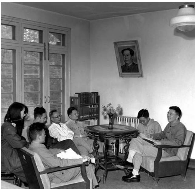
ກັນຍາປີ 1953, ທ່ານ ຮວາ ລິເກີນ ນັກວິທະຍາສາດປະຊາຊົນ, ນັກຄະນິດສາດທີ່ມີຊື່ສຽງຂອງຈີນ (ຂວາ) ເລົ່າຄວາມຮູ້ສຶກຢ້ຽມຢານ ໂຊວຽດແກ່ບັນດາສາດສະດາຈານຈີນຳຢ້ຽມ. 1953 年 9 月，中国人民科学家、著名数学家华罗庚（右一）在向来访问的教 授谈述访苏观感