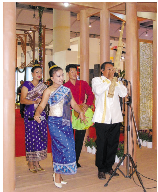
ພາບ1,2ແມ່ນບົດພ້ອມລຳທຳເພງນັກສະແດງລາວສະແດງໄດ້ດີດູດສາຍຕາຂອງນັກທຸລະກິດເປັນຈຳນວນຫຼວງຫຼາຍ 图 老挝演员们表演的优美歌舞吸引了众多客商的眼球