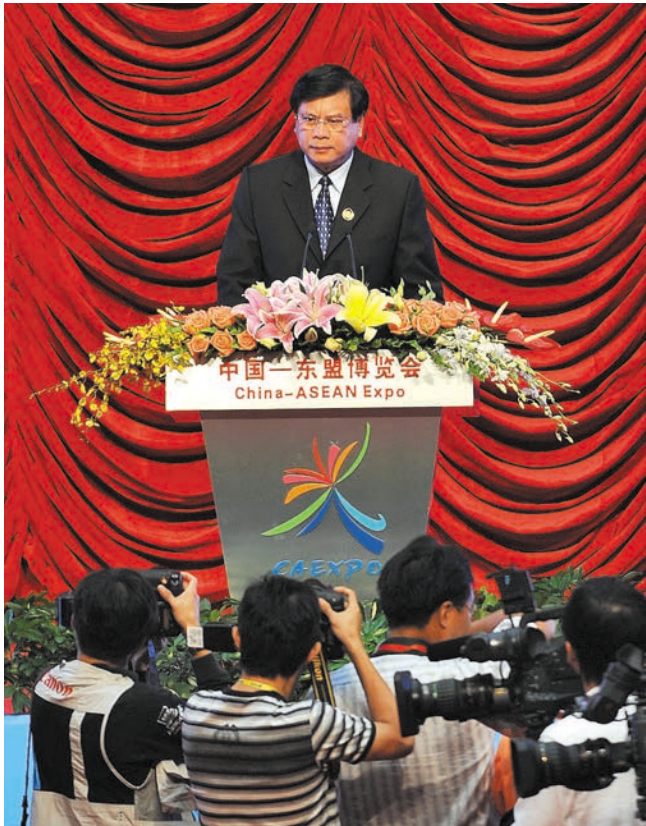
ວັນທີ 20 ຕຸລາປີ 2009, ງານວາງສະແດງສິນຄ້າຈີນ-ອາຊຽນຄັ້ງທີ 6 ໄດ້ເປີດພິທີຢ່າງສົກສົນທີ່ສູນຫໍປະຊຸມສາກົນນານນິນກວາງຊີ ສປ ຈີນ. ພາບນີ້ແມ່ນທ່ານປົວສອນ ບູຜາວັນນາຍົກລັດຖະມົນຕີລາວພວມກ່າວຄຳປາໄສໃນພິທີເປີດງານ 2009 年 10 月 20 日, 第六届中国 - 东盟博览会在广西南宁国际会展中心开幕。这是老挝总理波松·布帕万在开幕式上致词

ເພິ່ນເຫັນວ່າ, ການທີ່ສ້າງເຂດການຄ້າເສລີຈີນ-ອາຊຽນໃນປີ 2010 ໃຫ້ສຳເລັດ, ຈະໄດ້ນຳເອົາກາລະໂອກາດ ແລະ ການທ້າທາຍໃຫ້ແກ່ທັງສອງຝ່າຍ. ແຕ່ວ່າ, ປະເທດຈີນ ແລະ ອາຊຽນເປັນຄູ່ຮ່ວມມືຍຸດທະສາດ, ທະແນມແຕ່ທີ່ທັງສອງຝ່າຍພ້ອມກັນປະຕິບັດຖະແຫລງການກ່ຽວກັບຄູ່ຮ່ວມມືຍຸດທະສາດແລ້ວ, ແນ່ນອນຈະສາມາດສົ່ງເສີມໃຫ້ສາຍພົວພັນຂອງສອງຝ່າຍມີການຂະຫຍາຍຕົວຕື່ມອີກ, ນຳເອົາຄວາມສຸກ ແລະ ຜົນປະໂຫຍດມາໃຫ້ປະຊາຊົນອາຊຽນ ແລະ ຈີນໄດ້. ເພິ່ນໄດ້ເວົ້າວ່າ, ການຂະຫຍາຍຕົວຂອງສາຍພົວພັນປະເທດຈີນກັບອາຊຽນ ແລະ ການສ້າງສຳເລັດເຂດການຄ້າເສລີຈີນ-ອາຊຽນ, ເປັນແບບຢ່າງດີທີ່ສຸດສຳຫລັບການຮ່ວມມືສາກົນ.