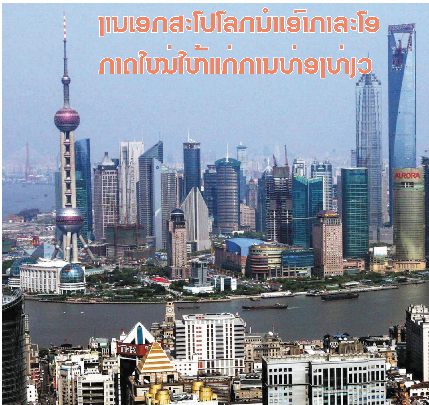
ພູຖຽວຊຽງໄຮ ສາມາດ ສາມາດ ສາມາດ