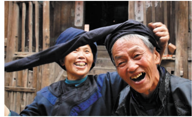
ແມ່ເຖົ້າເຜົ່າສູຍນວນມັດຜ້າພັນຫົວໃຫ້ພໍ່ເຖົ້າ 水族老太太 在给老伴扎头帕

ບຸນດວນເຈັກອາດເວົ້າໄດ້ວ່າເປັນບຸນປີໃໝ່ທີ່ມີເອກະລັກຊົນເຜົ່າທີ່ເປັນເວລາດົນນານ ແລະ ມີລາຍການເຄື່ອນໄຫວຫຼາຍທີ່ສຸດ. ການປີນຂຶ້ນສູງແລະແຂ່ງມ້າເປັນປະກົດການທີ່ມີຈຳເພາະໃນບຸນປີໃໝ່ຂອງບັນດາຊົນເຜົ່າພາກໃຕ້ຈີນ. ພ້ອມກັນນັ້ນບຸນດວນເຈັກກໍ່ເປັນເວທີວັດທະນະທຳທີ່ສຳຄັນໃນການເລີ່ມຕົ້ນສືບທອດ ແລະ ຂະຫຍາຍບັນດາສິນລະປະຜື້ນເມືອງຄື ການເຕັ້ນລຳກອງທອງ, ເຕັ້ນລຳແຄນ ແລະ ການຂັບລຳ ແລະ ອື່ນໆ.