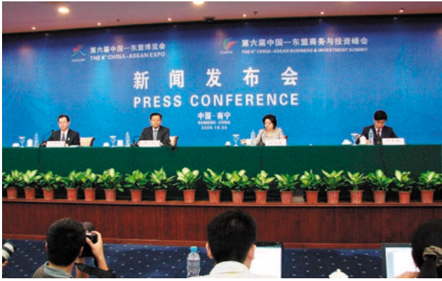
ທີ່ປະຊຸມສຸດຍອດສໍາພາດຂ່າວງານວາງສະແດງສິນຄ້າຈີນ-ອາຊຽນຄັ້ງທີ 6 ແລະ ກອງປະຊຸມທຸລະກິດການລົງທຶນຈີນ-ອາຊຽນຄັ້ງທີ 6 第六届中国—东盟博览会、第六届中国—东盟商务与投资峰会新闻发布会现场

ຮ່ວມ", ເພື່ອເປັນການເພີ່ມທະວີການຮ່ວມມືດ້ານການເງິນລະຫວ່າງຈີນ-ອາຊຽນໄດ້ສະເໜີການຈັດວາງກົນໄກອັນໃໝ່. ເວທີປາຖະກະຖາອັນສູງພັດທະນາຊັບສິນກະສິກໍາຈີນ-ອາຊຽນໄດ້ບັນລຸ "ຄວາມເຂົ້າໃຈກັນນານນິນ" ໄດ້ສ້າງຜືນຖານອັນແໜ້ນແຮ່ນເພື່ອພ້ອມກັນກໍ່ສ້າງເວທີອາຊຽນ 10 + 1 ແລະ ເວທີແຜນແມ່ນ້ຳຈູຈຽງ 9 + 2 ແລະ ເວທີແລກປ່ຽນກັນທະວີພາສີ. ການກໍານົດ "ຖະແຫຼງການຮ່ວມ" ແລະ "ຄວາມເຂົ້າໃຈກັນ" ທີ່ເປັນລະບົບໜຶ່ງໄດ້ເຮັດໃຫ້ເນື້ອໃນແລະຊັ້ນລະດັບຂອງ "ວິຖີທາງນານນິນ" ແຫ່ງການຮ່ວມມືຈີນ-ອາຊຽນໃຫ້ອຸດົມສົມບູນ, ໄດ້ມີຜົນດີແກ່ການຮ່ວມມືມິດຕະພາບທະວີພາສີໃນຫຼາຍຂົງເຂດໃຕ້ຂອບເຂດການຄ້າເສລີ, ໄດ້ສ້າງເສັ້ນທາງໃຫຍ່ອັນຮຸ່ງເຮືອງທີ່ມີອະນາຄົດທີ່ບໍ່ສຽງສຸດເສັ້ນໜຶ່ງ.