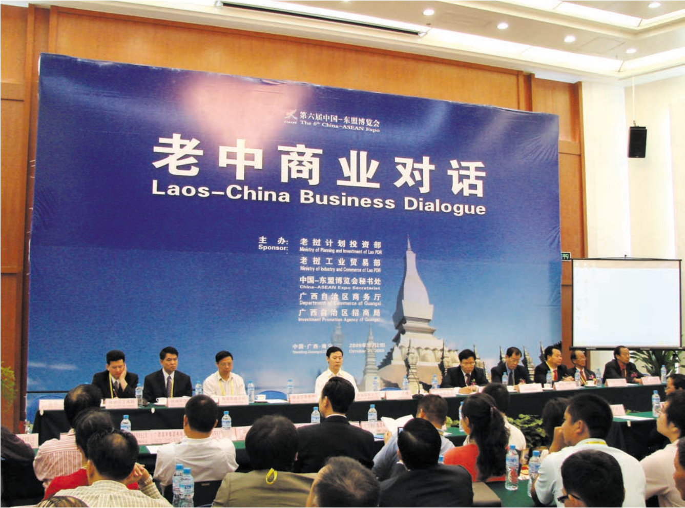
ການສົນທະນາການຄ້າລະຫວ່າງລາວ-ຈີນ 中老商业对话