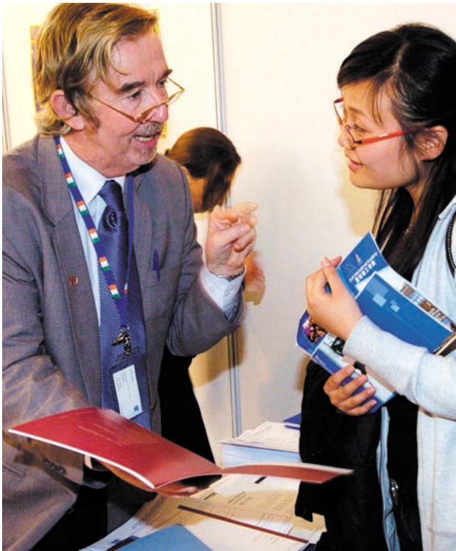
ງານວາງສະແດງສຶກສາທີ່ການສາກົນສາລະເວສປຈີນຄັ້ງທີ 12 ໄດ້ຈັດຂຶ້ນທີ່ນາມກິ່ວມິນະຫາວິທະຍາໄລ, ວິທະຍາຄານແລະອົງການສຶກສາທີ່ມາຈາກປະເທດຕ່າງໆເກືອບ 100 ຫລັງຮ່ວມງານເພື່ອສະໜອງການບໍລິການດ້ານທີ່ປຶກສາແກ້ນັກສຶກສາຈີນທີ່ລັດສິ່ງອອກຫຼືໃຊ້ທຶນສ່ວນຕົວ 第十二届中国国际教育巡回展在南京举行, 来自各国的近百家院校和教育机构参展, 为中国公派和自费出国留学人员提供咨询服务

ນະທຳເປັນຕົ້ນ, ຍັງໄດ້ເຜີຍແຜ່ວັດທະນະທຳຈີນທີ່ກົມກຽວ ແລະພາບພົດຂອງຈີນທີ່ມີຕະພາບໄມຕິຈິດແກ່ທົ່ວໂລກອີກດ້ວຍ.