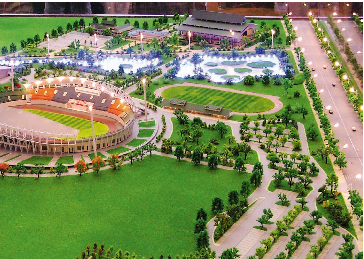
ງານມະຫາກຳກິລາຊີເກມຄັ້ງທີ 25 ຈະຈັດຂຶ້ນທີ່ນະຄອນຫຼວງວຽງຈັນ. ພາບນີ້ແມ່ນຮູບຈຳລອງຫໍສະໜາມກິລາ 第25届东南亚运动会即将在老挝万象举行。图为场馆模型