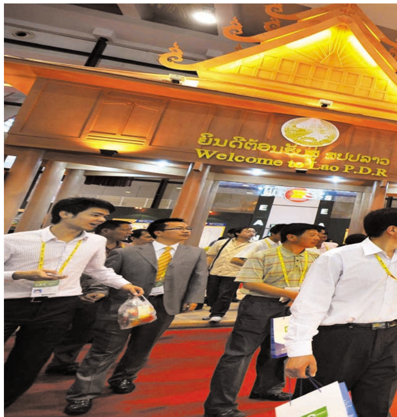
ຫ້ອງວາງສະແດງຂອງສະຫວັນນະເຂດ “ຕົວເມືອງທີ່ມີສະເໜ່” ແຫ່ງປະເທດລາວ 老撾“魅力之城”沙湾拿吉省展厅

ເລີ່ມແຕ່ງານວາງສະແດງສິນຄ້າຈີນ-ອາຊຽນຄັ້ງທີ 2 ເປັນຕົ້ນມາ, ຕົວເມືອງທີ່ມີສະເໜ່ຂອງປະເທດຕ່າງໆທີ່ໄດ້ສະເໜີໃນເຂດວາງສະແດງເຊິ່ງເປັນຫົວຂໍ້ຂອງຊາດນັ້ນກໍໄດ້ກາຍເປັນຈຸດຮຸ່ງໃສໃຫຍ່ຈຸດໜຶ່ງໄລຍະງານວາງສະແດງ, ໄດ້ດູດດຶງສາຍຕານັກທຸລະກິດເປັນຈຳນວນຫຼວງຫຼາຍ. ລາວເປັນປະເທດເຈົ້າພາຍຂອງງານວາງສະແດງສິນຄ້າຈີນ-ອາຊຽນຄັ້ງທີ 6 ກໍໄດ້ນຳ