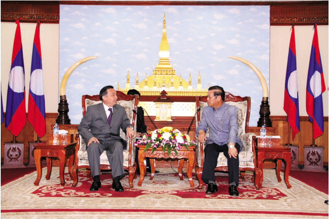
ທ່ານ ສົມສະຫວາດ ເລັງສະຫວັດ ຮອງນາຍົກລັດຖະມົນຕີຜູ້ປະຈຳການລັດຖະບານລາວໄດ້ພົບປະທ່ານຫວາງເຊິນຫົວໜ້າຫ້ອງການຖະແຫຼງຂ່າວຄະນະລັດຖະບານ ສປປ ຈີນທີ່ນາຍົກຢາມຢູ່ທີ່ວຽງຈັນ ລາວ 老挝政府常务副总理宋萨瓦·凌萨瓦在万象会见到访的中国国务院新闻办主任王晨