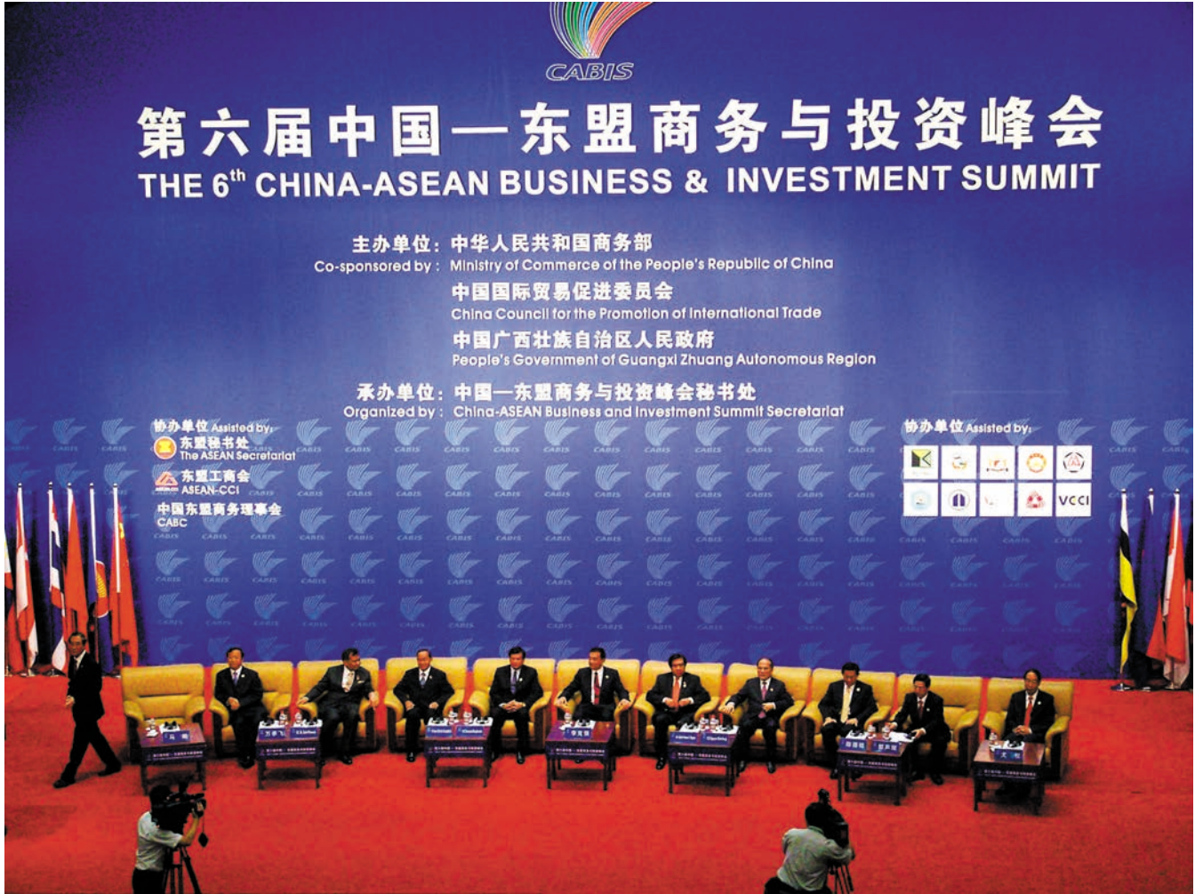
ທີ່ປະຊຸມສຸດຍອດທຸລະກິດ ແລະ ການລົງທຶນຈີນ-ອາຊຽນຄັ້ງທີ 6 第六届中国—东盟商务与投资峰会现场

ເປັນເວທີປາຖະກະຖາຫົວຂໍ້ຫຼັກຂອງງານວາງສະແດງຄັ້ງນີ້. ໃນເວທີປາຖະກະຖາຄັ້ງນີ້, ຜູ້ຮັບຜິດຊອບກົມໃຫຍ່ພາສີຈີນ ແລະ ລັດຖະມົນຕີນກະຊວງການເງິນ, ຜູ້ຮັບຜິດຊອບພາກສ່ວນດ່ານພາສີ ແລະ ຕົວແທນວິສາຫະກິດທີ່ກ່ຽວຂ້ອງຂອງບັນດາປະເທດອາຊຽນໄດ້ປຶ້ນອ້ອມບັນຍັດແກ່ນສານ " ຊຸກຍູ້ການຄ້າເປັນແບບງ່າຍດາຍ " ໄດ້ດຳເນີນການຄົ້ນຄວ້າອະພິປາຍຢ່າງກວ້າງຂວາງ ແລະ ເລິກເຊິ່ງ, ໃນງານອັດພິທີປາຖະກະຖານັ້ນ, ໄດ້ຜ່ານ " ຂໍ້ສະເໜີນຳສິ່ງການຄ້າຈີນ-ອາຊຽນນານນິນເປັນແບບງ່າຍດາຍ " ຢ່າງເປັນເອກະສັນກັນເຊິ່ງແນ່ໃສ່ການຊຸກຍູ້ການຄ້າເປັນແບບງ່າຍດາຍ ແລະ ພັດທະນາຢ່າງເລິກເຊິ່ງ, ຊຸກດັນການຄືບໜ້າເສດຖະກິດເປັນອັນໜຶ່ງອັນດຽວກັນອັນສູ່ລະດັບສູງອັນໃໝ່. ນອກນັ້ນ, ເວທີປາຖະກະຖາຫົວຂໍ້ສະເພາະອັນອື່ນທີ່ຈັດຂຶ້ນໃນງານວາງສະແດງຄັ້ງນີ້, ກໍໄດ້ຮັບໜ່ວຍຜົນອຸດົມສົມບູນທາງດ້ານຂົງເຂດທີ່ແຕກຕ່າງກັນ. ເວທີປາຖະກະຖາຜູ້ນຳການເງິນໄດ້ຜ່ານ " ຖະແຫຼງການ