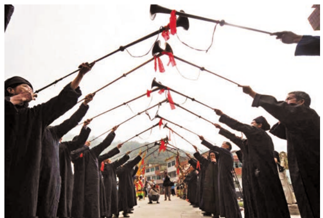
ຜົ້ນຂອງເຜົ່າສູຍເປົ່າແກ 水族同胞吹起唢呐