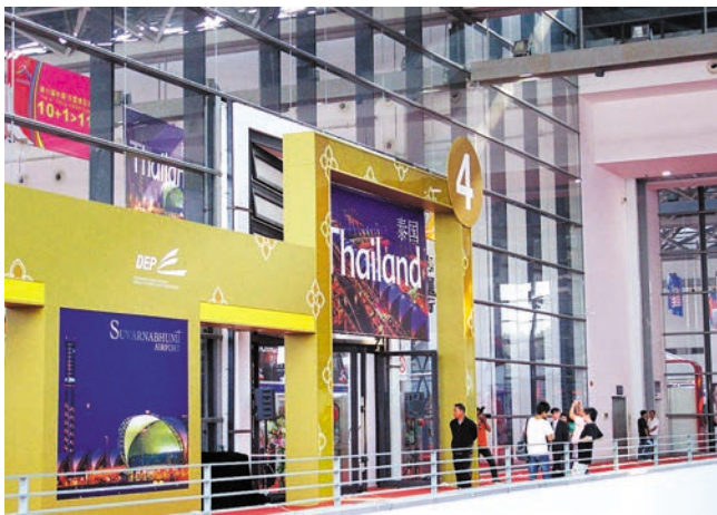
ຫໍວາງສະແດງປະເທດໄທ 泰国展馆

4 ຫົວຂໍ້ຄື: ການຊື້ຂາຍສິນຄ້າ, ການຮ່ວມມືລົງທຶນ, ເຕັກນິກເຕັກໂນໂລຊີທັນສະໄໝ ແລະ "ຕົວເມືອງທີ່ມີສະເໝ" ທີ່ຈັດຂຶ້ນໃນງານວາງສະແດງສິນຄ້າຈີນ-ອາຊຽນຄັ້ງທີ 6 ນັ້ນລວມຕັ້ງຮ້ານວາງສະແດງ 4000 ຮ້ານ. ງານວາງສະແດງເປັນເວລາ 5 ວັນໄດ້ດູດດຶງນັກທຸລະກິດເກືອບ 50 ພັນຄົນເຊິ່ງມາຈາກຈີນ, ປະເທດຕ່າງໆ ແລະເຂດແຄ້ວນມາເຂົ້າຮ່ວມ, ຍອດມູນຄ່າຊື້ຂາຍລວມສິນກາຍ 16 ຮ້ອຍລ້ານໂດລາສະຫະລັດ.