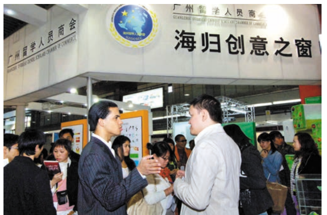
ເວທີວາງສະແດງສະພາການຄ້ານັກສຶກສາທີ່ຮຽນຢູ່ຕ່າງປະເທດກວາງໂຈວໃນສັບປະດາອອກ ແບບສາກົນກວາງໂຈວ 广州国际设计周上的广州留学人员商会展台