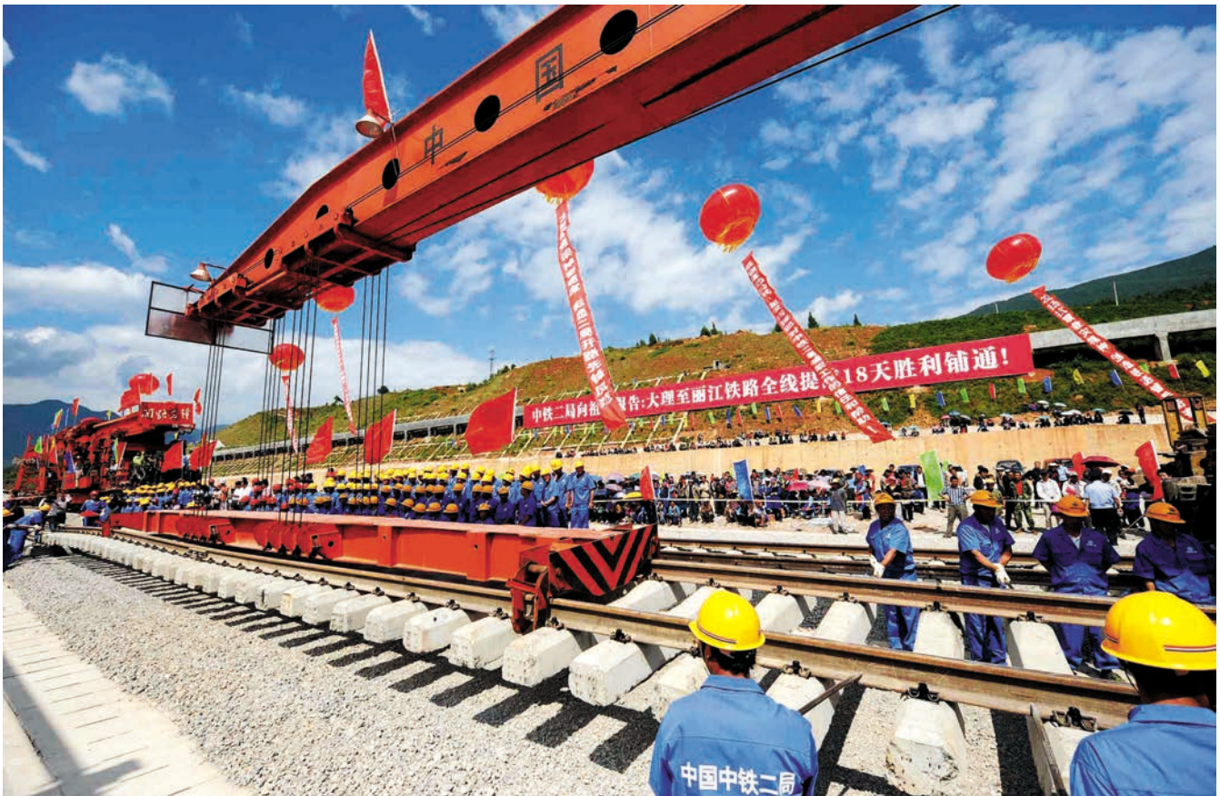
ທາງລົດໄຟຕາລີ-ຫລີຈຽງແຂວງຢູນນານໄດ້ສຳເລັດປູລາງເຫຼັກທົ່ວທັງສາຍແລ້ວ. 云南大丽铁路全线铺通 新华社图