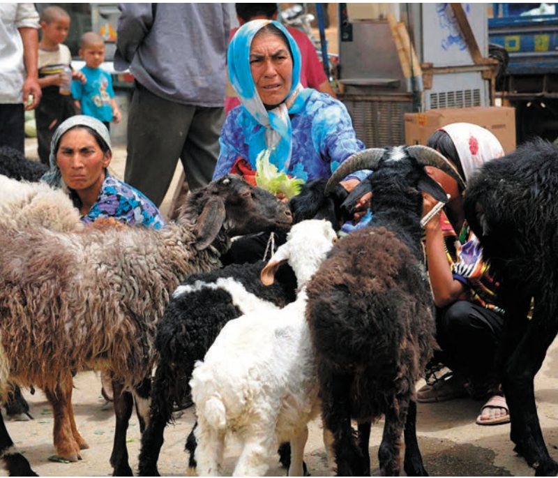
ແມ່ຍິງຫຼາຍຄົນກໍາລັງຂາຍໂຕແກະທີ່ລ້ຽງເອົາເອງໃນຕະຫລາດນັດສາກົນເຄີຊີບາຈາ. 几名农村妇女在喀什国际大巴扎上销售自家喂养的羊