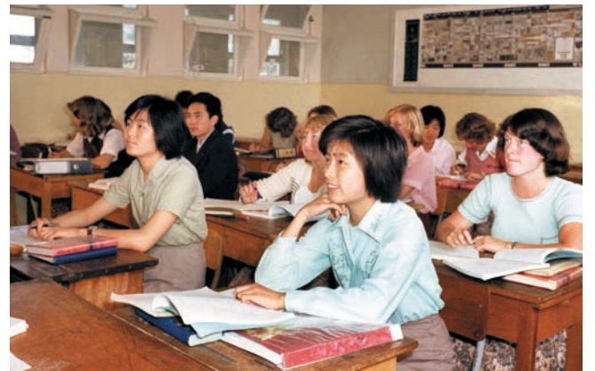
ເດືອນ 6 ປີ 1979, ນັກສຶກສາຈີນບໍາລຸງສ້າງພາສາອັງກິດໃນໂຮງຮຽນມັດທະຍົມຜູ້ຍິງແວນລິງຕັນນູແວນເຊລັງ 1979年6月, 中国留学生在新西兰首都惠灵顿女子中学补习英文

ເດືອນ 6 ປີນັ້ນ, ທ່ານເຕີງຊຽວຜິງໄດ້ຊີ້ນໍາກ່ຽວກັບເລື່ອງເພີ່ມຕື່ມຈໍານວນຄົນສົ່ງນັກສຶກສາໄປຮຽນຢູ່ຕ່າງປະເທດ, ສົ່ງເສີມແລະຂະຫຍາຍຈໍານວນນັກສຶກສາທີ່ໄປຮຽນຢູ່ຕ່າງປະເທດ,