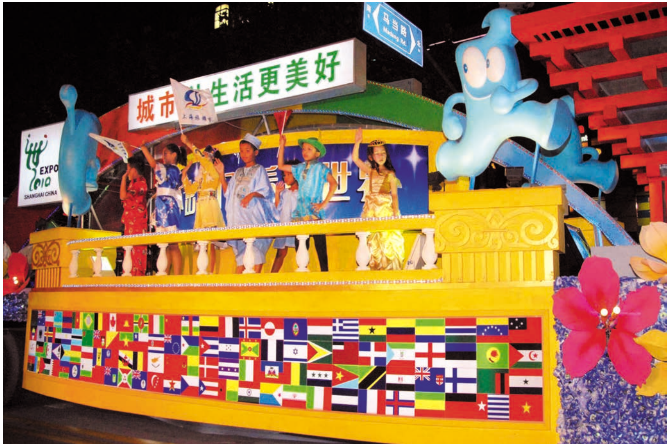
ວັນທ່ອງທ່ຽວຊຽງໄຮປີ 2009 ໄດ້ເປີດສາກ. ອະບວນລົດປະດັບດອກໄມ້ເດີນອະບວນຢ່າງອະໄພາດໃຫຍ່ 2009 上海旅游节开幕 花车大巡游盛装亮相 CFP 图

ຄວາມເລິກແລະຄວາມກວ້າງໃນການໂຄສະນາເອກສະໂປໂລກ ເທົ່ານັ້ນ, ຍັງໄດ້ສ້າງເວທີຕິດຕໍ່ຊັບພະຍາກອນທ່ອງທ່ຽວແຫ່ງ ຕ່າງໆກັບເອກສະໂປໂລກຊຽງໄຮ. ເພື່ອຮັບຮັບທັນລົດເອກສະໂປ ໂລກ, ແຫ່ງຕ່າງໆໄດ້ວາງວິທີແປກປະຫລາດຂອງໃຜລາວ, ບາງຄົນ ຖືໂອກາດຮ້ອນຂອງເອກສະໂປໂລກດຳເນີນການຊຸກຍູ້ແນະນຳ ເອົາເອງ, ດູດດຶງແຂກທ່ອງທ່ຽວດ້ວຍທັດສະນີຍະພາບພິເສດ ແລະ ຮິດຄອງປະເພນີຂອງຕົນ, ຕົວຢ່າງຄື: ທ້າຍເດືອນ 8, ກຸຍ ໂຈວກໍໄດ້ດຳເນີນການເຄື່ອນໄຫວຊຸກຍູ້ທີ່ຊຽງໄຮເປັນເວລາໜຶ່ງ ອາທິດ, ໄດ້ຕ້ອນຮັບທ່ານຜູ້ຊົມລວມ 20 ພັນກວ່າຄົນ; ຍັງມີບາງ ຄົນເອົາປັດໃຈເອກສະໂປໂລກ ເຊື່ອມເຂົ້າໃນການເຄື່ອນໄຫວ ທີ່ເປັນມູນເຊື້ອຫຼື ການເຄື່ອນໄຫວສະຫລອງວັນເທສະການ. ຕົວ ຢ່າງຄືບຸນເທສະການການທ່ອງທ່ຽວຊາວອຸແຂວງຈຽງຊຸກຈະ ຕ້ອງຈັດກອງປະຊຸມສຸດຍອດປາຖະກະຖາເອກສະໂປໂລກ ແລະ ການພັດທະນາທ່ອງທ່ຽວ.