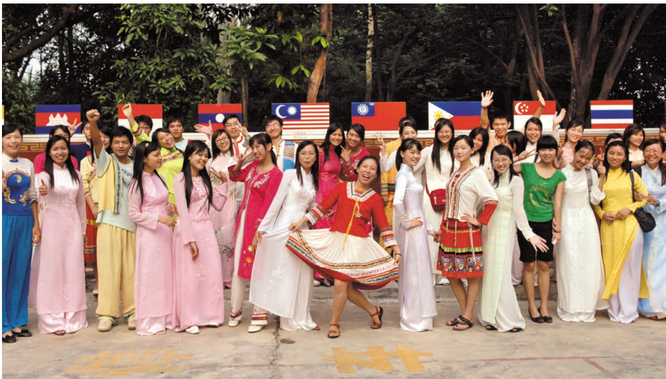
ນັກສຶກສາທີ່ມາຈາກປະເທດຕ່າງໆອາຊຽນໃນວິທະຍາຄານແລກປ່ຽນວັດທະນະທຳສາກົນຂອງມະຫາວິທະຍາໄລຊິນເຜົາກວາງຊິວອມເປີດການມ່ວນຊື່ນ 广西民族大学国际文化交流学院，来自东盟各国的留学生们正在联欢

ທ່ານຫາວຜິນສະແດງວ່າ, ຈີນມີແຜນການຈະເພີ່ມຈຳນວນນັກສຶກສາຕ່າງປະເທດທີ່ມາຮຽນຢູ່ຈີນເຖິງ 5 ແສນຄົນໃນປີ 2020. ພະຍາຍາມບັນລຸ“ແຜນການແລກປ່ຽນນັກສຶກສາແສນຄູ” ເຊິ່ງໃຫ້ນັກສຶກສາຂອງອາຊຽນມາຈີນ ແລະ ນັກສຶກສາຂອງຈີນໄປອາຊຽນລ້ວນແຕ່ເຖິງຈຳນວນ 1 ແສນຄົນ.