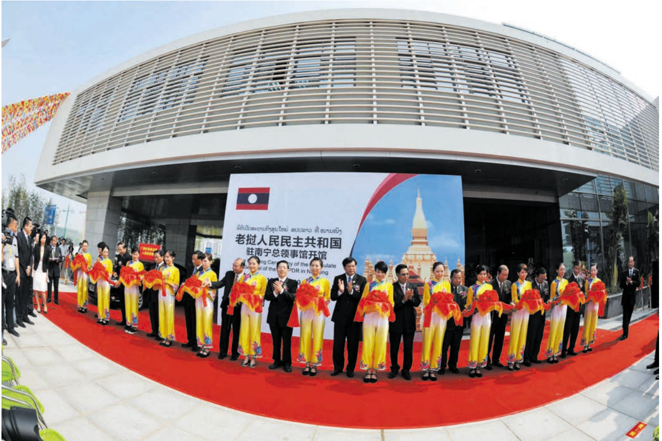
ວັນທີ 19 ຕຸລາປີ 2009. ສະຖານກົງສຸນໃຫຍ່ ສ ປປ ລາວທີ່ຫນານເຫນີງໄດ້ເປີດສຳນັກງານຢ່າງເປັນທາງການທີ່ເຂດການຄ້າອາຊຽນ 2009年10月19日，老挝驻南宁总领事馆在广西南宁市东盟商务区举行开馆仪式