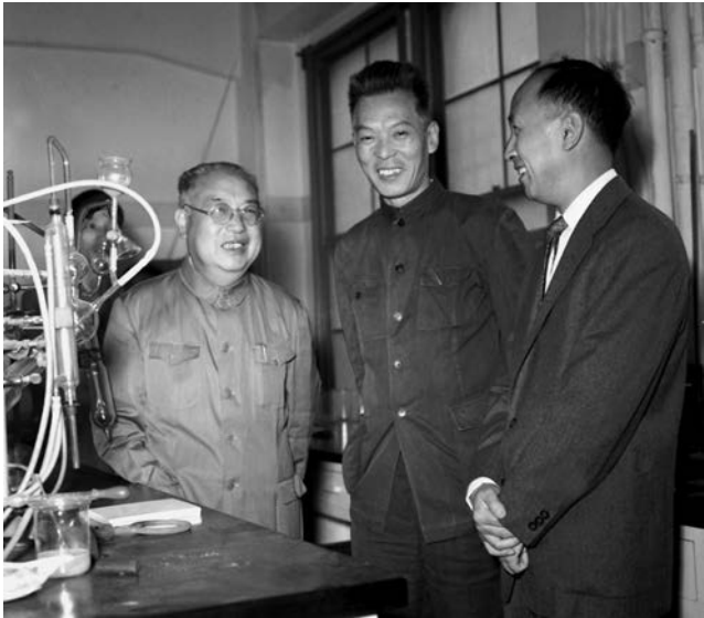
ທ່ານ ຊຽນ ເຊຍແຊນ ນັກວິທະຍາສາດທີ່ມີຊື່ສຽງດົງດັງຂອງຈີນກັບຄືນປະເທດຈາກອາເມລິກາ ນາອອດຊຽງໄຮໃນວັນທີ 12 ເດືອນ 10 ປີ 1955 中国著名科学家钱学森从美国返国，在 1955 年 10 月 12 日到达上海