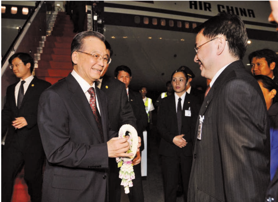
ທ່ານ ເວີນ ເຈຍປາວ ນາຍົກລັດຖະມົນຕີຈີນໄດ້ຮັບຄວາມຍິນດີ ຕ້ອນຮັບຢ່າງສຸດໃຈທີ່ສະໜາມບິນຈາກເຈົ້າໜ້າທີ່ໄທ ແລະ ຜະນິກງານການທຸດຈີນປະຈໍາປະເທດໄທ 中国国务院总理温家宝在机场受到泰方官员和中国 使馆人员热烈欢迎