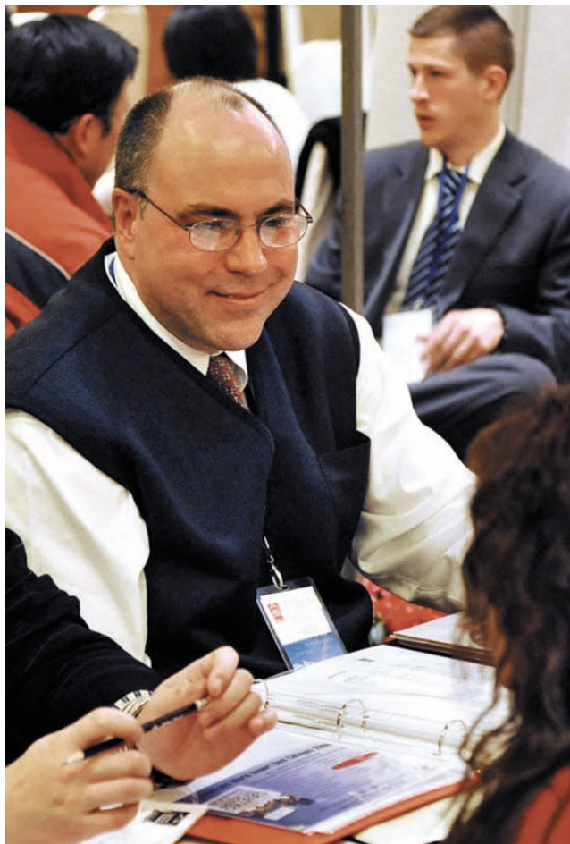
ໂຮງຮຽນຊັ້ນສູງ, ມະຫາວິທະຍາໄລຕ່າງປະເທດນາມາມາກິ່ງຍາດເອົາແຫຼ່ງນັກຮຽນ 海外院校南京抢生源

ຄະລາກອນ; ກອງປະຊຸມໃຫຍ່ຂອງພັກຄັ້ງທີ 17 ສະເໜີຄໍາຮຽກຮ້ອງໃນການພັດທະນາການສຶກສາຢ່າງມີບູລິມະສິດ, ສ້າງສາປະເທດໃຫ້ເຂັ້ມແຂງດ້ວຍຊັບພະຍາກອນບຸກຄະລາກອນອີກ. ໃຕ້ສະຖານະການໃໝ່, ວຽກງານນັກສຶກສາຂອງຈີນໄດ້ຮັບການຂະຫຍາຍຕົວແບບກະໂດດຂັ້ນຢ່າງໃຫຍ່, ເຂົ້າສູ່ໄລຍະດີທີ່ສຸດໃນປະຫວັດສາດ.