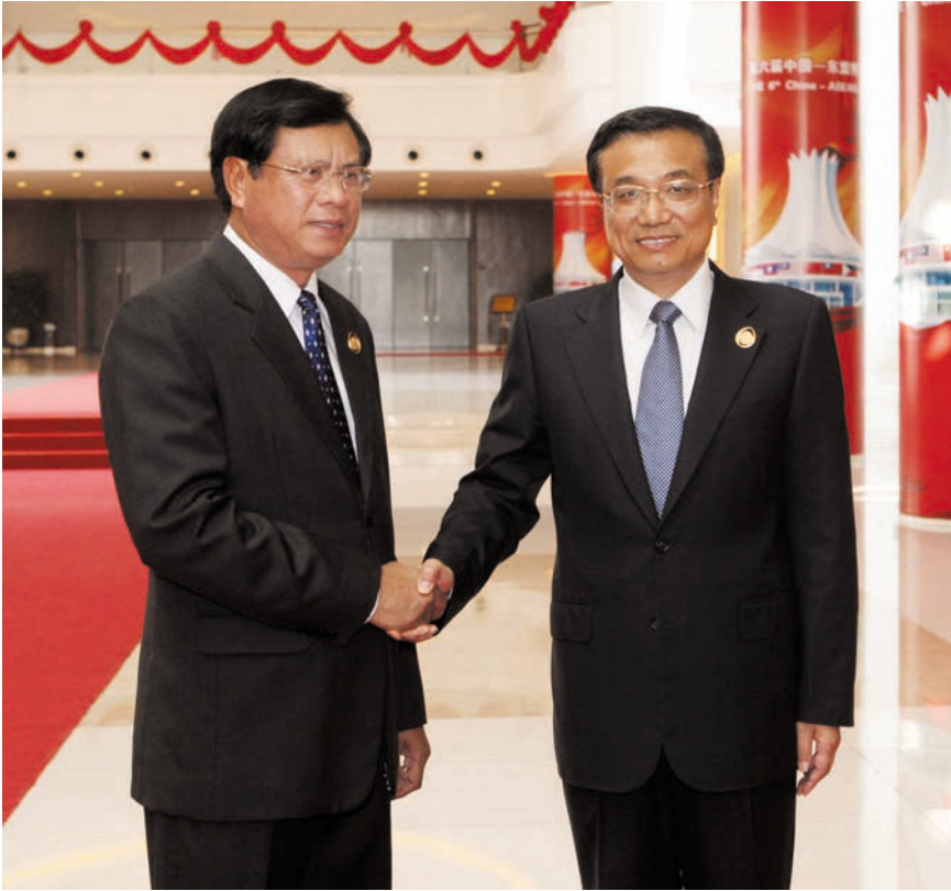
ວັນທີ 19 ຕຸລາປີ 2009. ທ່ານ ລີ ເຄີຊຽງ ຮອງນາຍົກລັດຖະມົນຕີຈີນ ໄດ້ພົບປະທານບົວສອນ ບຸບຜາວັນນາຍົກລັດຖະມົນຕີລາວທີ່ນາຮ່ວມ ງານວາງສະແດງສິນຄ້າຈີນ-ອາຊຽນຄັ້ງທີ 6 2009 年 10 月 19 日, 中国国务院副总理李克强在广西南宁会见出席第六届中国 - 东盟博览会的老挝总理波松·布帕万