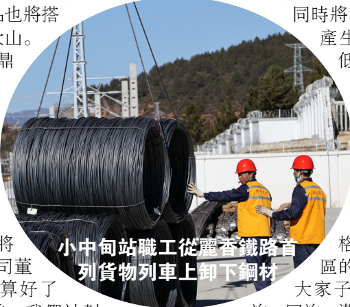
小中甸站職工從麗香鐵路首列貨物列車上卸下鋼材