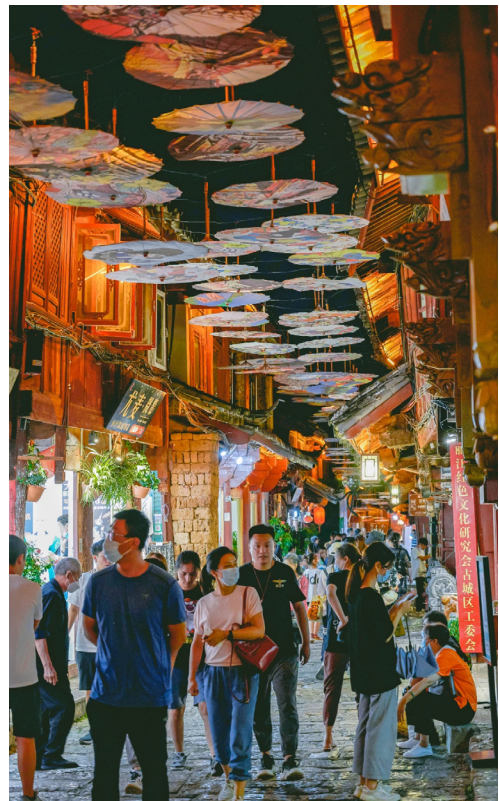
麗江古鎮游人如織