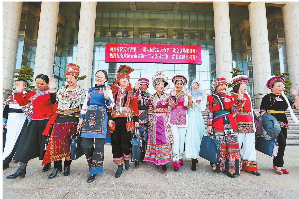
Yunnan memasuki "Waktu Dua Konferensi". Dua Konferensi Yunnan adalah jendela luar biasa bagi dunia untuk mengenal dan mengetahui Yunnan. Yunnan Daily