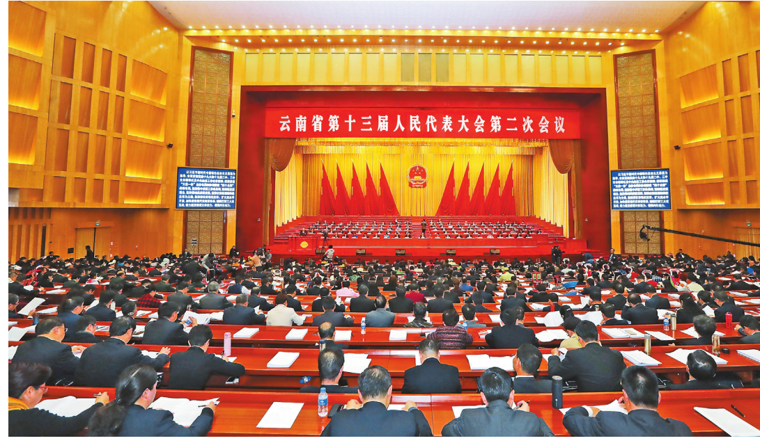
Pertemuan kedua Kongres Rakyat ke-13 Provinsi Yunnan dimulai di Kunming.

Catatan Redaksi: Pada 25 Januari sore, pertemuan kedua Komite ke-12 Yunnan untuk Konferensi Permusyawaratan Politik Rakyat Tiongkok dimulai dengan resmi di Aula Haigeng Yunnan, Kunming.