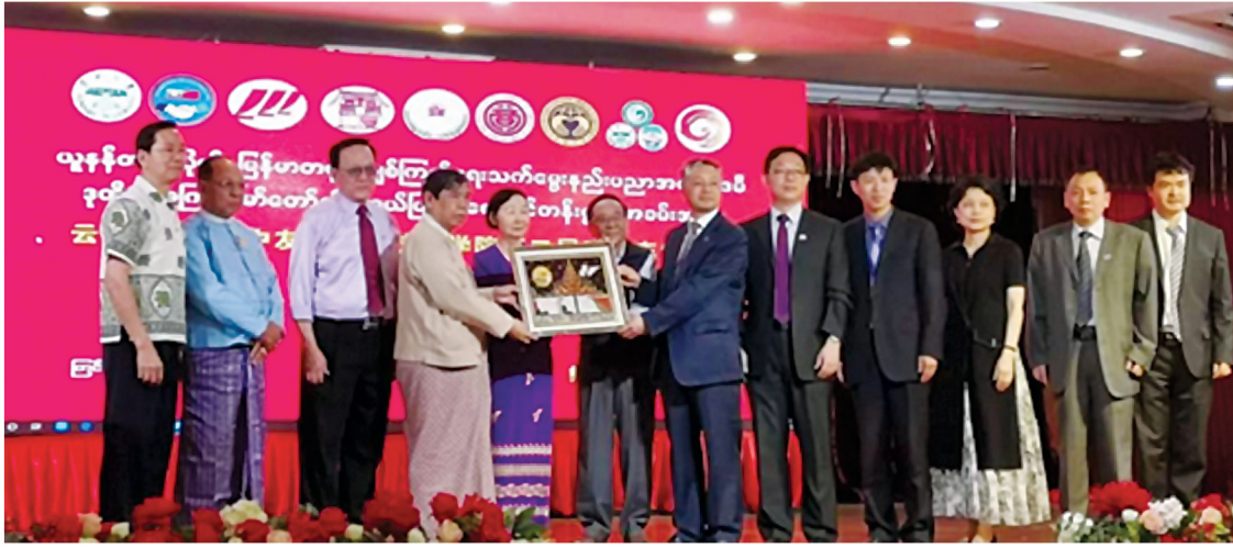
ဟောင်းများကို ပြန်လည်ရောက်ရှိခဲ့ပါကြောင်း၊ ပြုပြင်ပြောင်းလဲတံခါးဖွင့်ပြီးသည့် တရုတ်နိုင်ငံသည် များစွာပြောင်းလဲခဲ့ကြောင်း၊ အဆိုပါ ပြောင်းလဲမှုများကိုကြည့်ရင်း ပီတိအားကျခဲ့ပါကြောင်း၊ မြန်မာလူငယ်များလည်း နည်းပညာများ ကောင်းစွာ

မြန်မာနိုင်ငံ အမျိုးသားလွှတ်တော်ကိုယ်စားလှယ် ဒေါက်တာကျော်သန်းထွန်းက တရုတ်နိုင်ငံမှာ ပညာတော်သင်စဉ်ကာလမှ အမှတ်တရများကို ပြန်လည်တွေးရင်း ၂၀၁၈ ခုနှစ်တွင် တရုတ်နိုင်ငံသို့ ပြန်လည် သွားရောက်လည်ပတ်စဉ် နေရာ