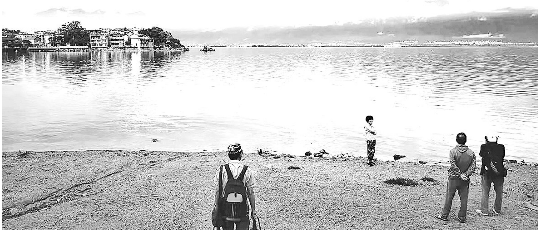
双廊远眺。