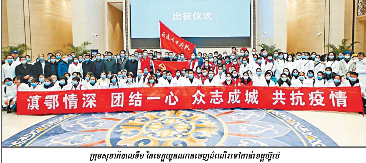
ក្រុមសុខាភិបាលទី១ នៃខេត្តយួនណានចេញដំណើរទៅកាន់ខេត្តហ្វីប៊ែរ