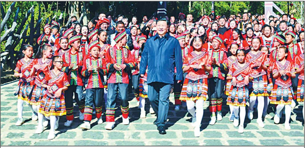
នៅថ្ងៃទី១៩ ខែមករា ឆ្នាំ២០២០ ឯកឧត្តមស៊ី ជិនភីង ប្រធានាធិបតីចិនអញ្ជើញទៅទស្សនាក្រុមជនជាតិវាដុងចាយស៊ីម៉ូវ៉ា ភូមិសាសនាប្រជាជនស្រុកជីងល្បុង ក្រុងប៉ាវសាន

អ្នករៀបរៀង: កាលពីថ្ងៃទី ១៩ ដល់ទី២១ ខែមករា ឆ្នាំ២០២០ ឯកឧត្តម ស៊ី ជិនភីង អគ្គលេខាធិការបក្សកុម្មុយនិស្ត ចិនប្រធានាធិបតីចិននិងជាប្រធានគណៈកម្មាធិការយោធាបង្គំបក្សកុម្មុយនិស្តចិនបានអញ្ជើញទៅខេត្តយួនណានដើម្បីសួរសុខទុក្ខជាមួយកម្មាភិបាល និងប្រជាជនជនជាតិផ្សេងៗព្រមទាំងសង្គមនិងវត្តមានដ៏ល្អប្រសើរចំពោះប្រជាជនទូទាំងប្រទេសចិនក្នុងឱកាសបុណ្យចូលឆ្នាំប្រពៃណីចិននេះ។ ឯឆ្នាំមុនឯកឧត្តមធ្លាប់អញ្ជើញមកខេត្តយួនណានម្តង ។ ក្នុងអំឡុងពេល៥ ឆ្នាំកន្លងទៅនោះ ខេត្តយួនណានបានកើតមានការផ្លាស់ប្តូរច្រើនគួរឱ្យកត់សម្គាល់ ។ កាលពីដើមឆ្នាំមុនចុះផ្សាយនូវអត្ថបទអំពីការផ្លាស់ប្តូរនៃខេត្តយួនណានក្នុងរយៈពេល៥ឆ្នាំកន្លងទៅដើម្បីបង្ហាញជូនលោកអ្នកអំពីការរីកចម្រើននៃខេត្តយួនណាន ។