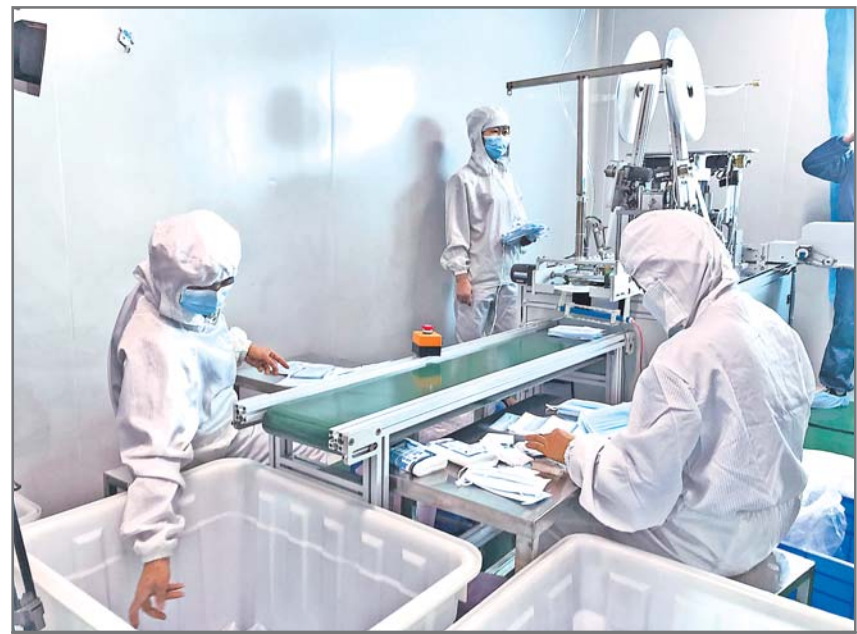
សហគ្រាសលើកម៉ាស់ទាំង សសនៅក្រុងកូនមីងបើកអាជីវកម្មឡើងវិញនិងពន្លឿនការផលិតម៉ាស់

ក្រោយពីជំងឺរលាកសួតបង្កដោយវីរុសកូរ៉ូណាប្រភេទថ្មីផ្ទុះឡើងរៀងរាល់ខែខេត្តយួនណានបានចាត់វិធានការជាច្រើនដើម្បីទប់ទល់នឹងការរាលដាលនៃជំងឺឆ្លងប្រភេទថ្មីនេះ ។