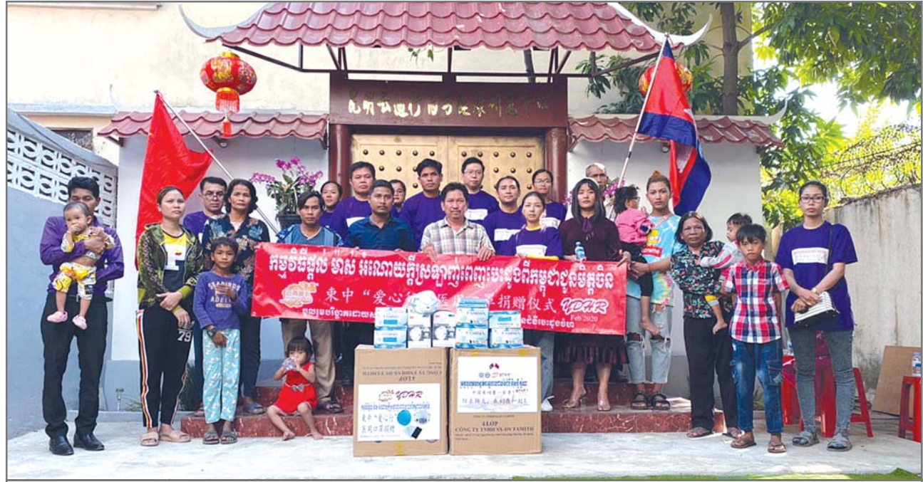
ក្នុងពិធីផ្តល់ អំណោយ អ្នកផ្តល់អំណោយក្តី ស្រឡាញ់ និងអ្នកស្ម័គ្រចិត្តចំពោះ ជាមួយគ្នា

នៅថ្ងៃទី២៥ ខែមករា លោកបានរៀបចំ កម្មវិធីផ្តល់អំណោយក្តីស្រឡាញ់ពេញចិត្តដល់កម្ពុជាជូនមិត្តចិន នៅការិយាល័យនៃមជ្ឈមណ្ឌលសិក្សាស្រាវជ្រាវគីរិយាបថនិងសុខភាពយួនទី ប្រចាំនៅប្រទេសកម្ពុជា ដែលកម្មវិធីនេះមានរយៈពេល ១០ ថ្ងៃ ។